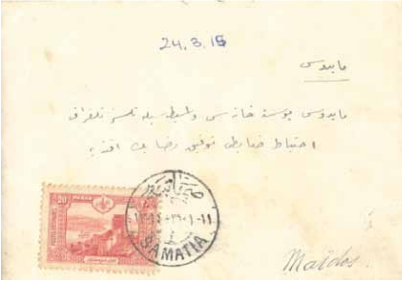
Ek: 1 Belkıs Hanım'ın 24 Mart 1915 tarihli mektubunun zarfı