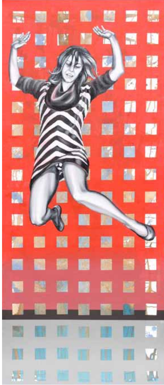
Sıçramalar ve Ötesi Tuval Üzerine Akrilik - Yağlıboya 175x75 cm