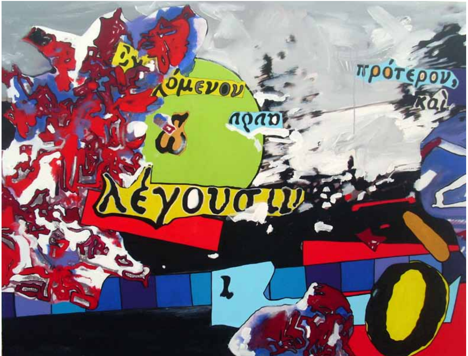
Aristoteles'e Saygı 1 Tuval Üzerine Karişik Teknik 120x160 cm