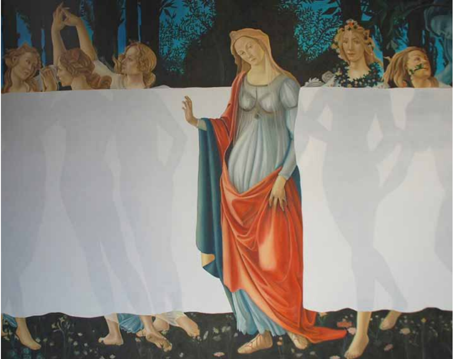
Curtains of Perception Tuval Üzerine Yağlıboya 114x146 cm