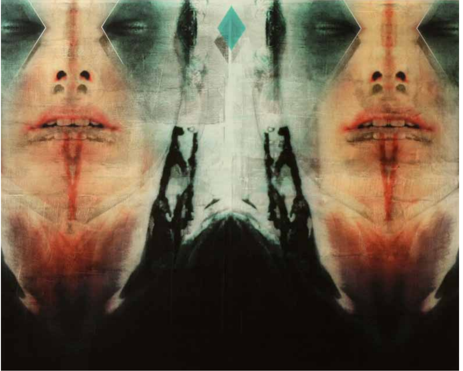
Bilincin Esareti Kağıt Üzerine Karışık Teknik 130x150 cm