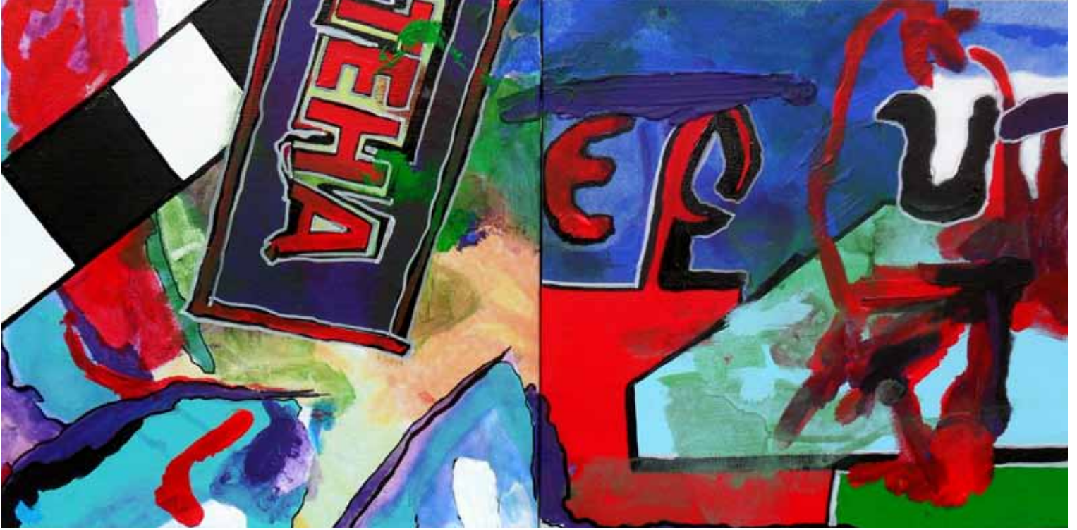
Sokak Tuval Üzerine Karışık Teknik 30x60 cm (Diptik)