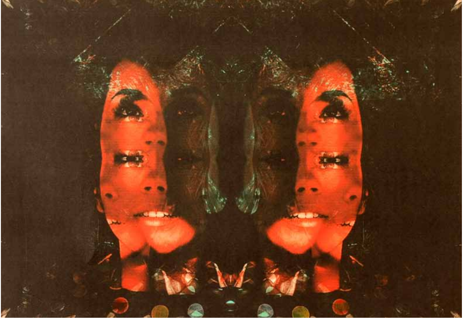
Serbest Bakış Kağıt Üzerine Karışık Teknik 85x105 cm