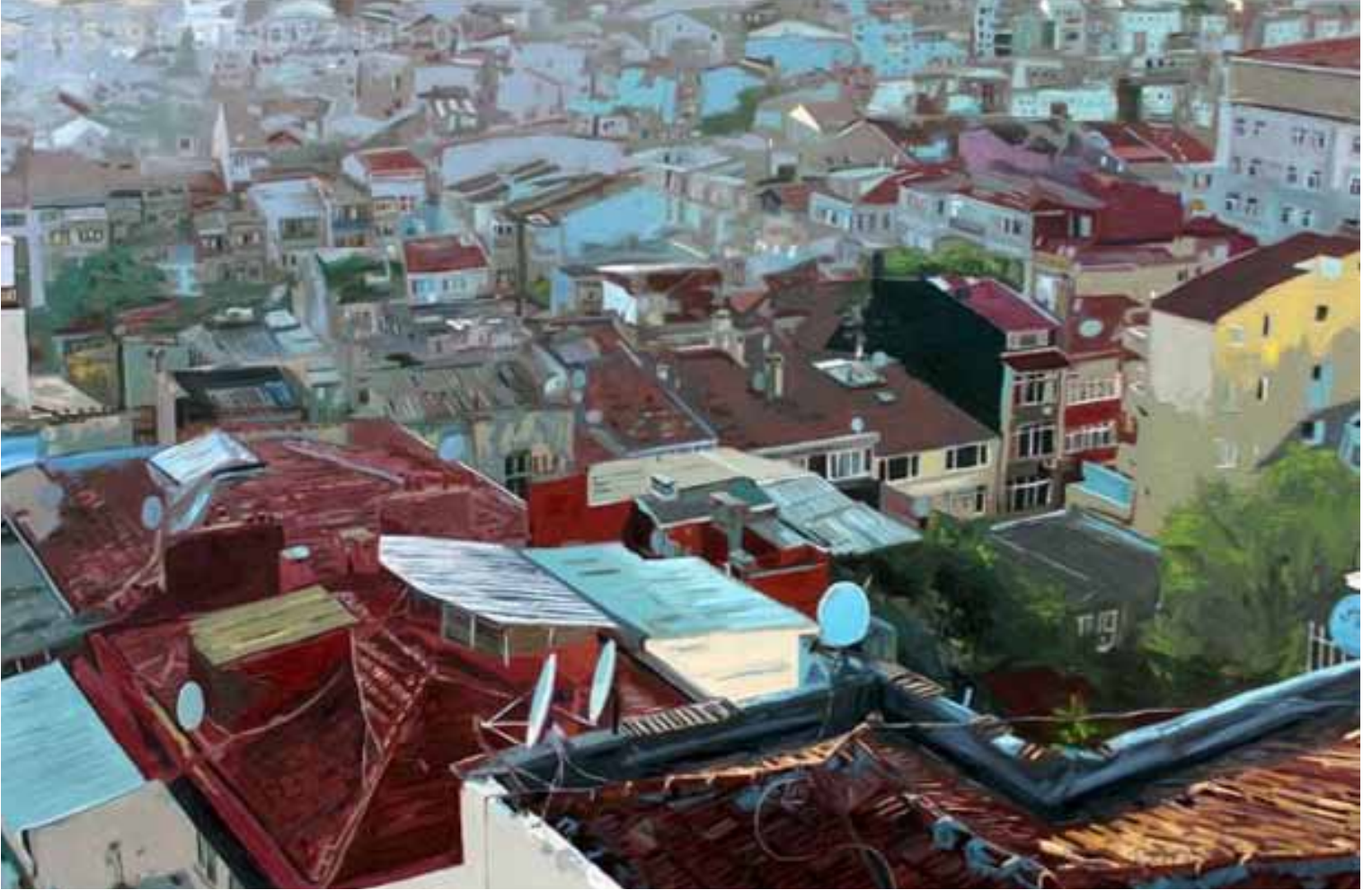
Tuval Üzerine Yağlıboya 120x150 cm