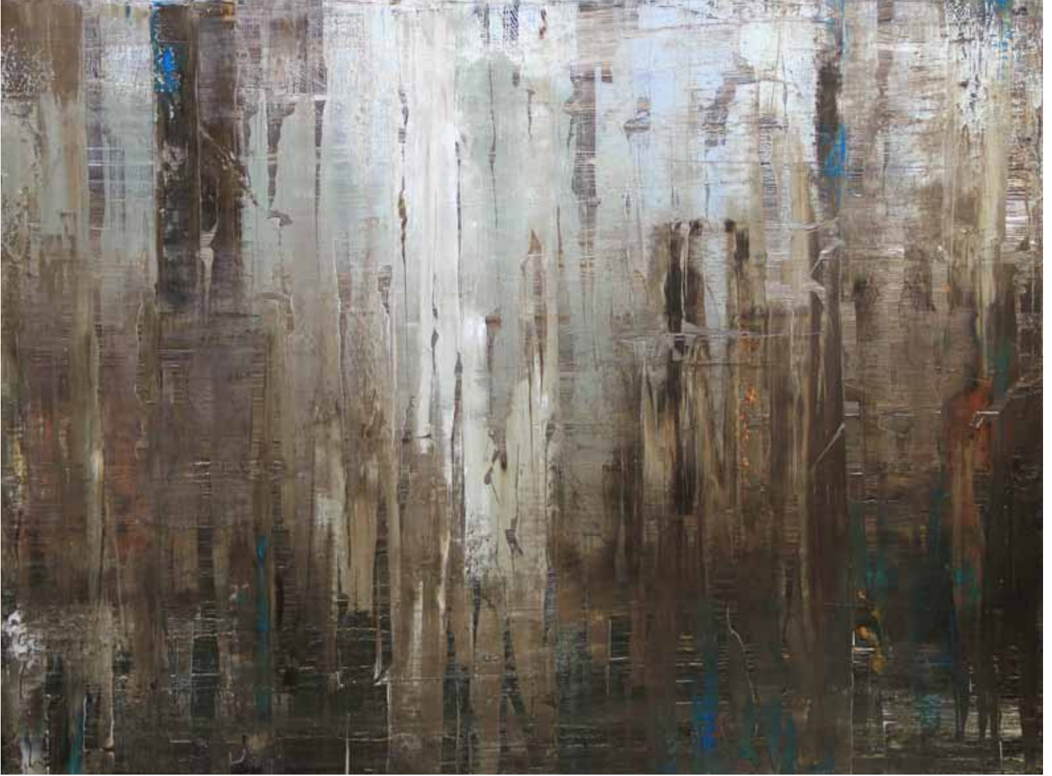
Tuval Üzerine Yağlıboya 150x200 cm