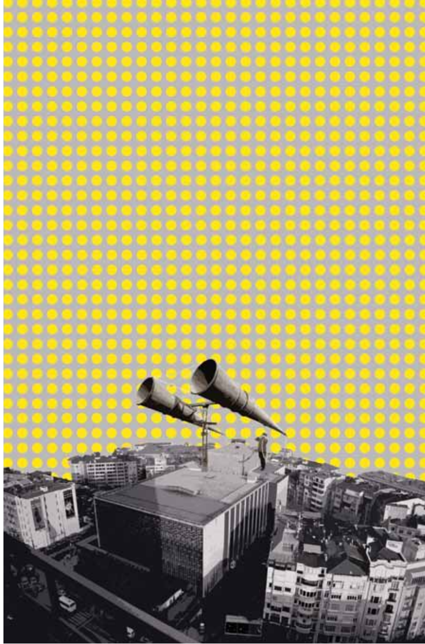
Radar 1 Tuval Üzerine Akrilik - Yağlıboya 220x145 cm