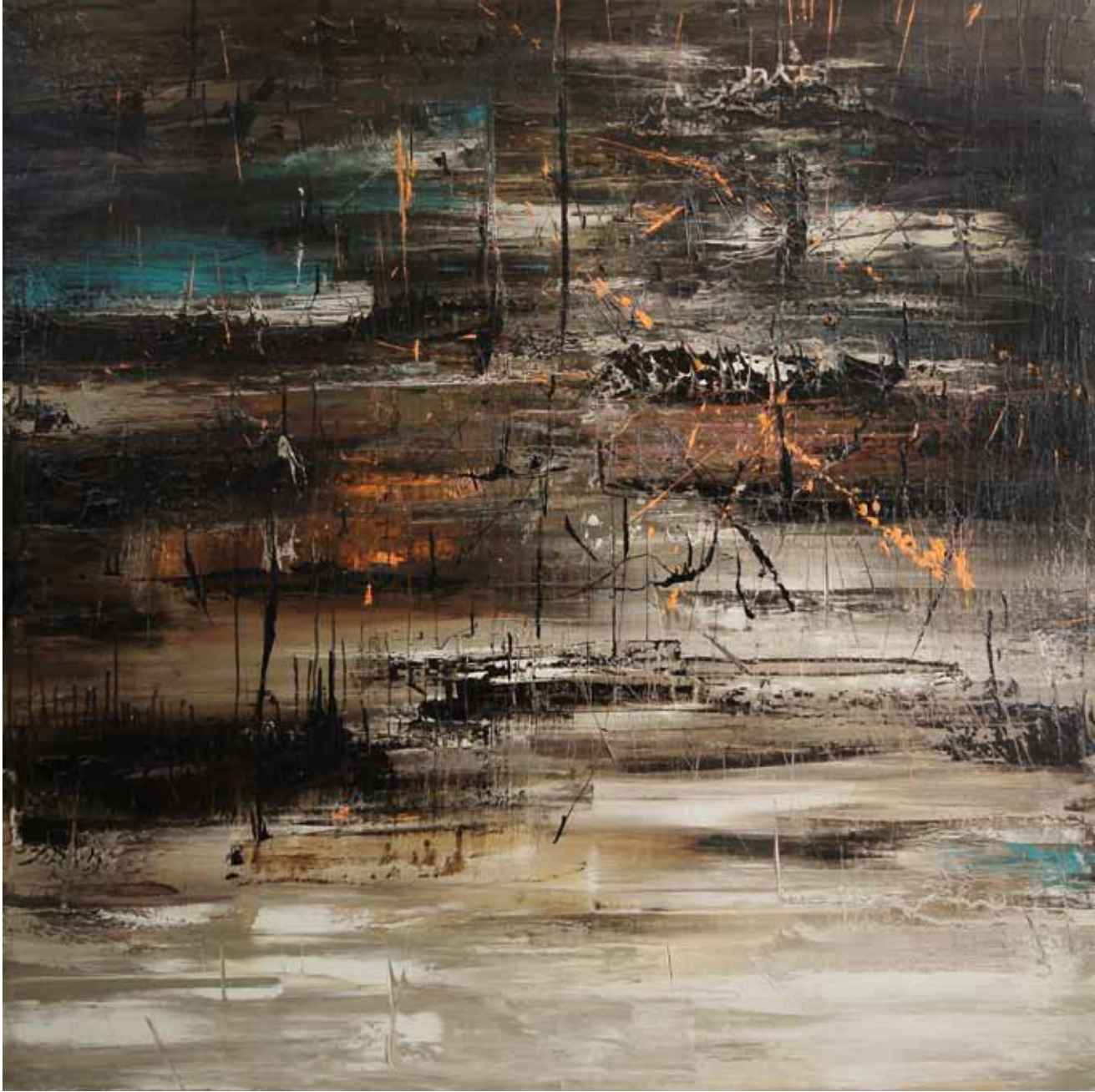
Tuval Üzerine Yağlıboya 150x150 cm