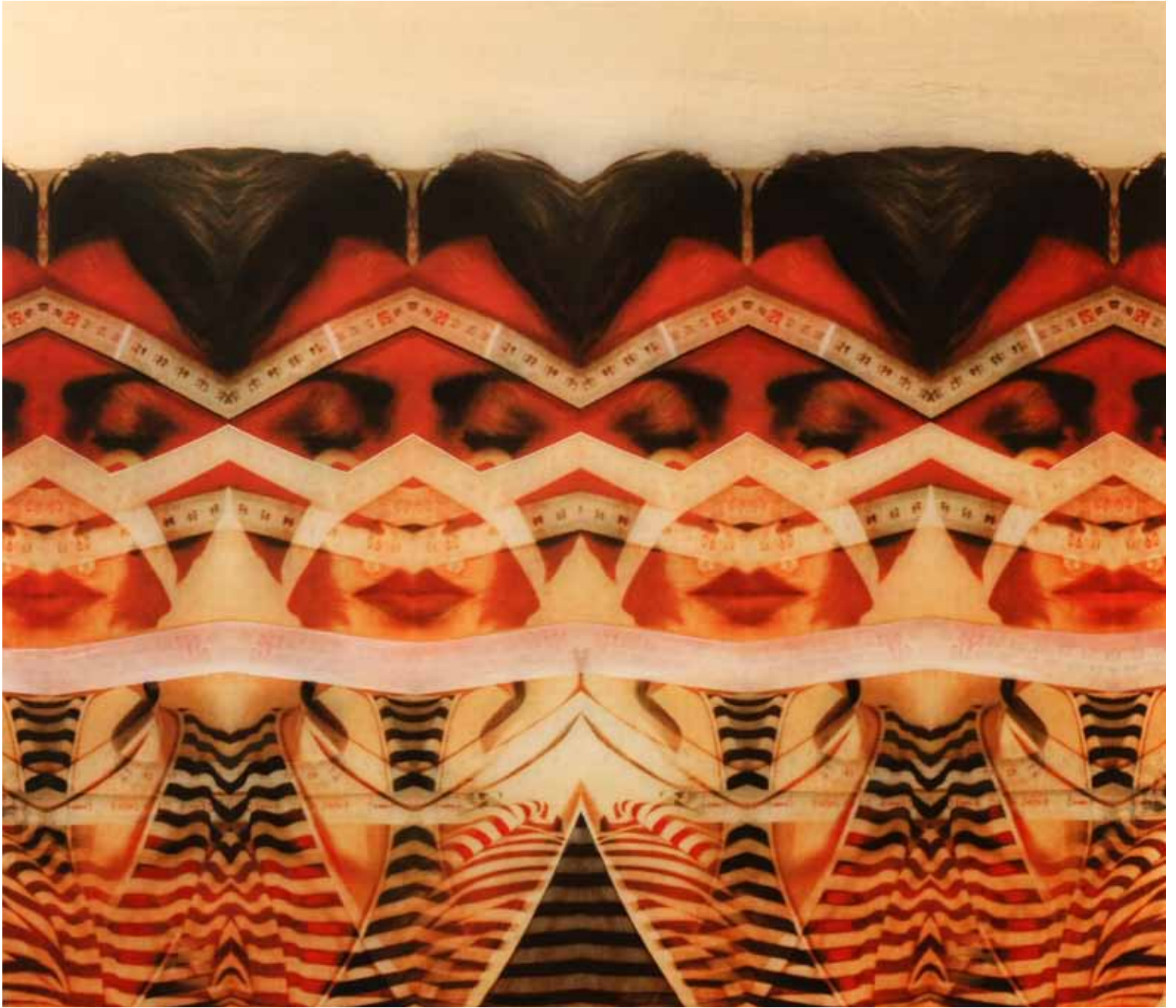
Masumiyetin Ölçüsü Tuval Üzerine Karışık Teknik 130x150 cm