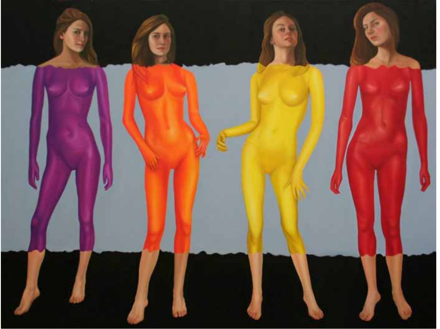
Untitled Mannequins Tuval Üzerine Yağlıboya 150x200 cm