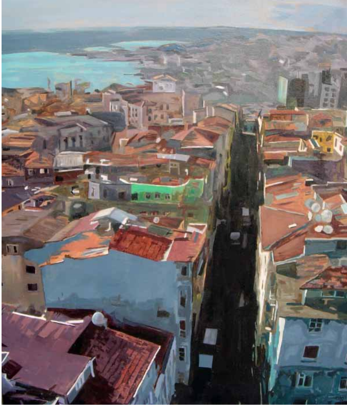
Tuval Üzerine Yağlıboya 120x100 cm