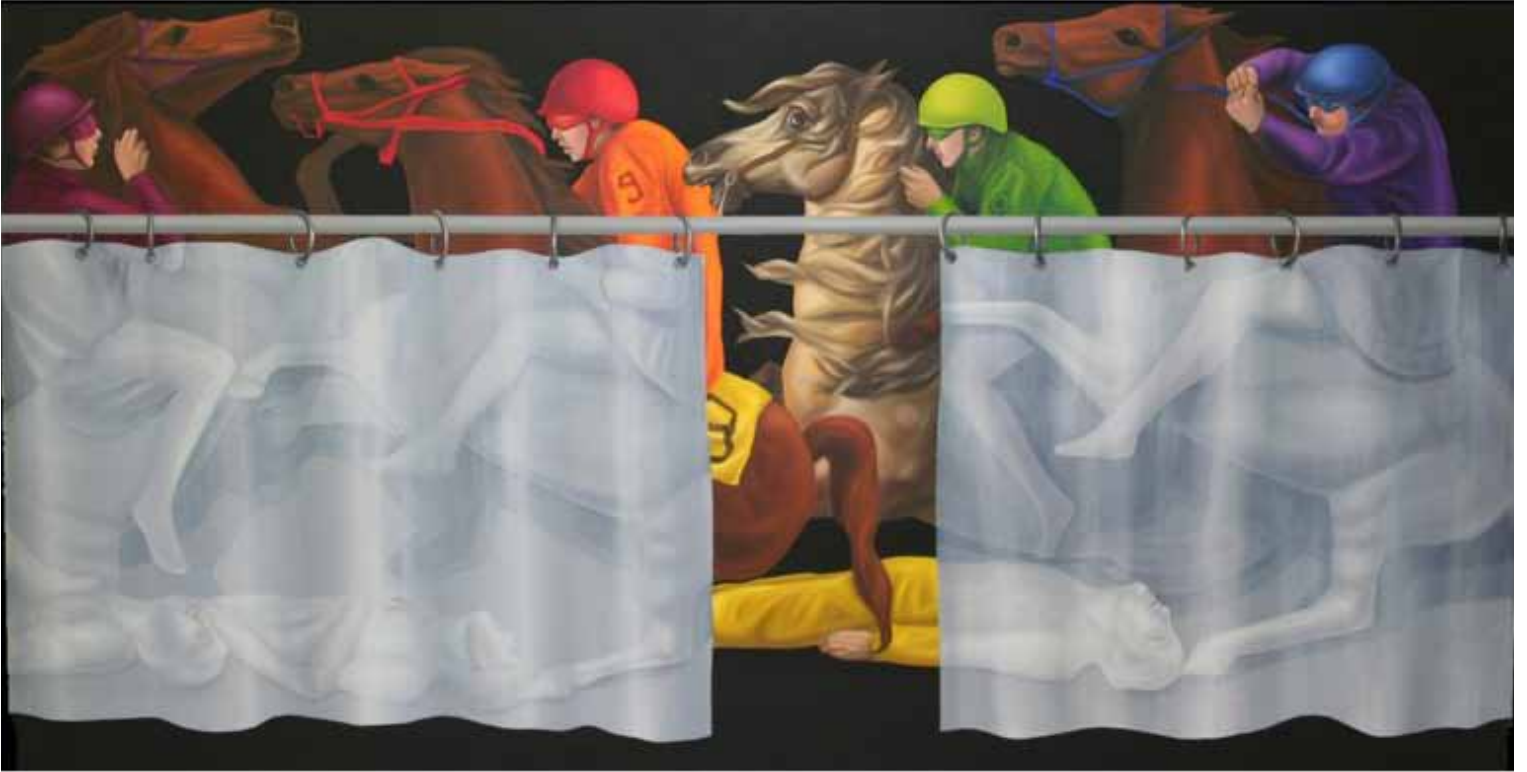
Alexander's Tomb Tuval Üzerine Yağlıboya 94x176 cm