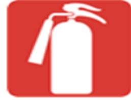
Yangın Söndürme Tüpü