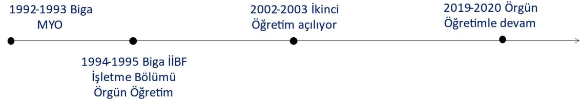
Tablo. A İşletme Programının Tarihçesi

İşletme Bölümü, 30 yılı aşan eğitim-öğretim hayatında sürekli olarak gündemi yakalamaya, iş dünyasında yaşanan değişiklikleri müfredatına ve öğrencilerin eğitim planına aktarmaya çalışan, dinamik, başta öğrencileri olmak üzere tüm paydaşları ile yakın ilişki içerisinde bir bölüm olma gayretindedir. Bölümün logosunda kullanılan bal porsuğu dünyanın en korkusuz hayvanı olarak bilinmekle birlikte, inatçılığı, farklı yaşam şartlarına uyumu, zor durumlardan kurtulma becerisi, hiçbir şeyden korkmayan, sıkıntılı durumlarda kaçmayan, mücadeleci, hedef odaklı özellikleri ile de hayvanlar aleminde özel bir yere sahiptir. "Nothing can stop me" bölümün mottosu olarak bal porsuğunun özellikleri ile paralel şekilde bölümün ve mezunlarının sürekli ileri gideceğini, zorlukların bizi durdurmayacağını işaret etmektedir. İşletme bölümü rekabetçi iş dünyasında böyle mezunlar verme hedefi gütmektedir.