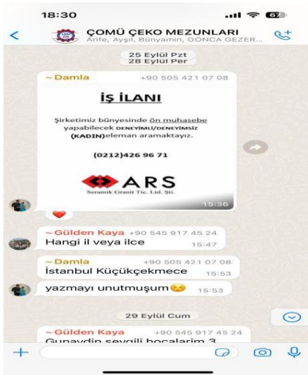
Kanıt: Mezun WhatsApp Grubu