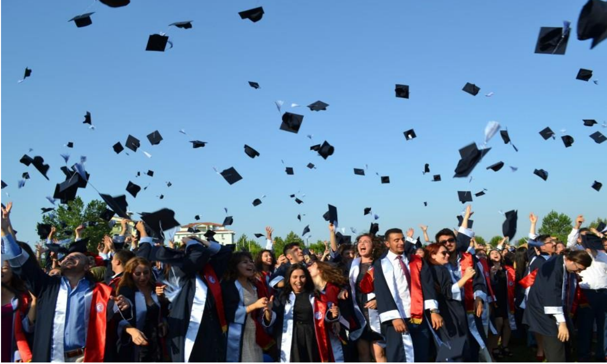
Resim 16 : Mezuniyet Töreni