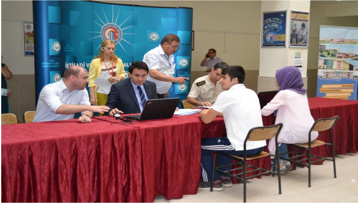
Resim 17 : Öğrenci Kayıtları