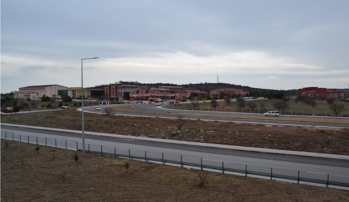
Resim 13 : Fakülte ve Ek tesisleri