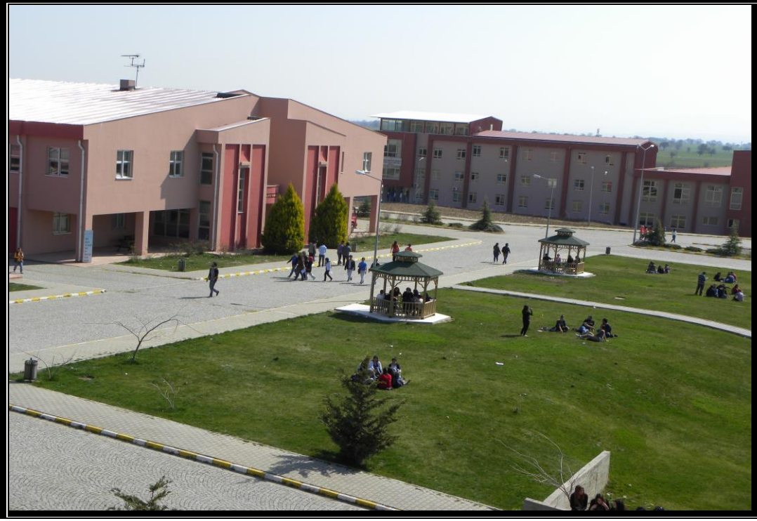
Resim 3 : Yemekhane