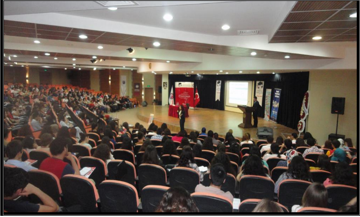
Resim 6 : Didem Yaman Konferans Salonu