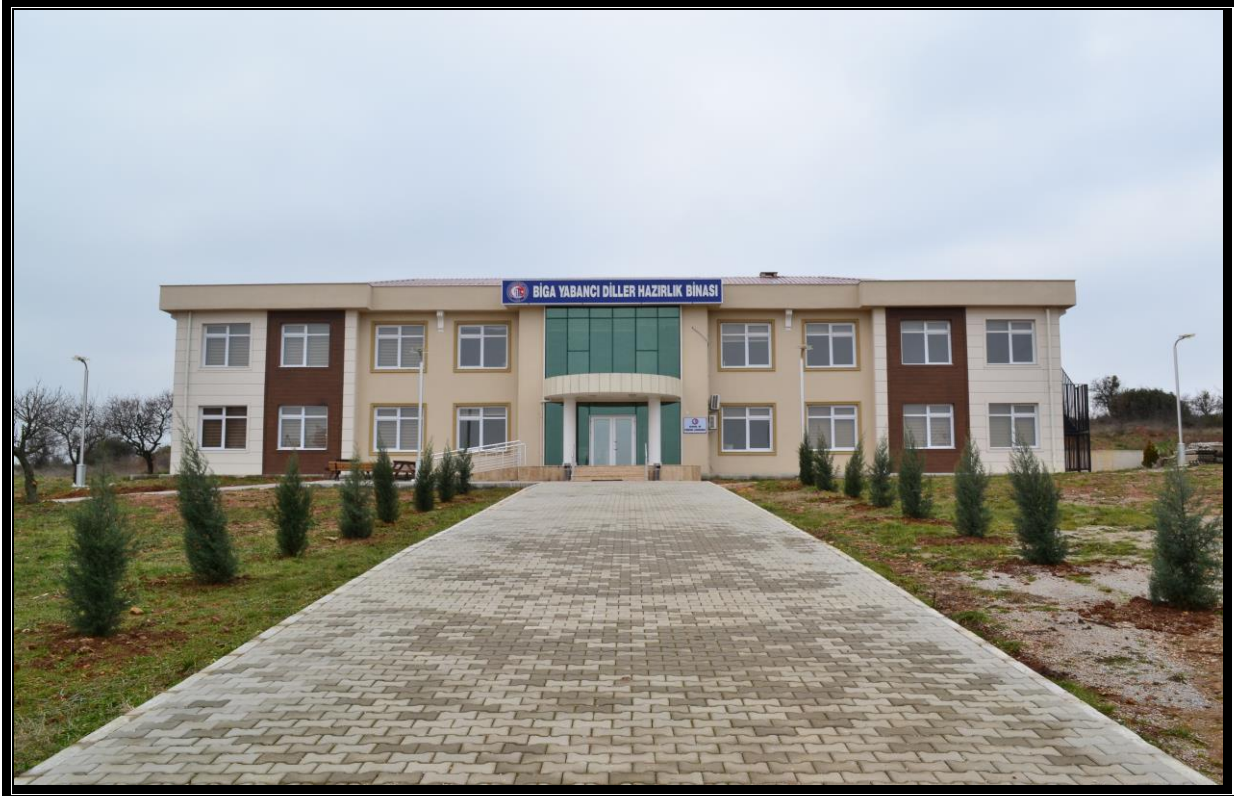
Resim 11 : Yabancı Dil Hazırlık Binası