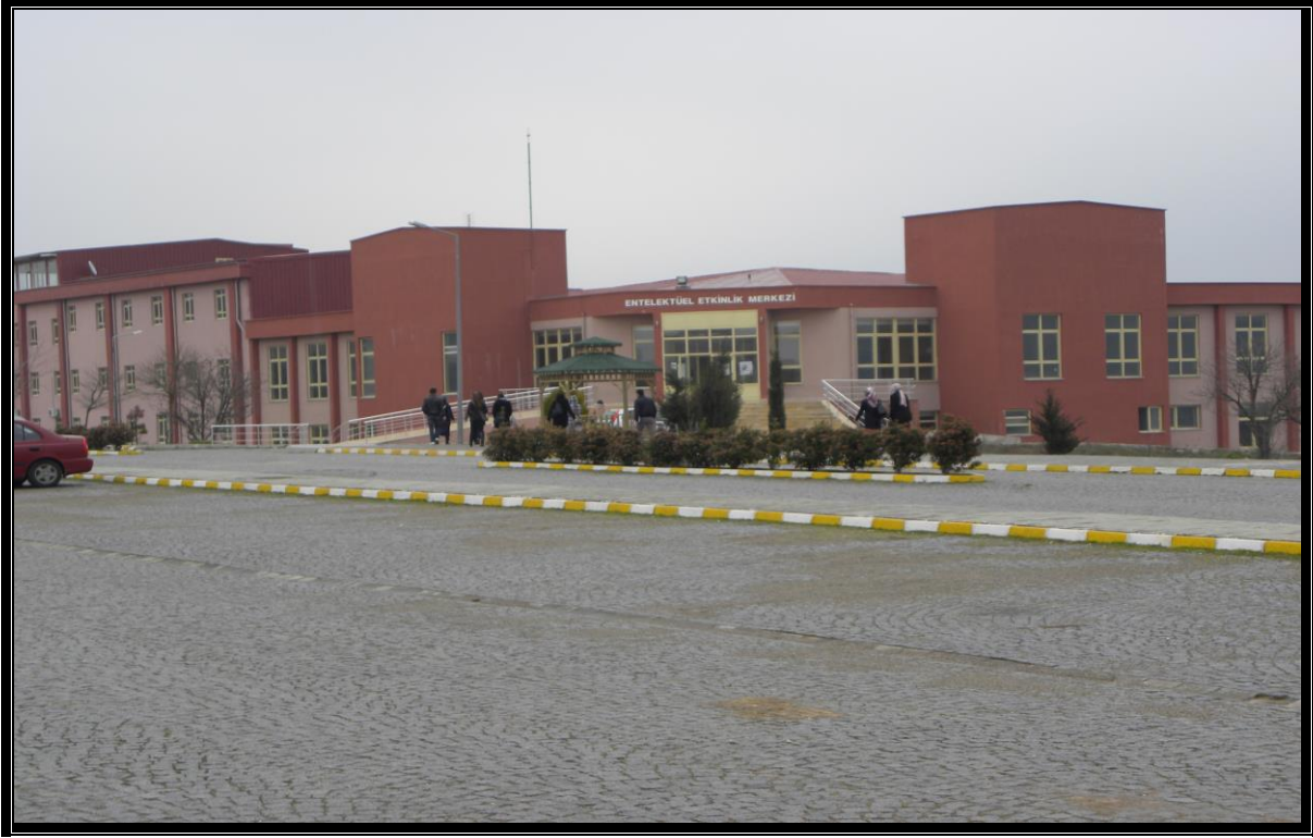
Resim 12 : Entelektüel Etkinlik Merkezi