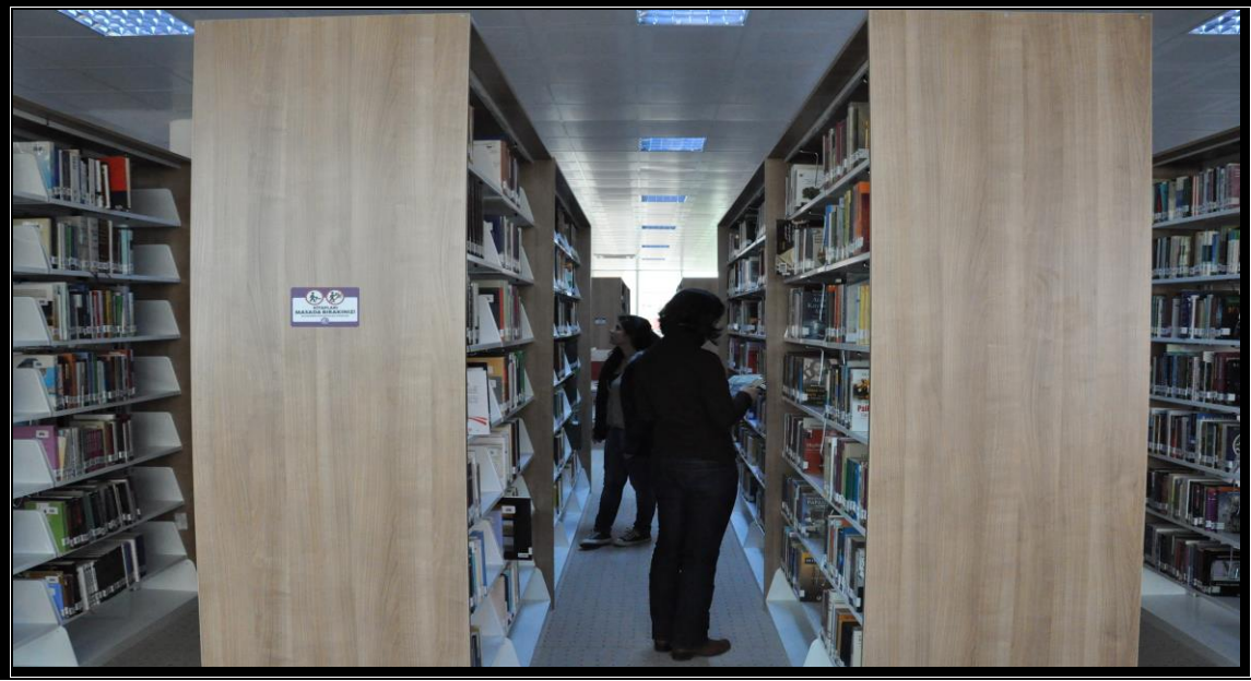
Resim 9 : Biga Kütüphanesi

2013 yılında Prof.Dr.Ramazan Aydın kampüsünde hizmete açılan 250.000 kitap kapasiteli Üniversitemiz Biga Kütüphanesinde, 73.333 yayın bulunmakta ve yayın sayısı artmaya devam etmektedir. Kütüphane 2017 yılında hafta içi her gün 19:00'a kadar, sınav dönemlerinde 7/24 öğrenci ve öğretim elemanlarına hizmet vermiştir.