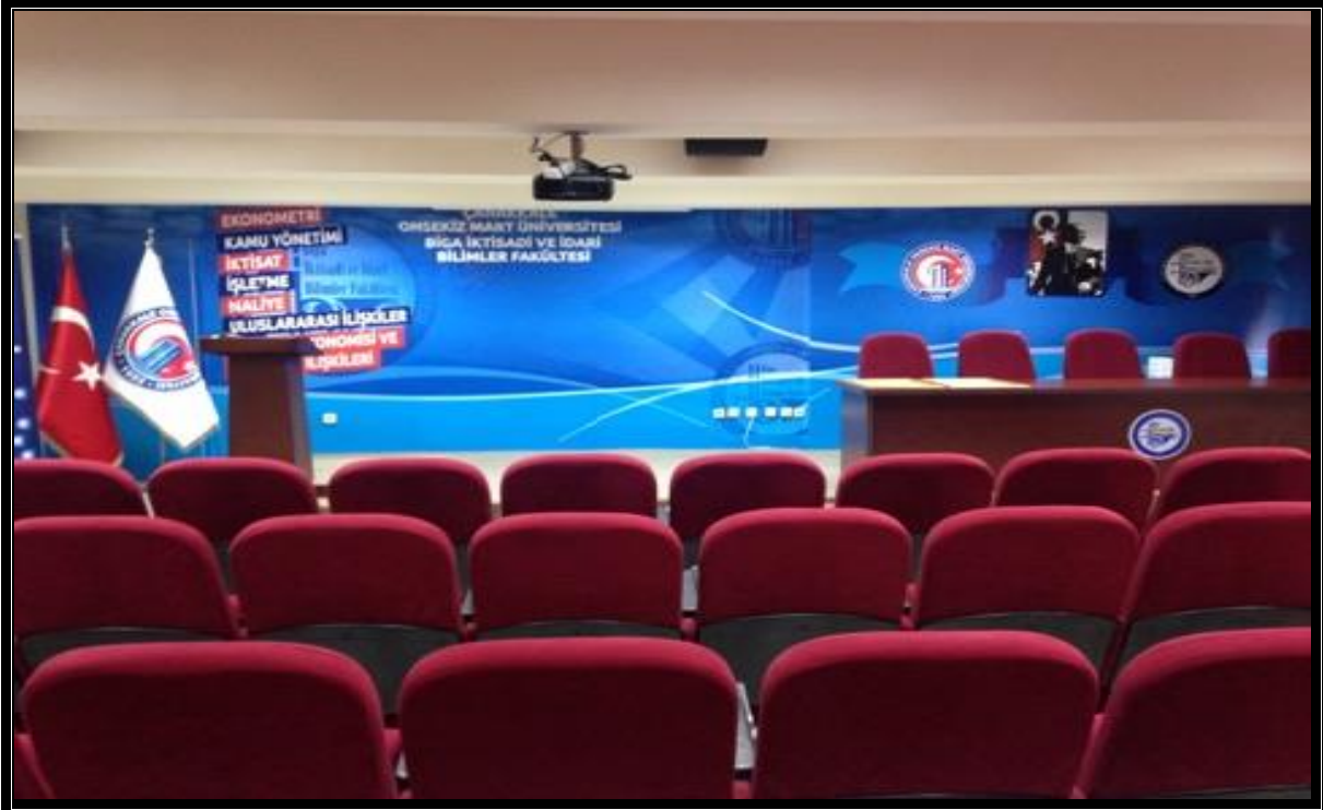
Resim 7 : Dekanlık Konferans Salonu