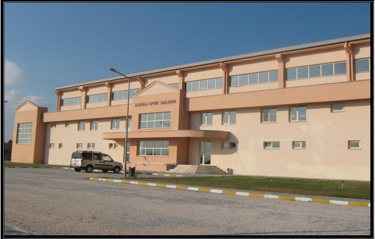
Resim 14 : Spor Salonu