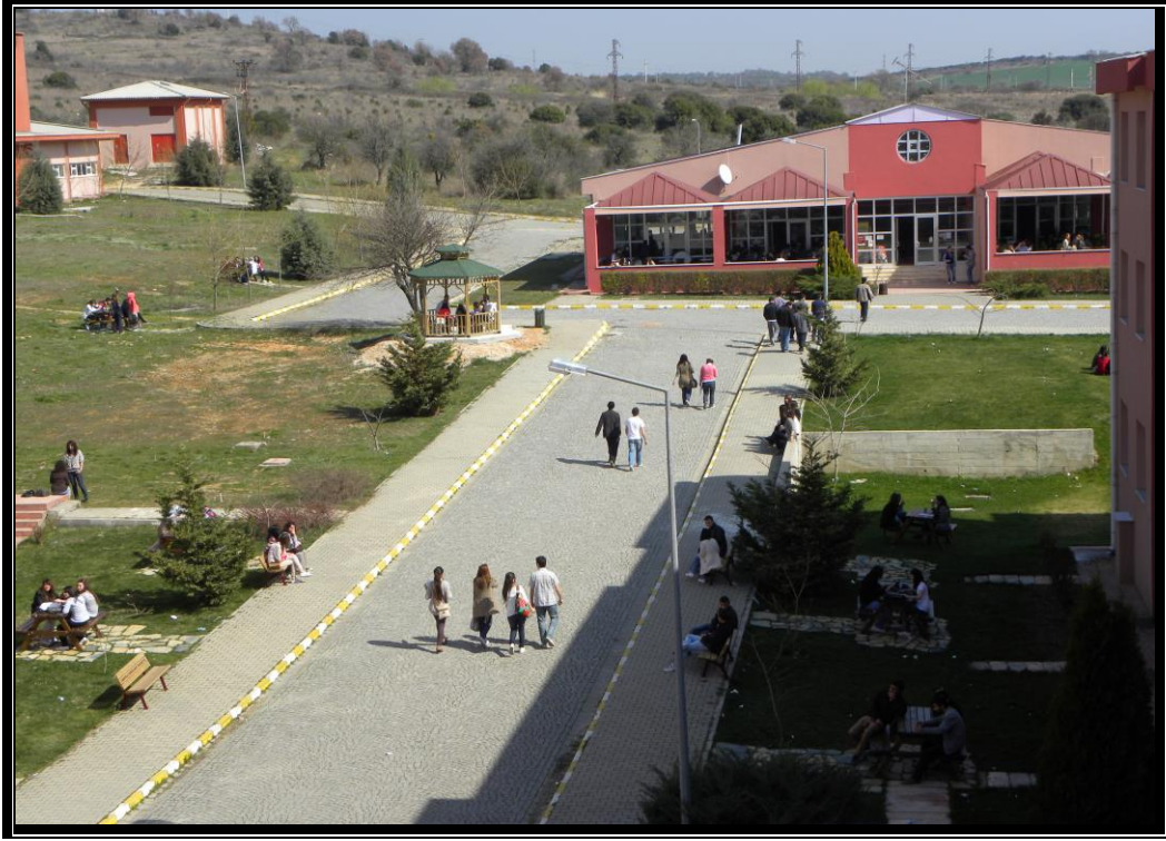
Resim 2 : Manzara Kafe