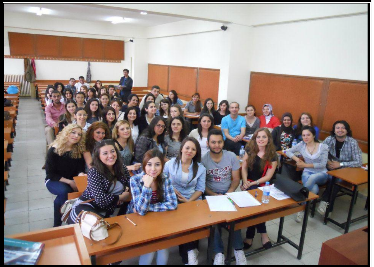
Resim 1 : Derslik