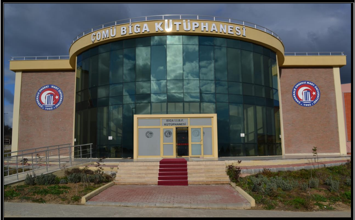
Resim 15 : Kütüphane