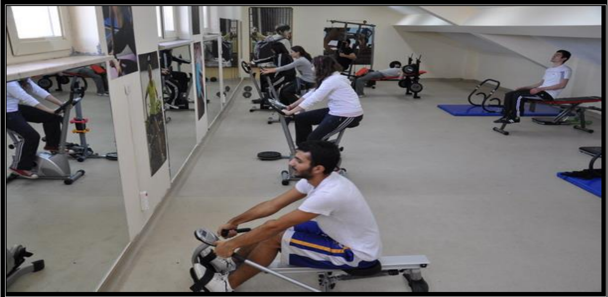
Resim 5 : Fitness Alanı

Kapalı Spor salonu Tesis Alanı: 3600 m 2