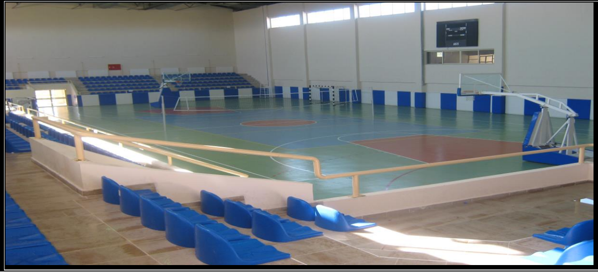
1000 seyirci kapasiteli Spor Salonu