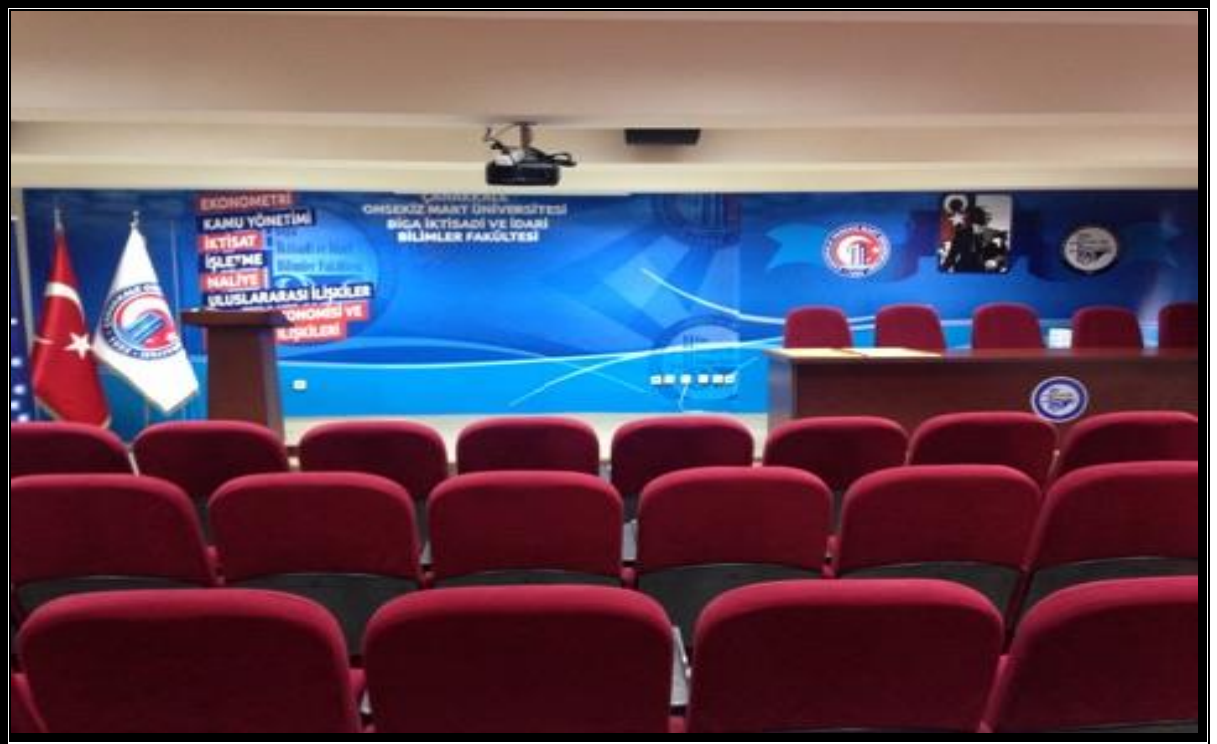
Dekanlık Konferans Salonu