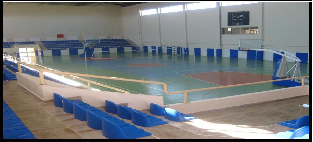
1000 seyirci kapasiteli Spor Salonu