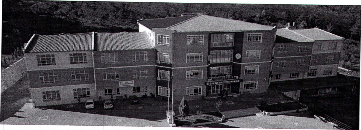
Resim 1. Çan Meslek Yüksekokulu

Çan Meslek Yüksekokulu 3 adet derslik bloğu, 1 idari blok ve bir sosyal hizmetler (kantin, yemek salonu) bloğundan oluşmaktadır ve 40000 m 2 kampüs alanı içerisinde 2700 m 2 temelde, yaklaşık 10000 m 2 kapalı alana sahiptir.