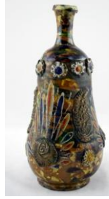
Fotoğraf No:25 Şiše, 19. Yüzyıl sonu-20. Yüzyıl başı, Boy: 31,3 cm (Öney, 1991: 129).