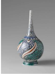
Fotoğraf No: 10 Şişe, 16. Yüzyıl sonu, Ruks Museum, Boy: 19,1 cm (Anonim, Şişe, 2015).