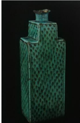
Fotoğraf No:20 Şişe, 18. Yüzyıl, Boy: 22,5 cm, en: 7,7 cm (Kürkman, 2005: 151).

Kütahya döneminde üretilmiş bir başka grup, dışa dönük ağızlı, uzun ince boyunlu, keskin konik gövdeli ve düz tabanlı olarak yapılan şişelerdir (Fotoğraf 17-18-19). Bu tip şişelerin boyunlarında bilezik bulunmaktadır. Bilezik boğazın üçte birlik bölümündedir. Ağız bileziğinin başlama noktasına kadar genişren dara doğru bir görünüm ile yapılmıştır. Bileziğin bitiminde boğaz aşağıya doğru genişleyerek gövdenin en geniş kısmı ile birleşmektedir. Taban gövde ile bir bütün olarak yapılmıştır. Bu tip seramiklerin bazılarında kapak bulunmaktadır (Fotoğraf 19).