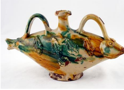
Fotoğraf No:31 Şişe, 20.yüzyıl başı, Çanakkale, Suna-İnan Kıraç Koleksiyonu (Anonim, Şişe, 2013).