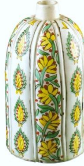
Fotoğraf No:23 Şişe, 18. Yüzyıl ilk yarısı, Boy: 15,6 cm, En: 8,5 cm (Bilge, 2005: 35).

Kütahya'da üretilen başka bir grup, düz ağızlı, kısa boyunlu, yuvarlak omuzlu, uzun silindirik gövdeli ve düz tabanlıdır (Fotoğraf 22-23). Bu tip formlarda silindirik bir gövde kademeli ya da yumuşak hatlarla boyuna doğru daralmaktadır. Boyun kısa ve düzdür.