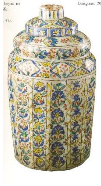
Fotoğraf No:22 Şişe, 18. Yüzyıl ilk yarısı, Boy: 19,3 cm, En: 10 cm (Bilge, 2005: 35).

Kütahya şişelerinde diğer bir grup ,düz ağızlı, kısa boyunlu, uzun dikdörtgen gövdeli ve düz tabanlı olarak yapılmıştır. Bu grup şişeler farklı şekillerde günümüze gelmişlerdir (Fotoğraf 20-21). Bu grup şişelerin boğazları oldukça kısa ve düzdür. Boğaz gövdenin tam ortasına yerleştirilmiştir. Gövde dikdörtgenler prizması şeklindedir. Bazı şişelerde boğaz, formun şekili bozulmada geometrik olarak kademeli şekilde gövde ile birleşmektedir (Fotoğraf 20). Şişelerin bazılarında kapak bulunurken bazı şişelerde kapak görülmez.