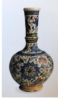
Fotoğraf No:13 Şişe, 19. Yüzyıl sonu- 20. Yüzyıl başı, Boy:28,2cm, En:17,1 cm (Soustiel, 2000: 164).