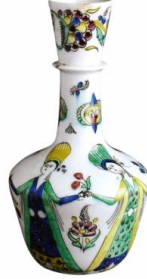
Fotoğraf No:18 Şişe, 18. Yüzyıl ortası, Boy: 26,9 cm (Bilge, 2005: 86)