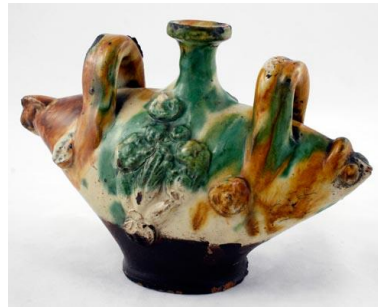
Fotoğraf No:30 Şiše, 20. Yüzyıl başı, Suna-İnan Kıraç Koleksiyonu (Anonim, Şiše, 2013)