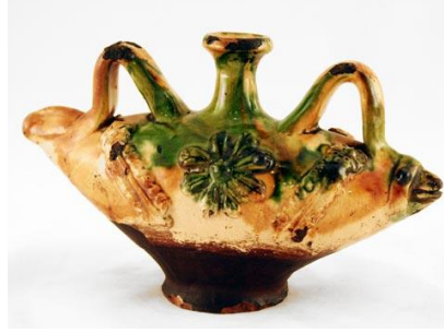
Fotoğraf No:32 Şişe, 20. Yüzyıl başı, Suna-İnan Kıraç Koleksiyonu (Anonim, Şişe, 2013)

Çanakkale 'de üretilen seramik şişe biçimlerinin diğeri balık biçiminde yapılmış eserlerdir (Fotoğraf 29-30-31-32). Bu tip seramiklerde gövde balık formundan oluşmaktadır ve gövdede simetrik bir görünüm oluşturur. Gövdenin ortasında yer alan boyun kısadır. Ağızda profilli bir kabartma bulunmaktadır. Gövdenin üst kısmında iki adet kulp bulunmaktadır. Kulplar genellikle gövde ile paralel yerleştirilmiştir (Fotoğraf 29-31-32). Ancak kimi şişelerde kulp, gövdeye dik yerleştirilmiştir (Fotoğraf 30) ve kulpların boğaza olan uzaklıkları eşittir. Taban gövdeden aşağıda yumuşa bir geçişle belirginleştirilmiştir. Bu tip formların enlemesine uzun bir görünüm ile yapıldığı anlaşılmaktadır.