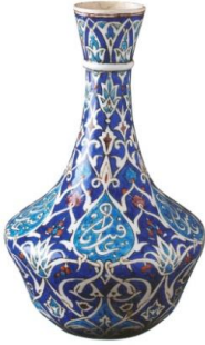
Fotoğraf No:17 Şişe, 19. Yüzyıl sonu, Boy: 28,7, En: 18,4 (Kürkman, 2005: 149)