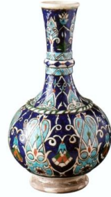
Fotoğraf No:14 Şişe, 19. Yüzyıl sonu- 20. Yüzyıl başı, Boy:30 cm, En: 17,2 cm (Bilge, 2005: 178)

Kütahya şişelerinin bir diğer grubunu ender olarak rastlanan dışa dönük ağızlı, ince boyunlu, küresel gövdeli ve gövdeden dışarıya doğru genişleyen tabanlı eser oluşturmaktadır (Fotoğraf 16). Bu şişede boğazın ağıza yakın olan kısmında bir bilezik bulunmaktadır. Ağız bileziğinin başlangıç kısmına kadar genişten dara doğru küçülmektedir. Bileziğin bitiminde boğaz düz bir şekilde gövde ile birleşmektedir.