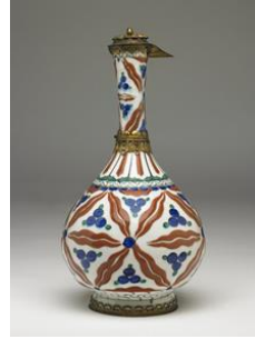
Fotoğraf No:11 Şişe, 16. Yüzyıl ikinci yarısı, British Museum, Boy: 29 cm (Anonim, Şişe, 2015).

Altıncı grup şişe biçimlerinin 16. yüzyılın ikinci yarısında görülmeye başlamıştır. Bu grup şişe biçimlerinin genel görünümüne bakıldığında genişten dara doğru inen boğazı, geniş ağızlı, oval gövdeli ve normal ölçülerde yapılmış tabanlıdır. Bazı örneklerde görülen ve boğazın ortasında bulunan oval bilezik bu tiplerde görülmez (Fotoğraf 11).