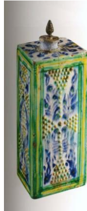
Fotoğraf No:21 Şişe, 18. Yüzyılın ikinci yarısı, Boy: 15,2 cm, En: 7,2x6,8 cm (Bilge, 2005: 57).