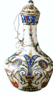
Fotoğraf No:19 Şişe, 19. Yüzyıl sonu, Boy: 28,7, En: 18,4 (Kürkman, 2005: 149)

Kütahya döneminde üretilmiş bir başka grup, dışa dönük ağızlı, uzun ince boyunlu, keskin konik gövdeli ve düz tabanlı olarak yapılan şişelerdir (Fotoğraf 17-18-19). Bu tip şişelerin boyunlarında bilezik bulunmaktadır. Bilezik boğazın üçte birlik bölümündedir. Ağız bileziğinin başlama noktasına kadar genişren dara doğru bir görünüm ile yapılmıştır. Bileziğin bitiminde boğaz aşağıya doğru genişleyerek gövdenin en geniş kısmı ile birleşmektedir. Taban gövde ile bir bütün olarak yapılmıştır. Bu tip seramiklerin bazılarında kapak bulunmaktadır (Fotoğraf 19).