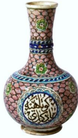
Fotoğraf No:15 Şişe, 19. Yüzyıl sonu- 20. Yüzyıl başı, Boy:28,1 cm, En: 16,8 cm (Bilge, 2005: 188).

Kütahya şişelerinin bir diğer grubunu ender olarak rastlanan dışa dönük ağızlı, ince boyunlu, küresel gövdeli ve gövdeden dışarıya doğru genişleyen tabanlı eser oluşturmaktadır (Fotoğraf 16). Bu şişede boğazın ağıza yakın olan kısmında bir bilezik bulunmaktadır. Ağız bileziğinin başlangıç kısmına kadar genişten dara doğru küçülmektedir. Bileziğin bitiminde boğaz düz bir şekilde gövde ile birleşmektedir.