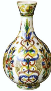
Fotoğraf No:16 Şişe, 19. Yüzyıl sonu, Boy: 27,5 cm, En: 16 cm (Bilge, 2005: 168).