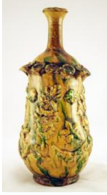
Fotoğraf No:24 Şiše, 19. Yüzyıl sonu, Boy: 31,8 cm (Öney, 1991: 130).