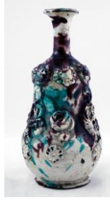
Fotoğraf No:26 Şiše, 19. Yüzyıl sonu-20. Yüzyılın başı (Anonim, Şiše, 2013).