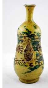
Fotoğraf No:27 Şiše, 19. Yüzyıl sonu-20. Yüzyılın başı, (Anonim, Şiše, 2013).