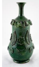
Fotoğraf No:28 Şiše, 19. Yüzyıl sonu-20. Yüzyıl başı, Boy: 31,3 cm (Öney, 1991: 129).

Çanakkale’de seramik imalatı hangi tarihlerde başladığı kesin olarak bilinmemekle beraber, ilk olarak 18. yüzyılın ortalarında Çanakkale’yi gören seyyahların eserlerinde seramik imalatından söz edildiği bilinmektedir. Çanakkale adının burada yapılan çanak-çömlekten esinlenildiği düşünülmektedir (Öney, 1976; 129). Bu dönemde üretilen birçok farklı seramik form bulunmaktadır.