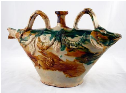
Fotoğraf No:29 Şiše, 20.yüzyıl başı, Çanakkale, Suna-İnan Kıraç Koleksiyonu (Anonim, Şiše, 2013).

Çanakkale’de yapılmış şişe biçimlerinden ilki kırmızı hamurdan yapılmış, dış dönük ağızlı, kısa boyunlu, uzunlamasına armudi gövdeli ve kısa tabanlıdır (Fotoğraf 24-25-26-27-28). Bu formların gövdesi sündürülmüş armudi bir görünümde ve gövdenin ortası içeriye doğru çukurlaştırılmıştır. Bu tip formların oldukça fazla üretilmiş oldukları görülmektedir.