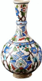
Fotoğraf No:12 Şişe, 19. Yüzyıl sonu- 20. Yüzyıl başı, Boy: 29 cm, En: 15,9 cm, (Bilge, 2005: 185).

olarak yapılmış olup ortadaki kısım daha belirgindir (Fotoğraf 15). Ağızda “profilli” olarak tabir edilen ve dışarıya doğru çıkıntılı bir kabartma bulunmaktadır. Bu şişeleri gövdesi basık oval bir görünüm şeklinde yapılmıştır.