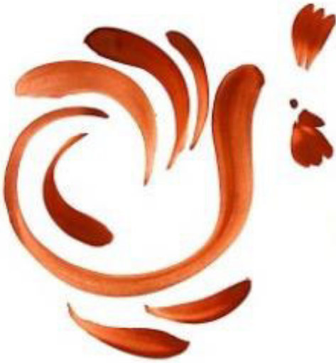
Resim 3.13. Çarkıfelek motifinden çıkışlı tavuk motifi. Teknik: Guaj boya, 2019.

y: 5. 8cm, Ağız ç.: 19,1 cm, dip ç.: 6,5 cm