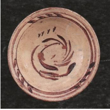
Resim 3.9. Çukur Tabak 19. yy. ilk yarısı y: 9 cm, ağız ç.: 24,3 cm, dip ç.: 6,8 cm