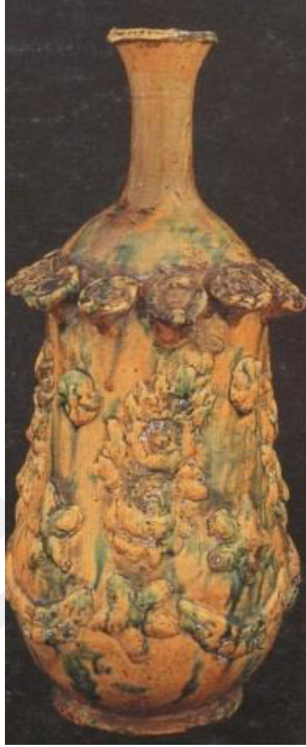
Resim 2.6. Şişe 19 yy.sonu 20.yy.başı

Yükseklik 31,3 cm, ağız ç. 4,8 cm. dip ç. 8,8cm. gövde ç.13.5cm