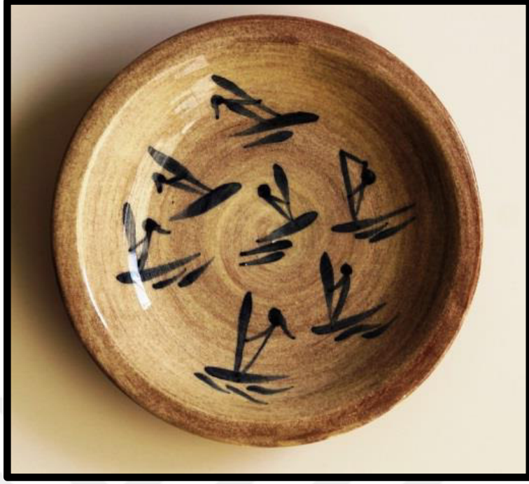
Resim 3.34. ukur Tabak 2019 y: 6 cm., Ađız .: 18,5cm, dip .:4,5 cm.