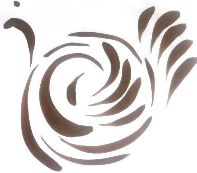
Resim 3.16. Çarkifelek motifinden çıkışlı horoz motifi.