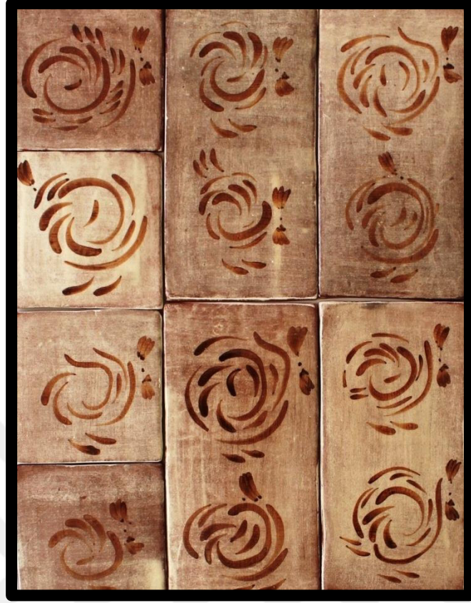
Resim 3.19. Pano çalışması, 2019.