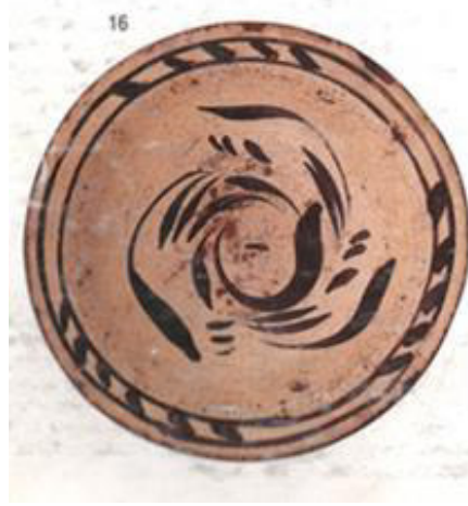
Resim 3. 4. Çukur Tabak 19. yy. ilk yarısı