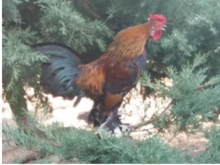
Resim 3.1. Horoz.

hayvanlarının yapısal özellikleri ve hareketleri çarkıfelek motifinde yer alan kıvrımların yönelimleriyle sağlanmaya çalışılmıştır. Horoz, tavuk motifleri geliştirildikten sonra, madalyon motiflerinin içerisine yerleştirilerek, Geleneksel Çanakkale Seramiklerinde madalyon motiflerinde çeşitlenme sağlanmaya çalışılmıştır.