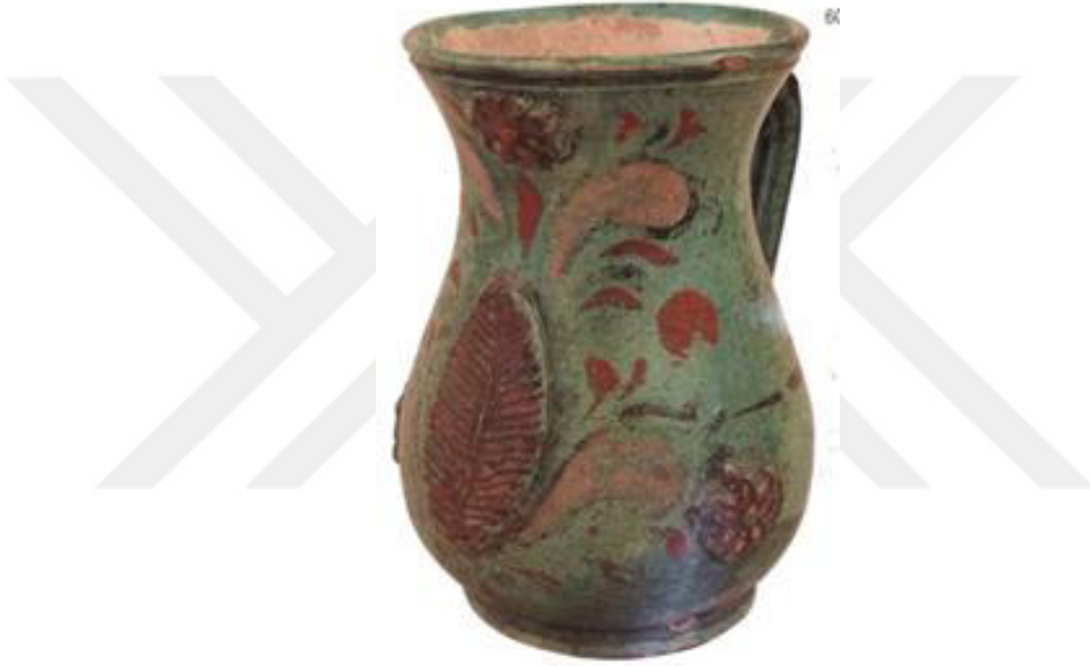
Resim 2.7. Maşrapa 19 yy.sonu

Geleneksel Çanakkale seramik formlarına bakıldığında iki üç çeşit yaprak çeşidi görülmektedir. Yaprak motifi yanında serbest fırça darbeleriyle yapılmış bitkisel bezemelerle birlikte kullanılmıştır. Bazen de rozet çiçek, hilal, gül, lale, sümbül gibi bitki motiflerine eşlik etmektedir. Yaprak motifi, diğer motiflerle beraber kullanıldığında formlarda farklı üsluplar ortaya çıkmaktadır. Her ustanın kendine göre yorumlamaları da dikkat çekmektedir. Yaprak motiflerin formlardaki bütünlüğünü incelersek gövdenin ön kısmında tek bir yaprak kabartması yer alırken, yaprağın sade olması ve tek çizgilerle damarlarının çizilerek forma monte edilmiştir.