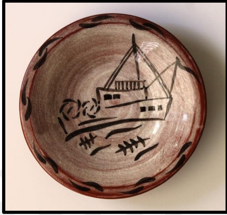
Resim 3.54. Çukur Tabak, 2019. y: 6 cm., ağız ç.: 16,5cm, dip ç.:4,5 cm.