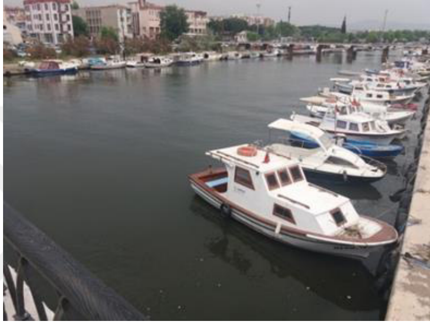
Resim 3.40. Çanakkale Kordon, 2018.

Çanakkale'ye özgü geleneksel fırça vuruşuyla güncel deniz taşıtları yorumlanmıştır. Yorumlama öncesi, gözlem ve fotoğraf çekimleri yapılmıştır. Güncel taşıtların formlarındaki karakteristiklerini belirleyerek sadeleştirme ve geleneksel fırça vuruşunun yanı sıra geleneksel motiflerle birlikte ifade etme araştırmaları yapılmıştır.