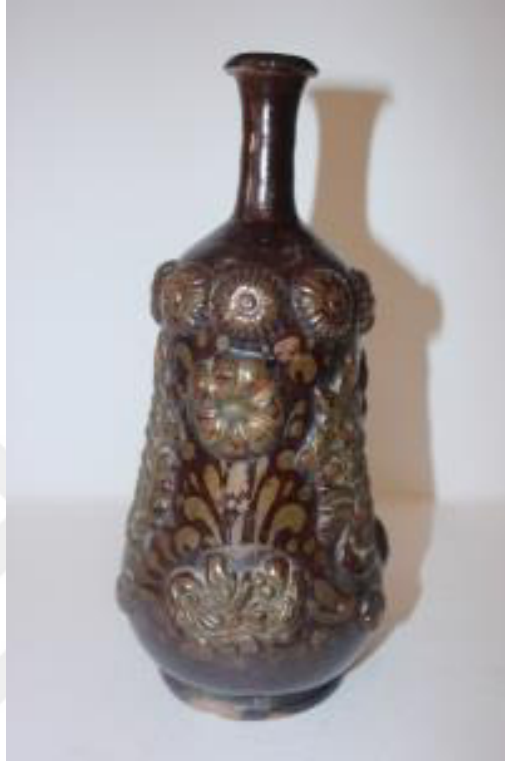
Resim 2.5. Şişe, 19. yüzyıl sonu

Armudi gövdeli şişelerde, rozet çiçeğin diğer motiflerle birlikteliği görülür. İbriklerde, genellikle forma üç adet çiçek rozeti eklenmiştir. Halka gövdeli testiler de, gövdenin iç ve yan kısımlarında rozet çiçekler yaprakların birlikteliğiyle görülür (Kıraç:1996,110).