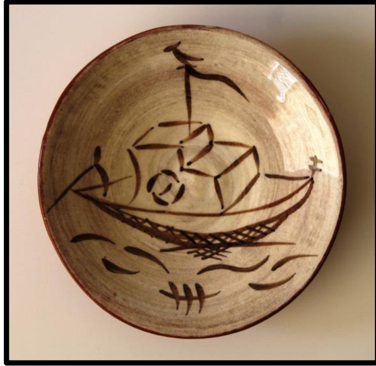
Resim 3.55. Çukur Tabak, 2019. y: 6 cm., ağız ç.: 16,5cm., dip ç.:4,5 cm.