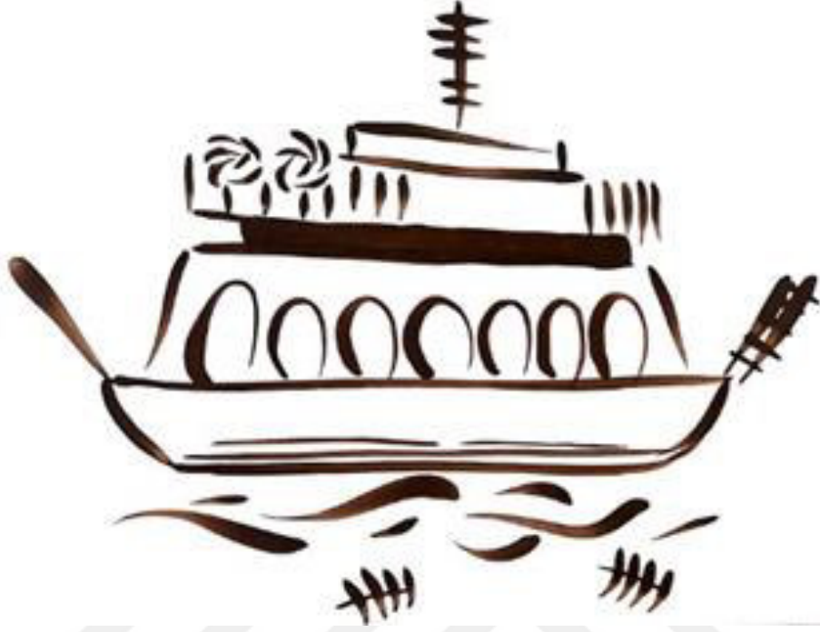
Resim 3.42. Gestaş yorumu Teknik: Guaj boya, 2019.