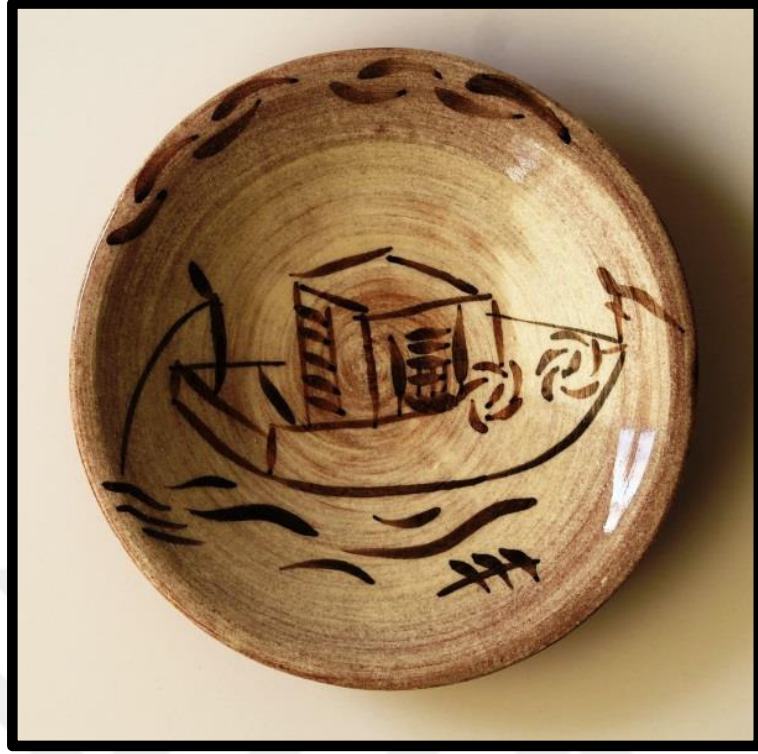
Resim 3.50. ukur Tabak, 2019. y: 5,5 cm. ađız .: 18,5cm, dip .:4,5 cm.