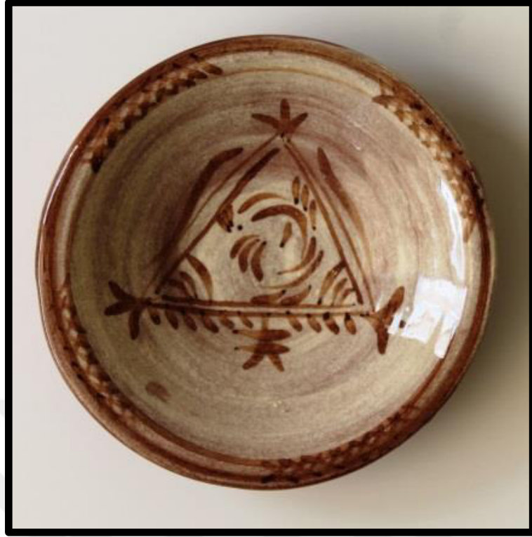
Resim 3.25. Çukur Tabak 2019

y: 6 cm., ağız ç.: 18,5cm, dip ç.:4,5 cm.