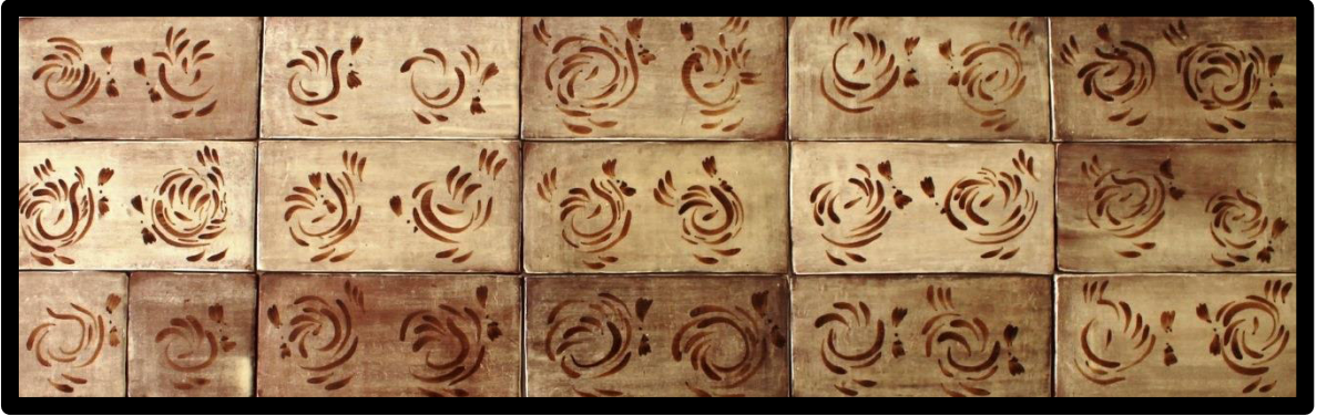
Resim 3.18. Pano çalışması, 2019.