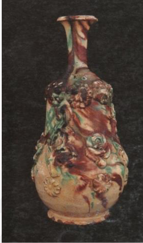
Resim 1.5. Şiše 19.yy. sonu 20.yy başı Yükseklik: 23,6 cm , dip ç. 8.2 cm. Kaynak:Öney, 1996: s.103