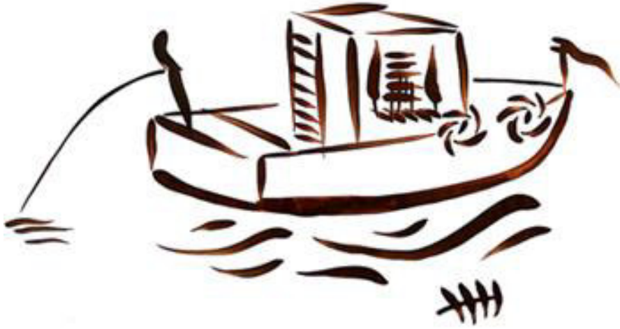
Resim 3.46. Teknesiyle açılmış balıkçı yorumu.