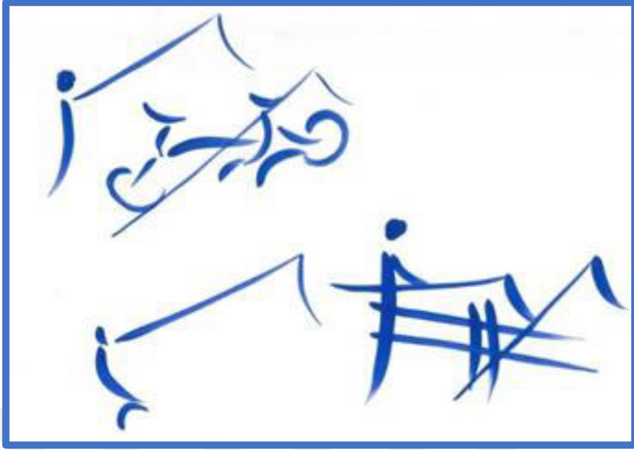
Resim 3.36. Deniz kenarında olta balıkçılığı.