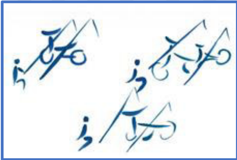
Resim 3.37. Deniz kenarında olta balıkçılığı