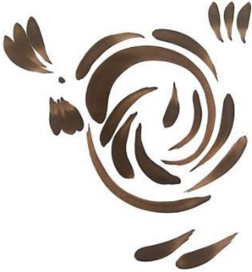
Resim 3.10. Çarkıfelek motifinden yola çıkışlı horoz motifi. Teknik: Guaj boya, 2019.