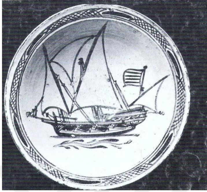
Resim 2.10. Çukur Tabak 1750-1850