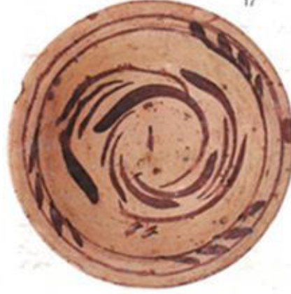
Resim 3.6. Çukur Tabak 19. yy. ilk yarısı y.: 7,1 cm,Ağız ç.: 24,9 cm,Dip ç.: 6,3 cm.

Kaynak: Çanakkale Seramikleri Suna İnan Kıraç Akdeniz Medeniyetleri Araştırma Enstitüsü Yayınları, s. 30