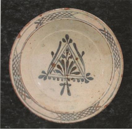
Resim 3.22. Çukur Tabak 18 .yy. sonu y: 6 cm. ağız ç.: 23,6 cm, dip ç.: 6,8 cm.