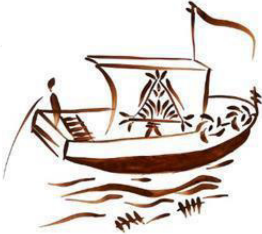
Resim 3.47. Teknesiyle açılmış balıkçı yorumu.