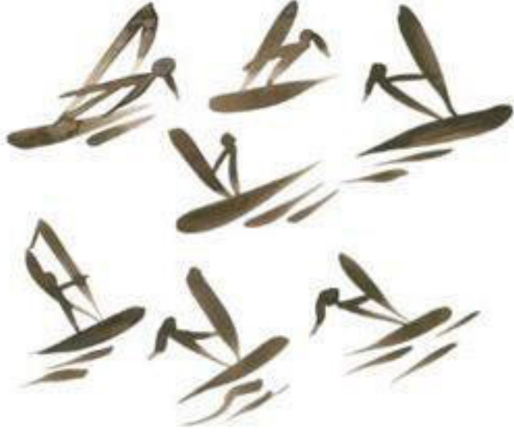
Resim 3.28. Bayan sörfçü etütleri. Teknik: Guaj boya, 2019.