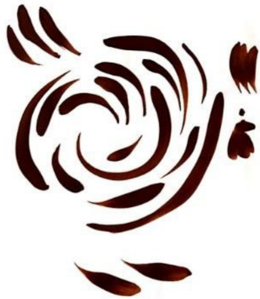
Resim 3.11. Çarkıfelek motifinden yola çıkışlı horoz motifi. Teknik: Guaj boya, 2019.