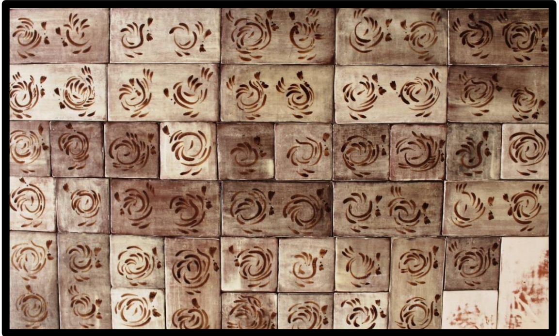
Resim 3.20. Pano çalışması, 2019.