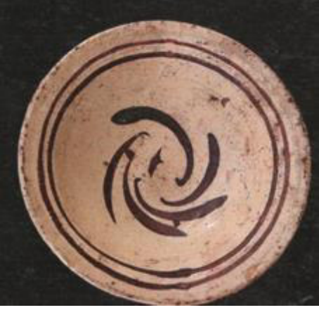
Resim 3.12. Çukur Tabak 19. yy. ilk yarısı

y: 5. 8cm, Ağız ç.: 19,1 cm, dip ç.: 6,5 cm