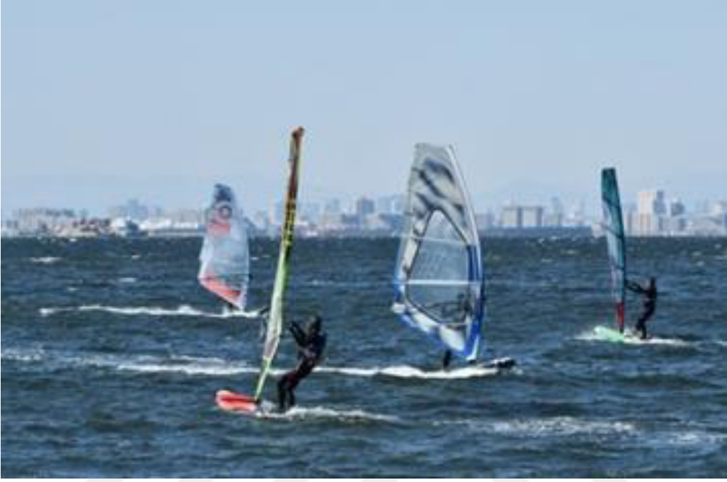
Resim 3.27.

Balıkçıları deniz kenarında oltasını atmış beklerken betimlenmiş, yine Geleneksel Çanakkale Seramiklerinde görülen fırça dekorlarından yola çıkarak, en yalın halde tek bir fırça vuruşuyla anlatılmaya çalışılmıştır.