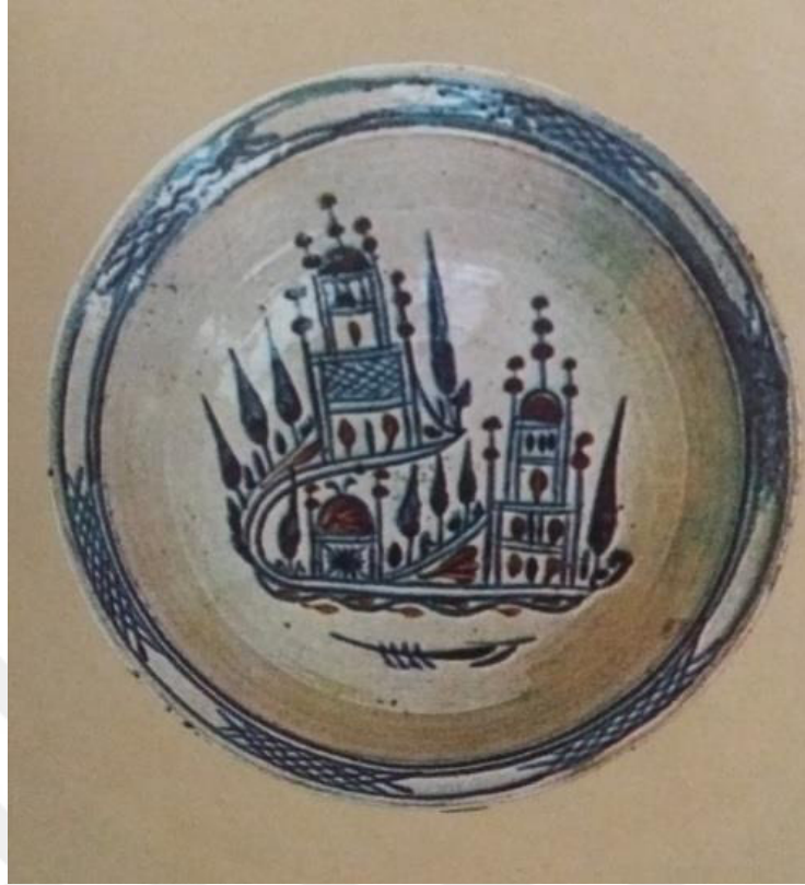
Resim 2.11. Çukur Tabak 1750-1850