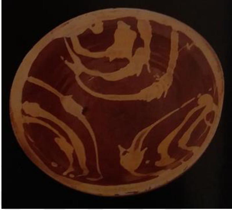
Resim 1.2. Çukur Tabak 20.yy. başı y.8,3 cm. ağız ç.27.2cm. Kaynak: Öney, 1996: s.42