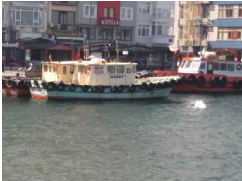
Resim 3.41. Çanakkale Kordon, 2018.