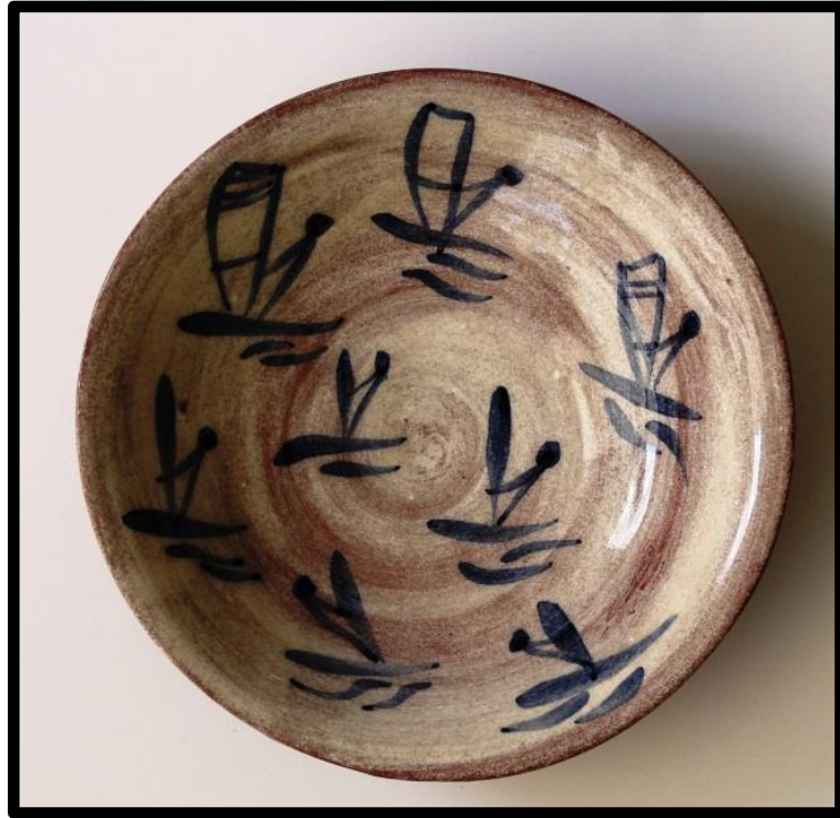
Resim 3.33. Çukur Tabak, 2019. y: 6 cm. ağız ç.: 18,5cm, dip ç.:4,5 cm.