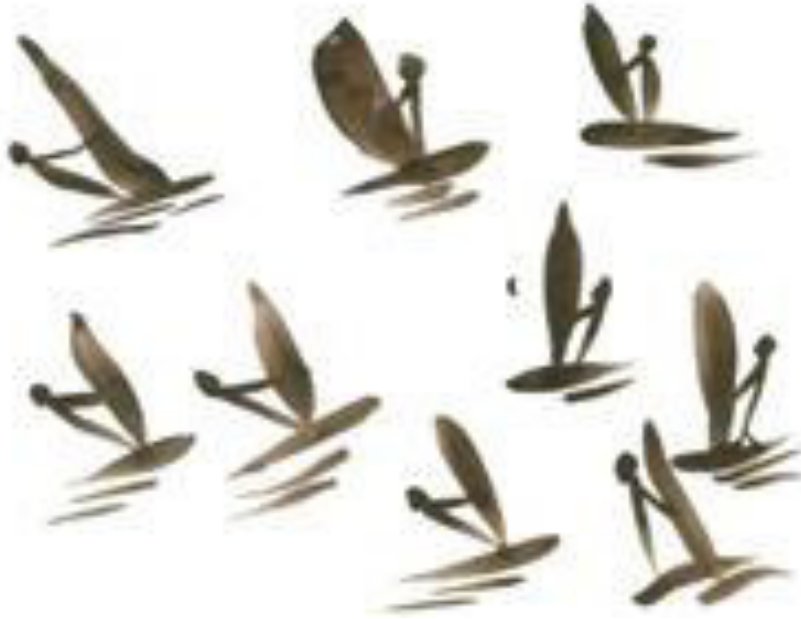
Resim 3.29. Sörfçü etütleri. Teknik: Guaj boya, 2019.