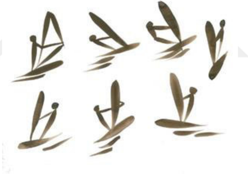
Resim 3.31. Sörfçü etütleri. Teknik: Guaj boya, 2019