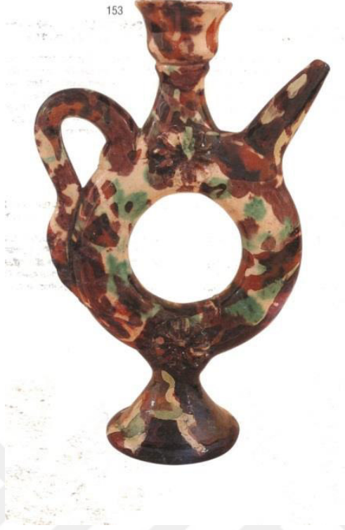
Resim 1.6. Halka Gövdeli Testi 19.yy. sonu 20.yy başı Yükseklik: 25,3 cm, dip ç. 8 cm.gövde ç.14,5cm. ağız ç.5,2cm. Kaynak: Öney, 1996: s.108