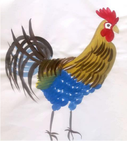
Resim 3. 2. Horoz eskiz çalışmaları