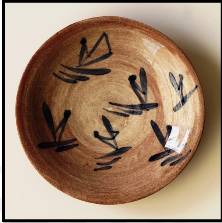
Resim 3.32. Çukur Tabak, 2019. y: 6 cm., Ağız ç.: 18,5cm, dip ç.:4,5 cm.