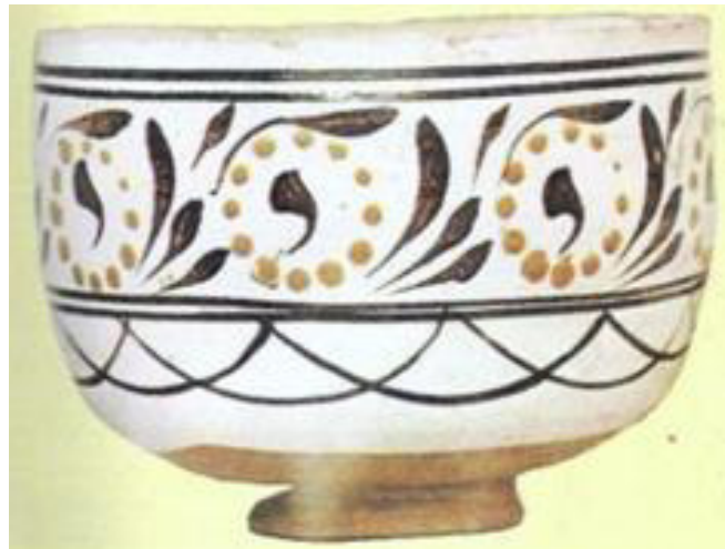
Resim 2.2: Çukur Kase 1750-1850