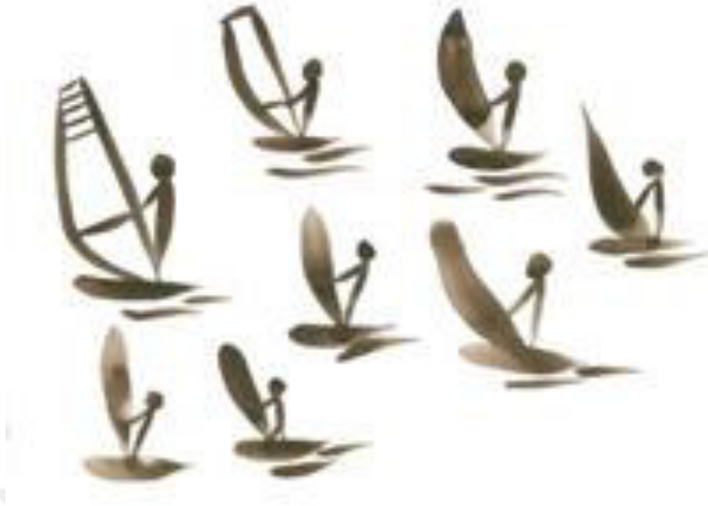
Resim 3.30. Sörfçü etütleri. Teknik: Guaj boya, 2019.