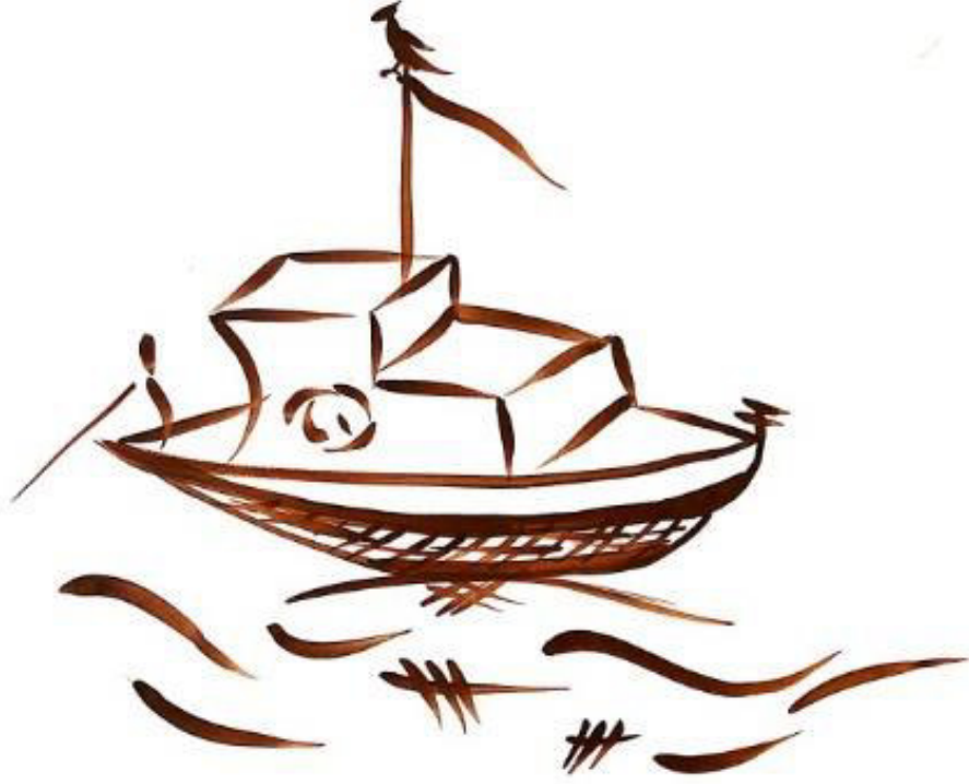
Resim 3.48. Teknesiyle açılmış balıkçı.