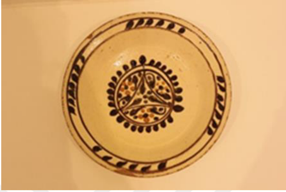
Resim 2.1. Çukur tabak