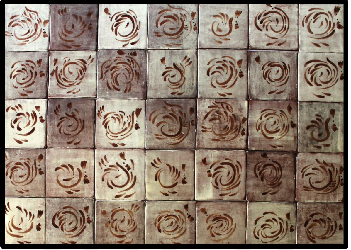
Resim 3.17. Pano çalışması, 2019.