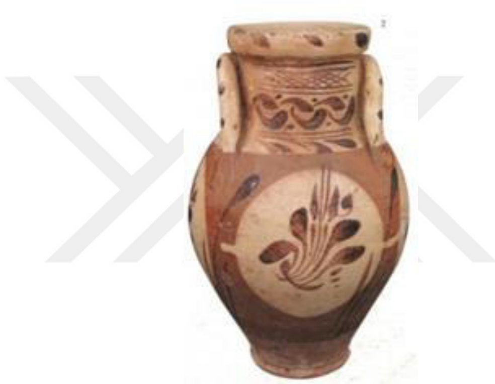
Resim 2.3. Küp 18.yy.

Yükseklikleri 22,9 ve 36 cm arasında çapları 18cm. olan küp formlarında ise boyun kısımlarına kafes deseni ve dalga motifinin eşlik ettiği görülmektedir. Bazı örnekler de desenler mavi lacivert renkle bir sıra çiçek ve yapraklarla tamamlanmış şekilde karşımıza çıkmaktadır. Bazen de gövdelerinde bulunan dört madalyon beyaz astarlanıp, desenler kahverengi boya ile uygulanmış, şeffaf sırla sırlanmıştır. Madalyon oluşturan örneklerin içinde serviler de, serbest fırça darbeleriyle dekorlanmıştır. Stilize edilmiş bitkisel bezeme örnekleri de görülmektedir( Kıracı, 1996: 20-21).