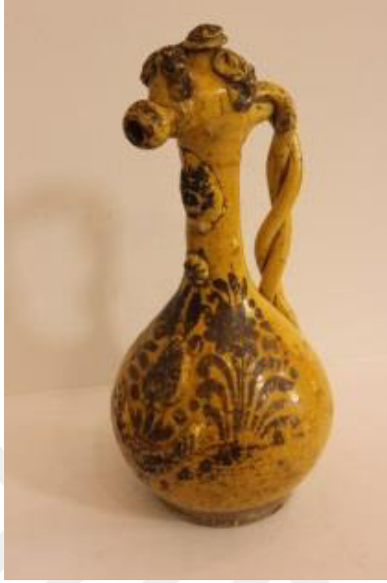
Resim 2.4. Testi 19 yy.sonu

Yükseklik 18cm, ağız ç. 12.5 cm. gövde ç.: 34,5 cm. dip ç. 9.7 cm.