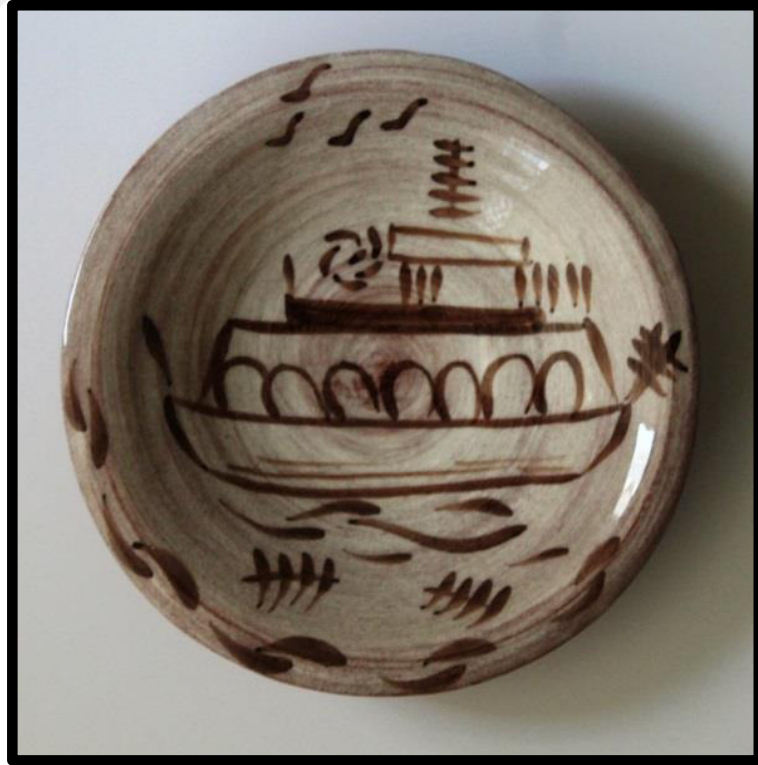
Resim 3.51. ukur Tabak, 2019. y: 5,5cm. ađız .: 18,5cm, dip .:4,5 cm.