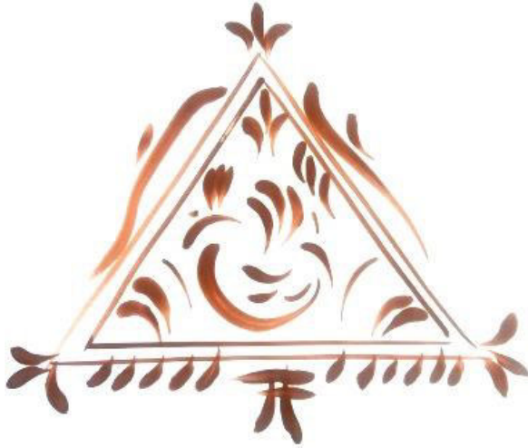
Resim 3.23. Madalyon içerisine yerleştirilen horoz motifi. Teknik: Guaj boya, 2019.