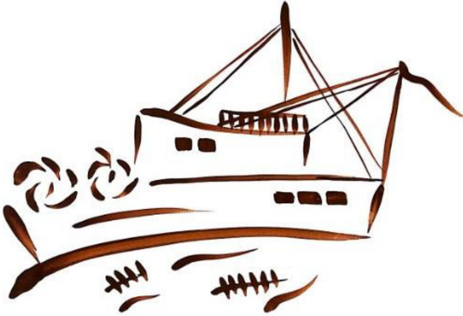
Resim 3.43. Yelken yorumu. Teknik: Guaj boya, 2019.