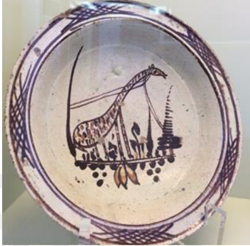
Resim 1.3. Çukur Tabak (1750-1850)