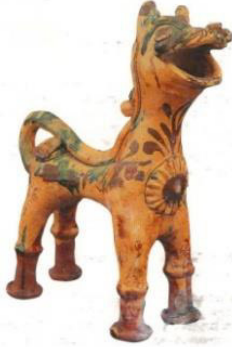
Resim 2.9. Aslan biçiminde kap 19.yy.sonu 20.yy.başı