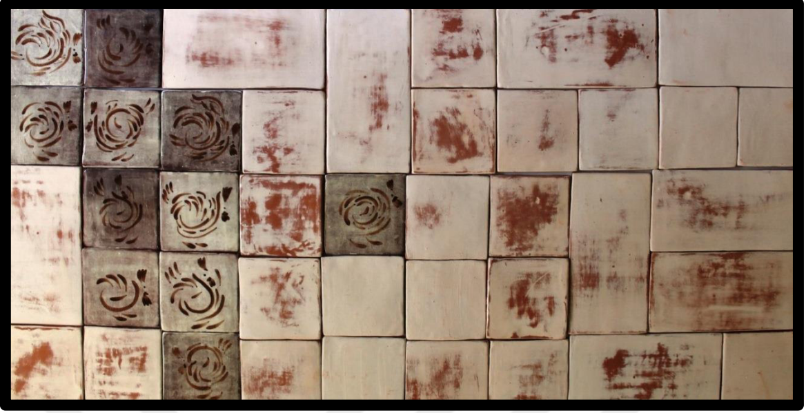
Resim 3.21. Pano çalışması, 2019.

Horoz ve tavuk motifleri için 12x12 ve 12x24 cm. ölçülerinde plakalar şekillendirilmiştir. Deri sertliğinde plakalara astar sürülerek kurutulmaya bırakılmıştır. Kurumuş olan plakalar 980 °C’de pişirilmiştir. Astarlı bisküvi plakalar üzerine sır altı dekor tekniğiyle motifler aktarılmış, şeffaf sır ile sırlanmış, 1040°C’de pişirilmişlerdir.