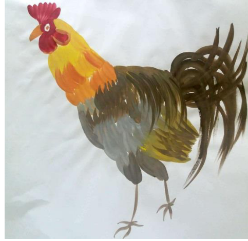
Resim 3. 3. Horoz eskiz çalışmaları