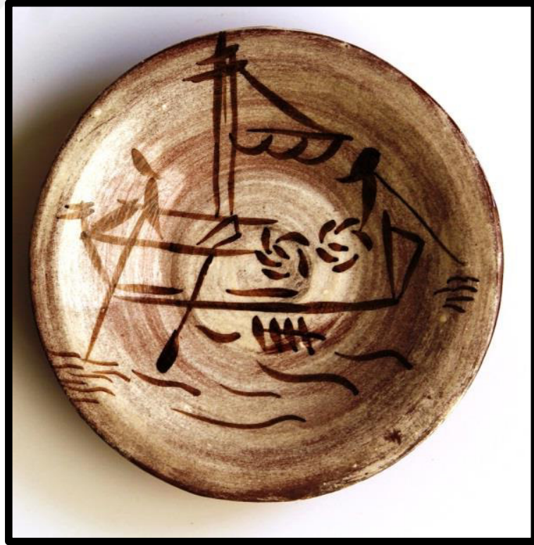
Resim 3.53. Çukur Tabak, 2019. y: 6 cm. ağız ç.: 18,5cm, dip ç.:4,5 cm.