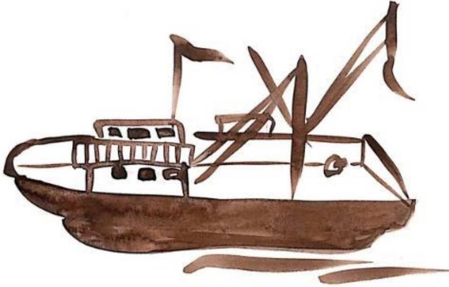
Resim 3.45. Balıkçı teknesi yorumu Teknik: Guaj boya,2019