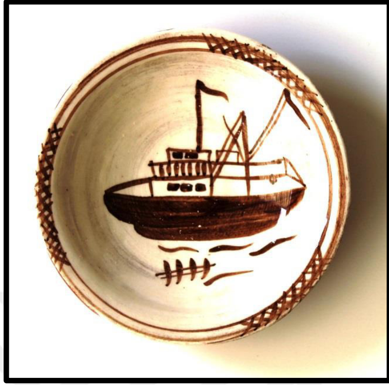
Resim 3.52. Çukur Tabak, 2019. y: 6 cm. ağız ç.: 16,5cm, dip ç.:4,5 cm.