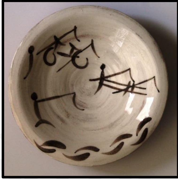
Resim 3.38. ukur Tabak, 2019. y: 6 cm., ađız .: 18,5cm, dip .:4,5 cm.