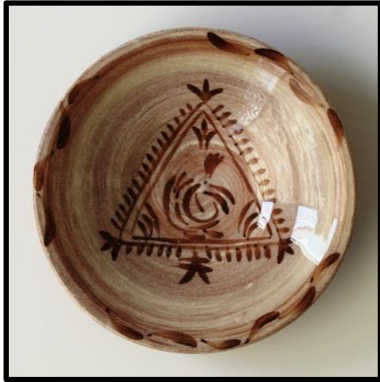
Resim 3.26. Çukur Tabak 2019

y: 6 cm., ağız ç.: 18,5cm, dip ç.:4,5 cm.