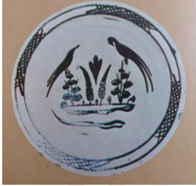
Resim 2.8. Çukur Tabak 1750-1850