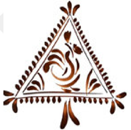
Resim 3.24. Madalyon içerisine yerleştirilen horoz motifi. Teknik: Guaj boya, 2019.