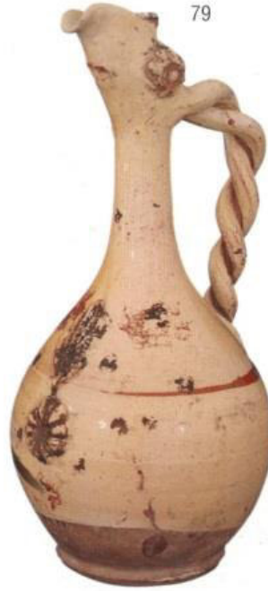
Resim 1.1. Testi 19.yy.sonu