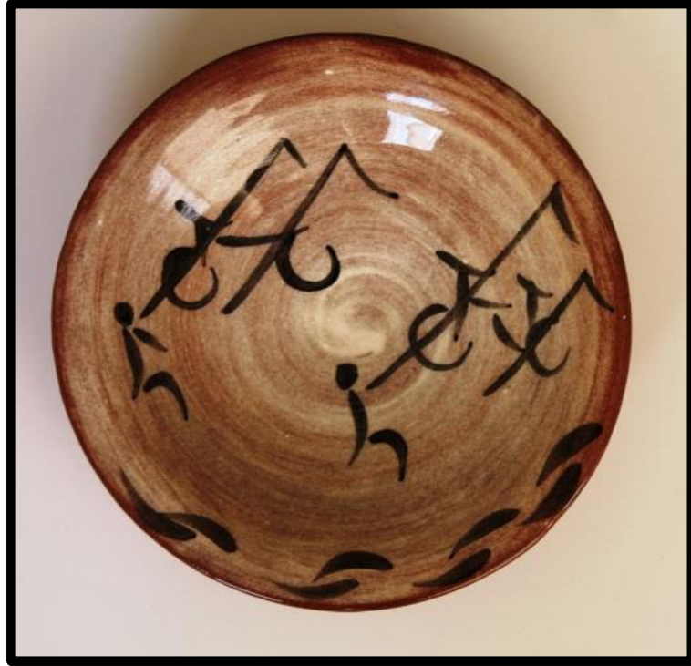
Resim 3.39. ukur Tabak, 2019. y: 6 cm., ađız .: 18,5cm, dip .:4,5 cm.