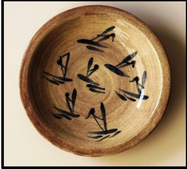
Resim 3.35. ukur Tabak 2019 y: 6 cm., Ađız .: 18,5 cm., dip .:4,5 cm.