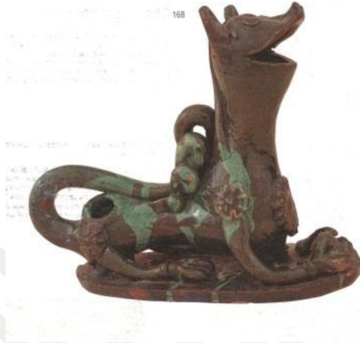
Resim 1.4. Aslan biçiminde kap 19.yy. sonu 20.yy başı