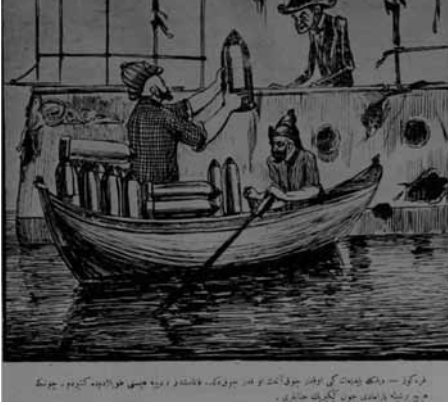
Karikatür 3 (Karagöz, 25 Şubat 1330/10 Mart 1915, nr. 736).

Karagöz –Dilinle yaptığın gibi o kadar çok attın o kadar çok ki... Kalmamıştır, diye hepsini topladım getirdim. Çünkü hiçbir işe yaramadı Con (John) Kikirik cenapları.