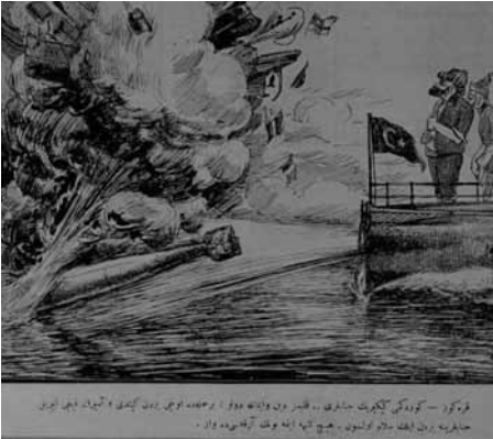
Karikatür 4 (Karagöz, 28 Şubat 1330/13 Mart 1915, nr. 737).

7 Mart'ta, Türk tabyalarından açılan ateş sonucu bir Fransız zırhlısının saf dışı bırakıldığı, bir İngiliz zırhlısının da hasara uğradığı açıklanınca Eceli gelen kелbler (köpekler) cami duvarına siyerler atasözüne gönderme yaparak ilk kayıplarını vermeye başlayan düşman filosunun sonunun yaklaştığı ifade edildi 28 . 11 Mart gecesi bir kruvazörle birkaç torpido himayesinde Boğaz önündeki mayın hatlarına doğru yaklaşan mayın arama gemilerinden ikisinin topçu ateşiyle, bir diğeri de mayına çarparak batması, bu arada kruvazörün de isabet alarak yaralanması bu inancı daha da pekiştirdi. Aşağıdaki karikatürle Amiral Kıçıkırık'a selam yollayan Karagöz, bunun sadece bir başlangıç olduğunu yazıyordu.