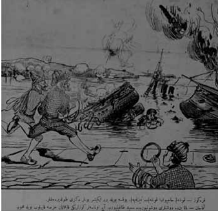
Karikatür 8 (Karagöz, 7 Mart 1331/20 Mart 1915, nr. 740).

Arka kapaktaki karikatür ise Türk askerinin yiğitliğini ve savaşta gösterdiği başarıyı vurguluyordu. Bundan sonra düşman, nargilesini fokurdatarak kazandığı zaferin tadını çıkaran Aydın Efesinin külahından bile korkacak, bir daha Çanakkale'ye yaklaşmaya bile cesaret edemeyecekti.