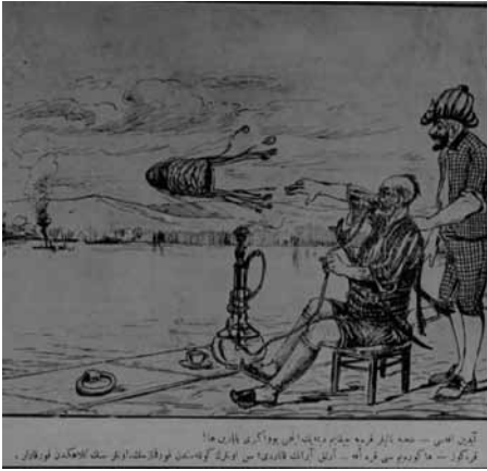
Karikatür 9 (Karagöz, 7 Mart 1331/20 Mart 1915, nr. 740).

Arka kapaktaki karikatür ise Türk askerinin yiğitliğini ve savaşta gösterdiği başarıyı vurguluyordu. Bundan sonra düşman, nargilesini fokurdatarak kazandığı zaferin tadını çıkaran Aydın Efesinin külahından bile korkacak, bir daha Çanakkale'ye yaklaşmaya bile cesaret edemeyecekti.