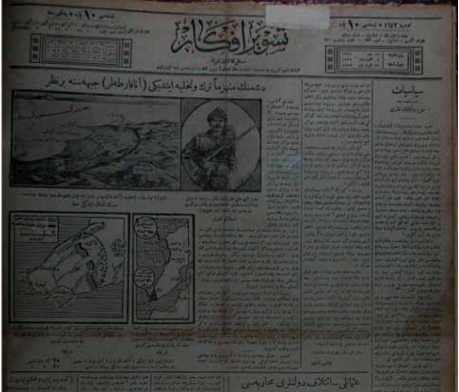
Ek-1: Tasvir-i Efkâr Gazetesi, 22 Aralık 1915