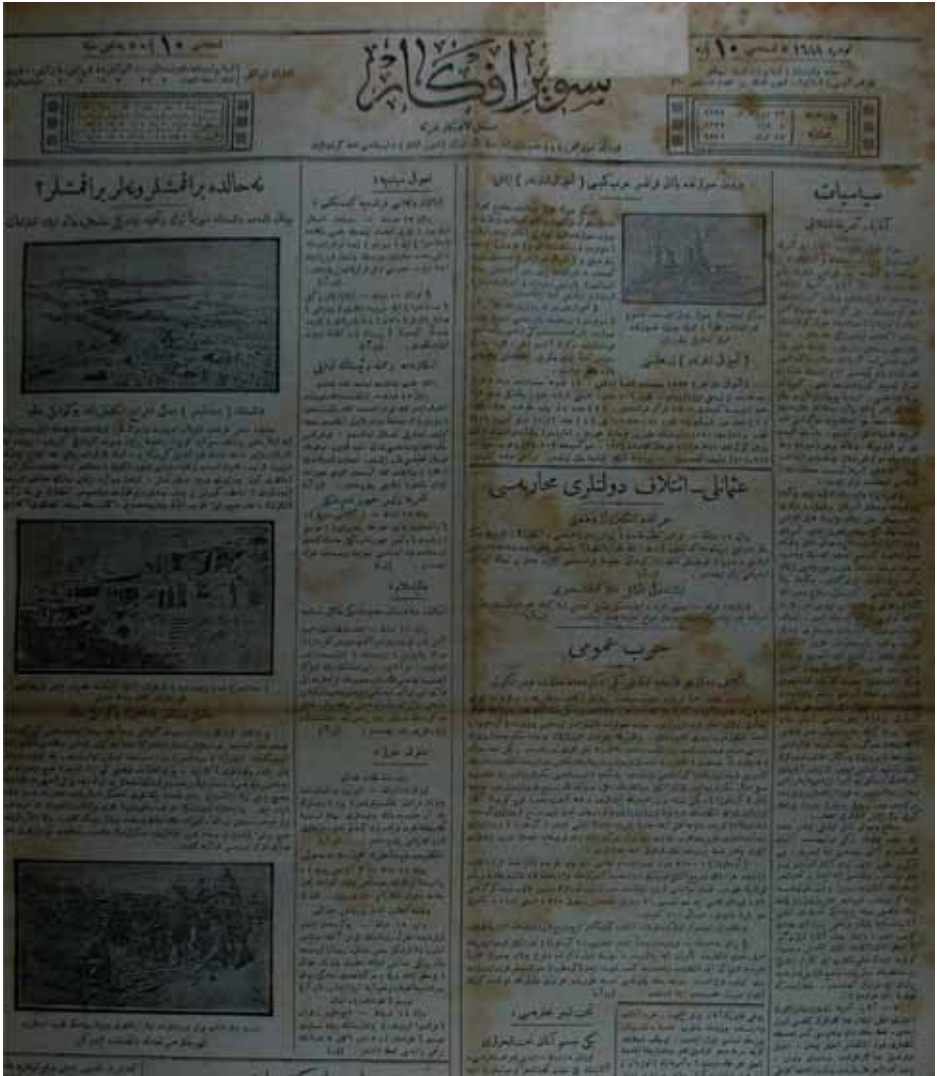
Ek-3: Tasvir-i Efkâr Gazetesi, 17 Şubat 1916