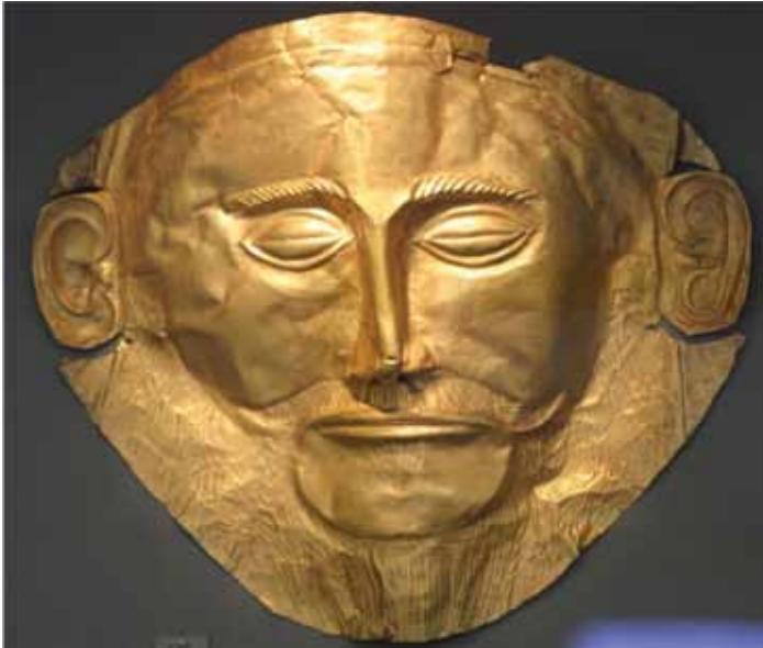
Resim 1 Agamemnon'un altın maski