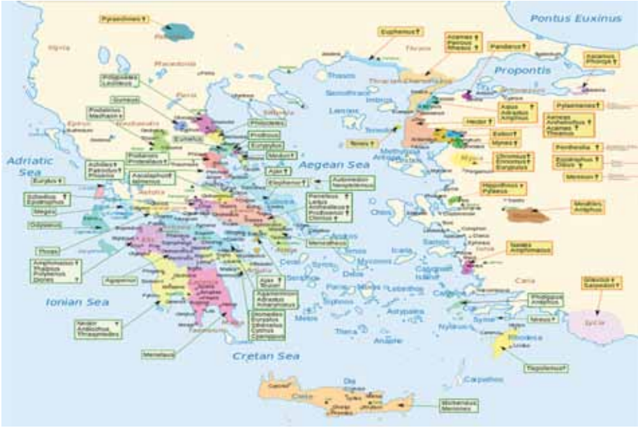
Harita 3 Troia savařına katılan uluslar