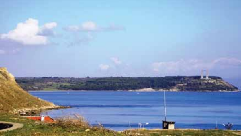
Resim 10 Çanakkale savaşının Aşil Topoğu (Sestos Projesi)