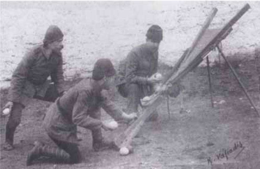
Resim 5 Savaşta Türk ordusunun kullandığı mancınık