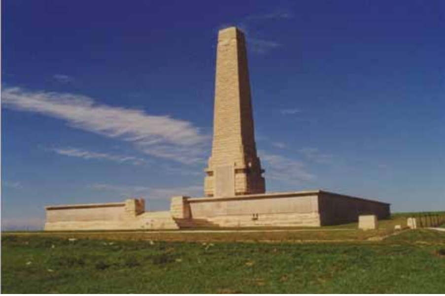
Resim 8 Seddülbahir yakınındaki Helles anıtı (Sestos Projesi)