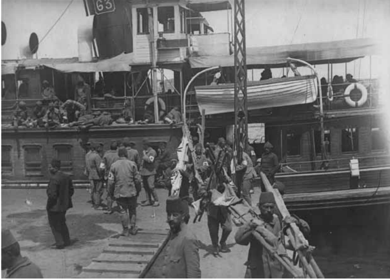
Ek 3: Yaralı Gazilerin Dersaadet'e (İstanbul'a) Muvasalatı (Ulaşması) 59