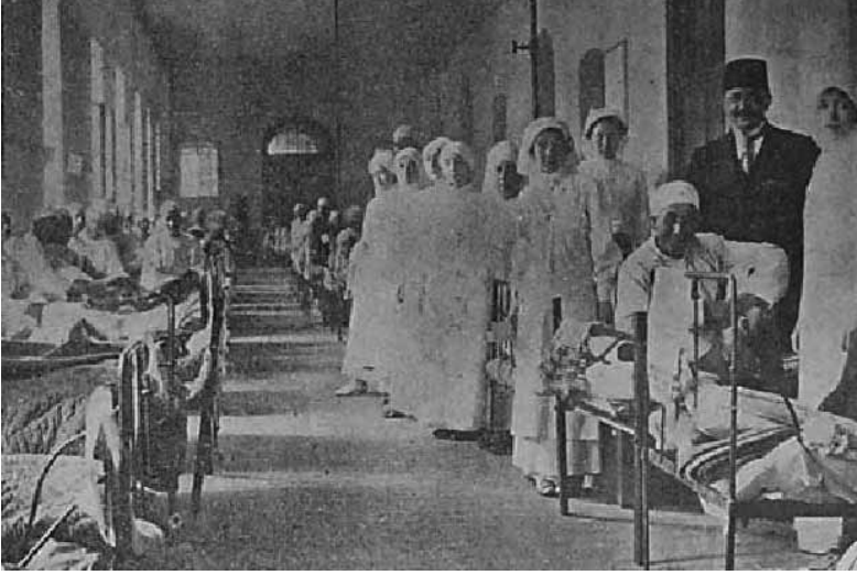
Ek 5: Mecruh (yaralı) Gazilerimiz İstanbul'da Hilal-i Ahmer Hastanelerinde 60