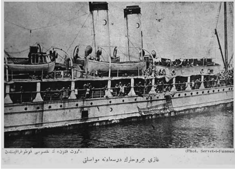
Ek 4: Gazi Mecruhların (yaralıların) Dersaadet'e (İstanbul'a) Muvasalatı (Ulaşması)