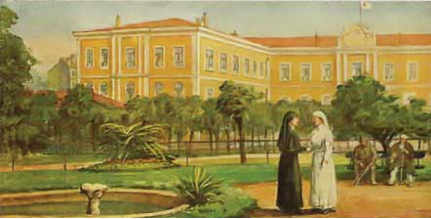
Ek 2: Galatasaray Lisesi'nde Hilal-i Ahmer (Kızılay) Bayrağı Dalgalanırken

Arkada görülen pankartta “Mekteb-i Sultani” yazmaktadır. 58