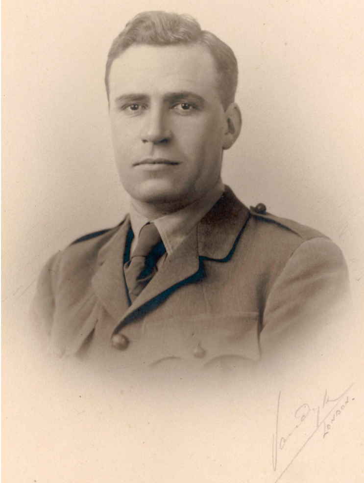
Ek 1: Keith Arthur Murdoch'in Portresi http://blogs.slv.vic.gov.au/our-stories/the-letter-that-changed-history/ (26.08.2017)