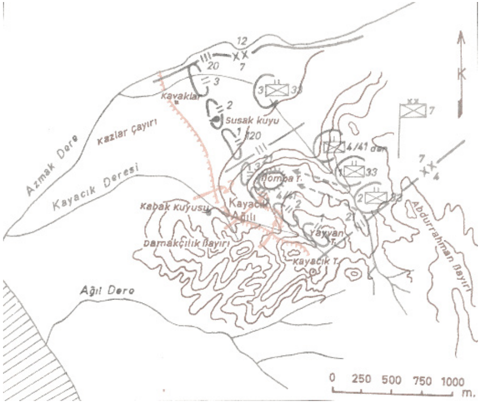
Şekil 2: 27 Ağustos 1915'te 4. Tümenin Mıntıkası (Çanakkale Cephesi Harekâtı, 2014, Kroki 68)

Tanin Gazetesi'nden Ekrem Bey ile cephede bulunan Necati Bey'in faaliyetlerine dair bilgiyi bu notlardan edinmekteyiz. Bu kayıtlarla arşiv belgelerinin tutarlılığı sayesinde iki taraftan bilgilerin doğrulanmasının verdiği güven doğrultusunda Necati Bey'in çalışmalarını ortaya çıkarmak mümkündür.