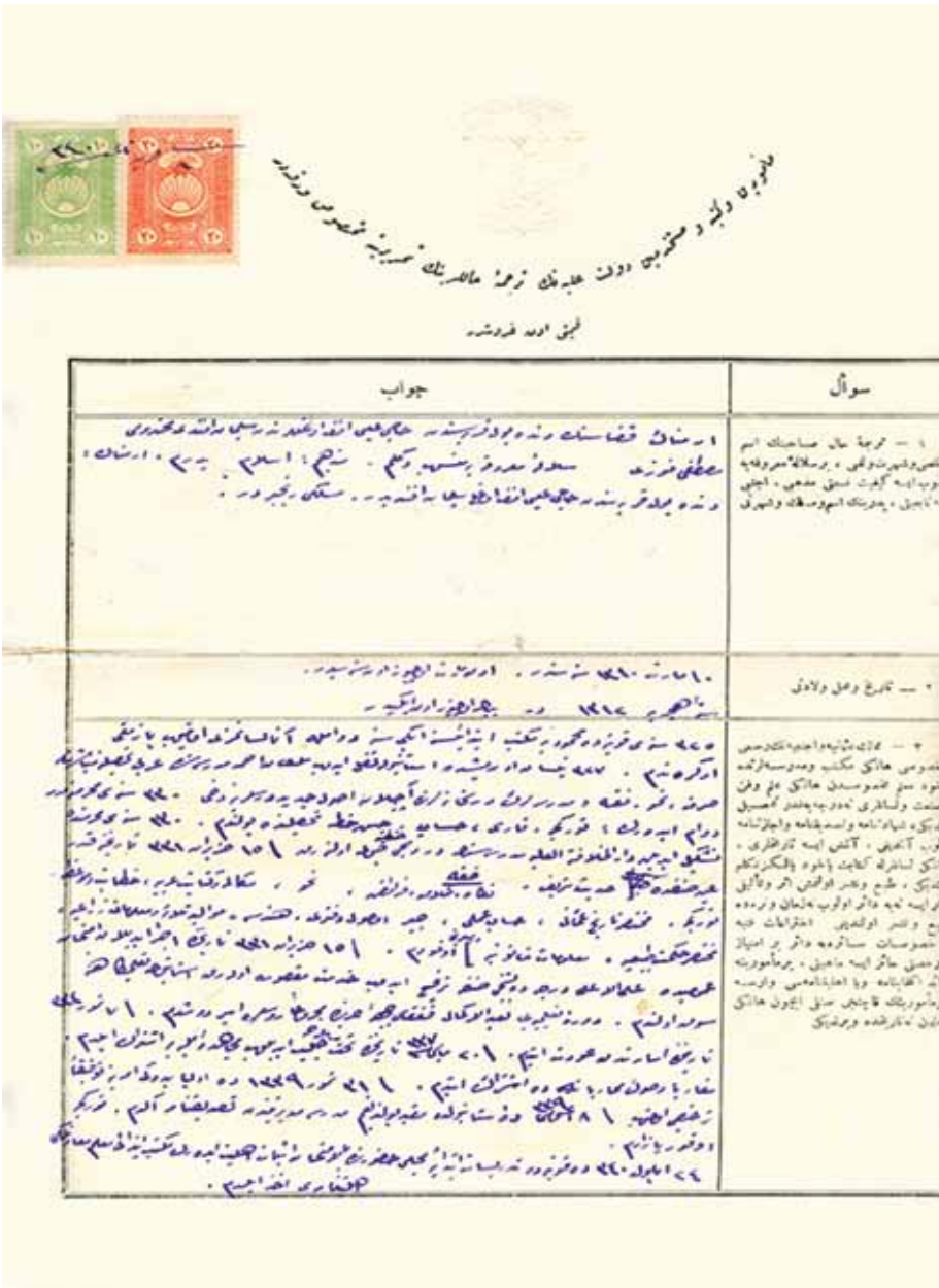
Ek 4. Mustafâ (Bolay)'ın Öğretmen Sicil Dosyasında Tercüme-i Hâl Varakasından Bir Sayfa