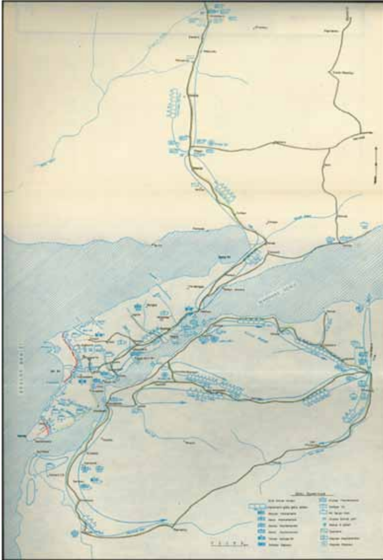
EK-6 Çanakkale Cephesinde 5'inci Ordu Menzil Kollarıyla Bu Kolların Çalıştığı Bölgeler ve Diğer Menzil Teşkilleri (30 Eylül 1915)

Türk Silahlı Kuvvetleri Tarihi Osmanlı Devri Birinci Dünya Harbi'nde Türk Harbi V nci Cilt 3 ncü Kitap Çanakkale Cephesi Harekâtı (Haziran 1915-Ocak 1916), Genelkurmay Başkanlığı ATASE Yay., Ankara, 1980, s. Kroki: 59.