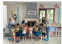
Öğrencilerimizin Sokak Hayvanları

Öğrencilerimizin Sokak Hayvanları Sosyal Sorumluluk Kampanyası Hayata Geçti 29.06.2021