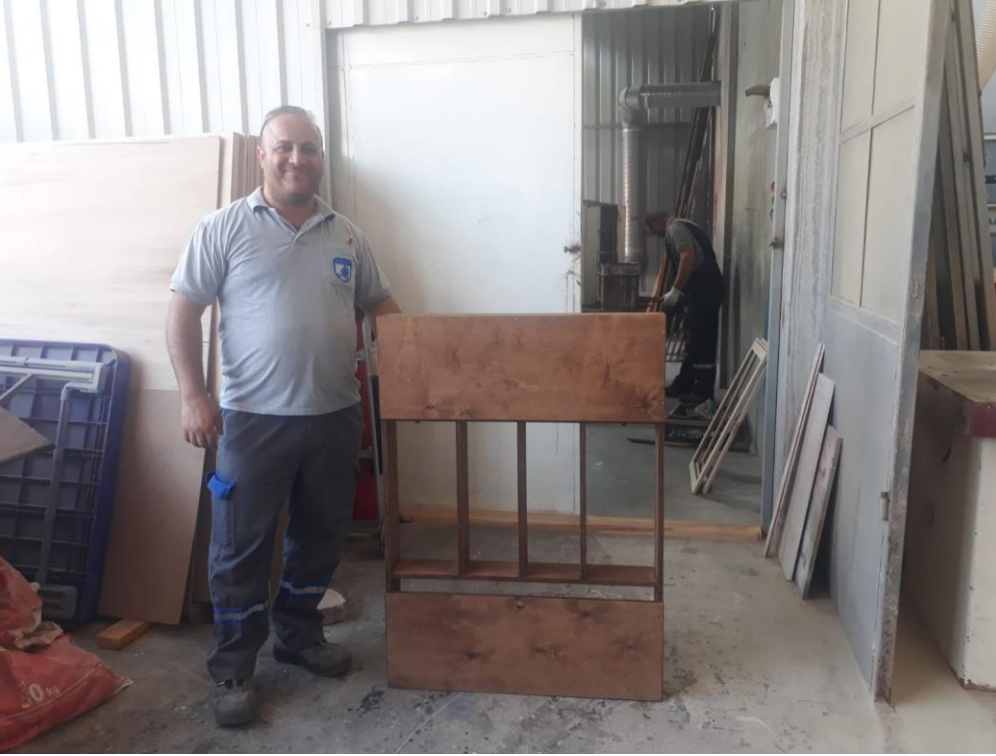
Kutuların yapım aşamaları.