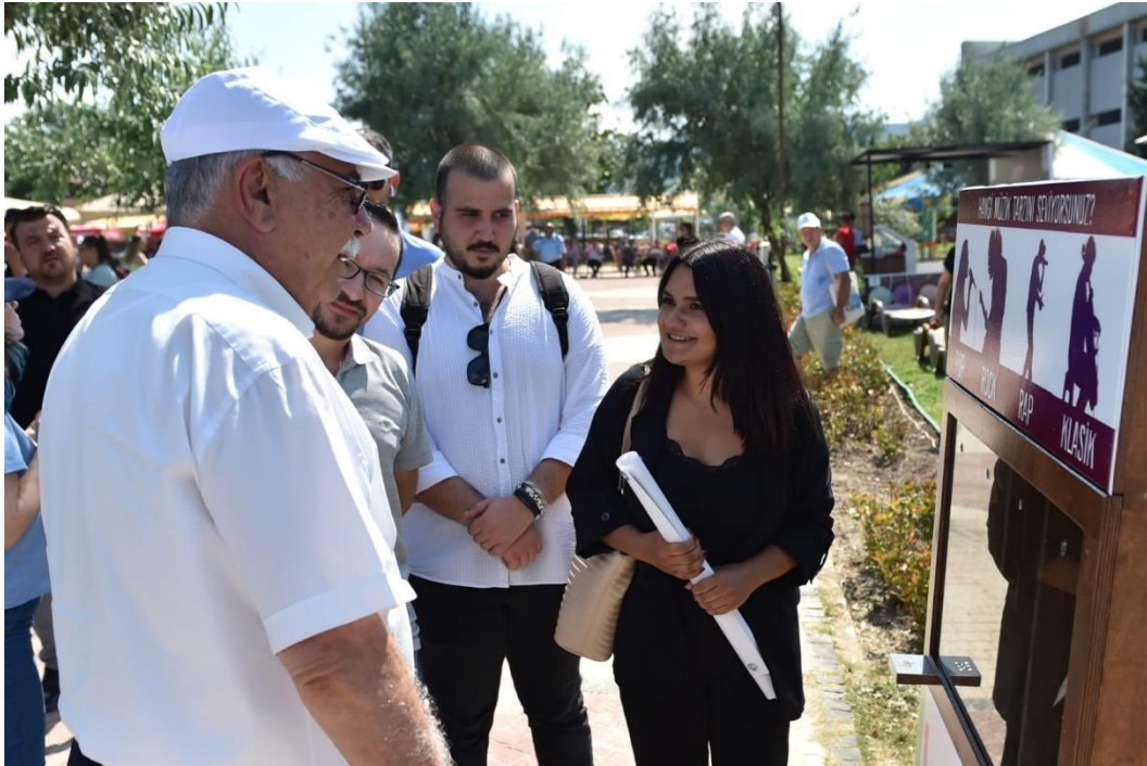
Çanakkale Belediye Başkanı Ülgür Gökhan ile projemizin açılışı yapıldı.