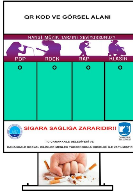
Taslak olarak hazırladığımız kutunun görseli.