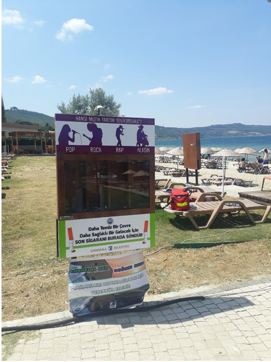
Kutuların son hali (Çanakkale Belediyesi Güzelyalı Halk Plajı)