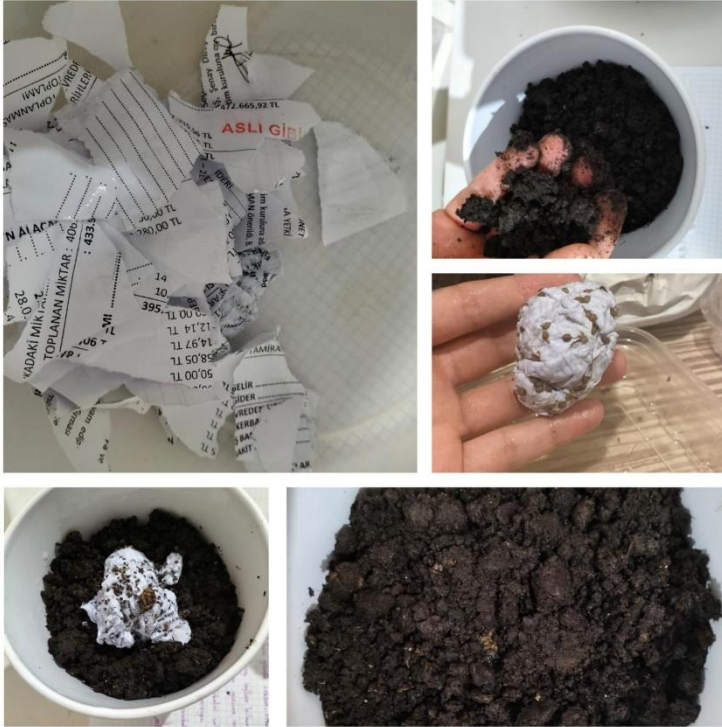
Umut Toplarının gelişim evreleri