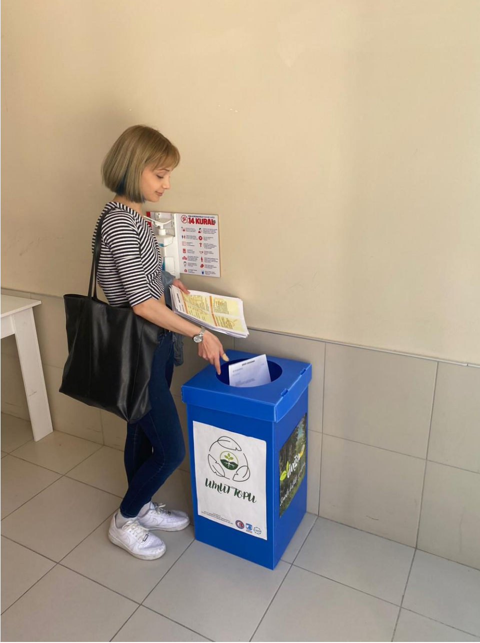
Yerleřtirdiđimiz kađıt atık kutularının dolum sũreci