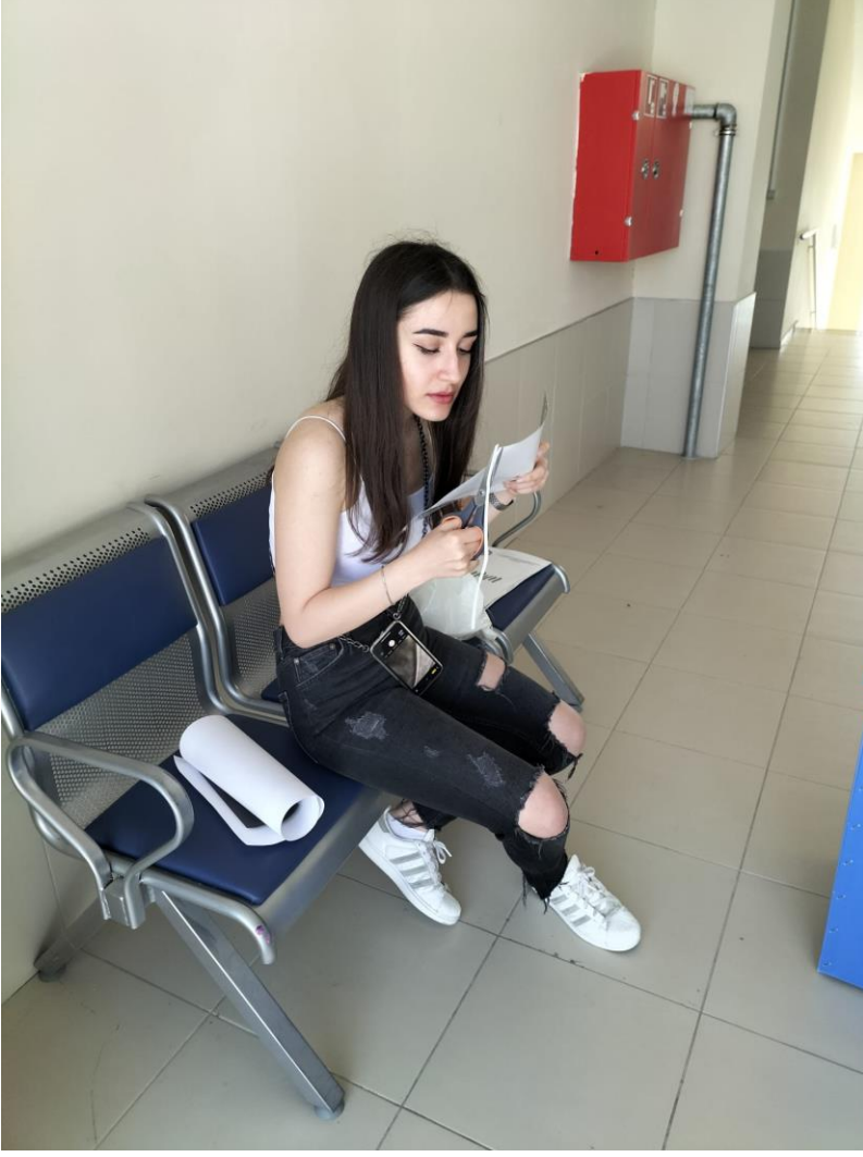
Kutu üzerine yapıştırılacak proje tanıtım afişinin hazırlanma süreci