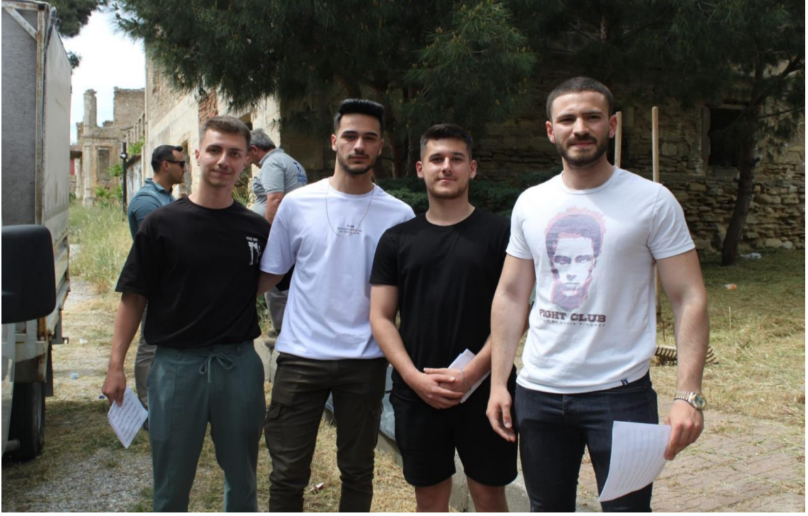
Çevre temizliđi faaliyetinden görüntüler;