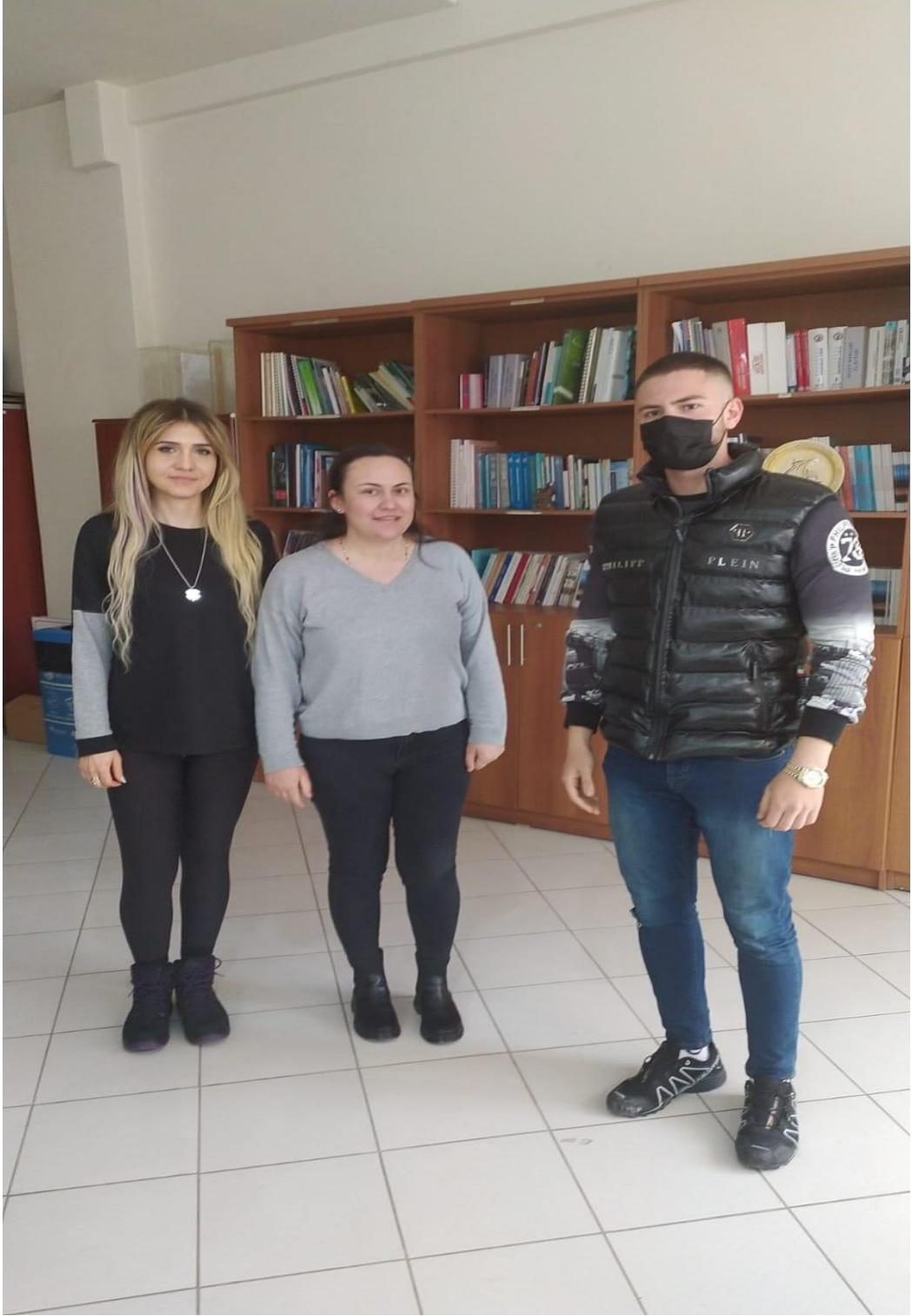
Çanakkale Kent Konseyi ile yaptığımız görüşme;