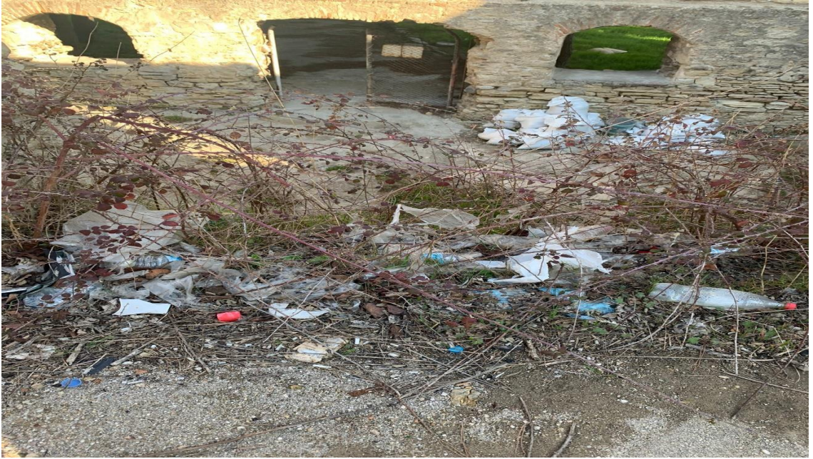
Çevre temizliğini gerçekleştireceğimiz Eski Merkez Askeri Hastanesinin Görüntüleri;