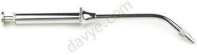
şırınga tip amalgam tabancası ( taşıyıcı )