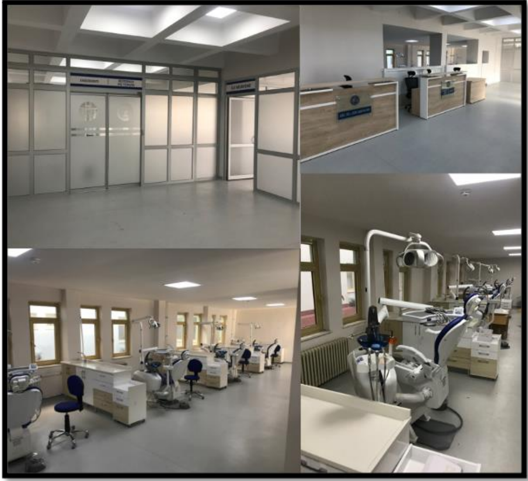
Resim 8. Zemin katta bulunan İlk Muayene kliniğimiz ile Restoratif Diş Tedavisi ve Endodonti bölümümüzün ortak kullandığı kliniklerimiz.

Bu katta bulunan Radyoloji birimimizde hastalarımız radyolojik görüntülemeleri ve raporlamaları yapılacaktır. Radyoloji birimimizde bulunan cihazlarımız şunlardır: