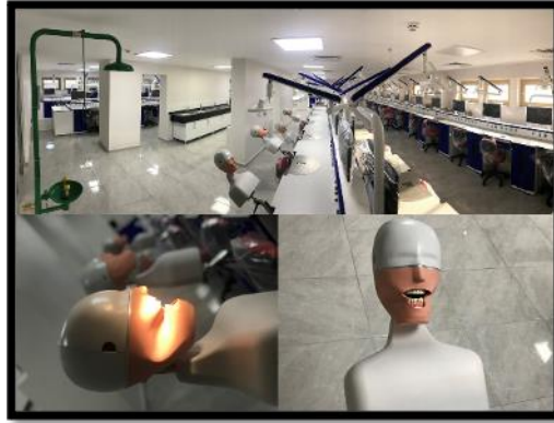
Resim 2. Fantom Simulasyon Laboratuvarı.

Bodrum 1. Kat: Bu katta Diş Hekimliği öğrencilerinin klinikte uygulayacakları tedavilerin bir kısmının eğitimini aldıkları, 62 öğrenci ve 1 eğitmen kapasiteli Fantom Simulasyon Laboratuvarı (Resim 2) bulunmaktadır. Yine bu katta, hasta ve çalışanlarımızın kullanabileceği, kadın-erkek abdesthane ve mescitler bulunmaktadır (Resim 3). Ayrıca merkezimizde bulunan ünitlerin çalışması için kullanılan dental kompresör ve aspirasyon cihazlarının bulunduğu bir oda (Resim 4), 60 m 2 'lik bir alana sahip çamaşırhane (Resim 5), 8 adet birbirinden bağımsız odadan oluşan toplamda yaklaşık 180 m 2 'lik depo alanı (Resim 6) ve merkezi ısıtma sisteminin kazan dairesi bulunmaktadır.