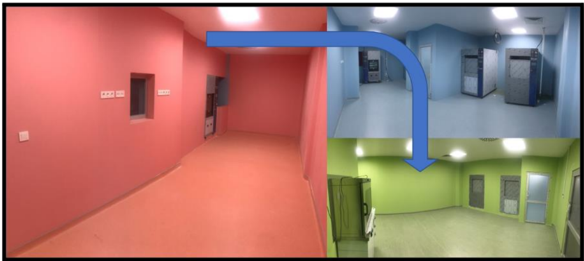
Resim 12. Merkezi sterilizasyon birimimizin fiziki yapısı ve sterilizasyon döngüsü.

Merkezimizdeki tüm tıbbi malzemelerin sterilizasyonunun yapılacağı Merkezi Sterilizasyon Birimi de bu katta yer almaktadır. Merkezi Sterilizasyon Birimimiz, kirli alet girişinden steril alet çıkışına kadar tek yönlü olarak çalışacak şekilde planlanmış ve havalandırma sistemi diğer birimlerden ayrı, standartlara uygun olarak HEPA filtreli ve hava akım yönü steril alandan kirli alana olacak şekilde planlanmıştır (Resim 12).