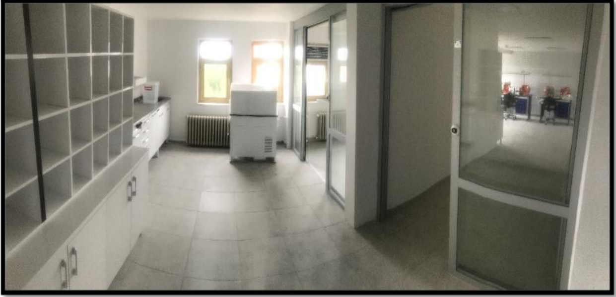
Resim 10. Protez Laboratuvarı