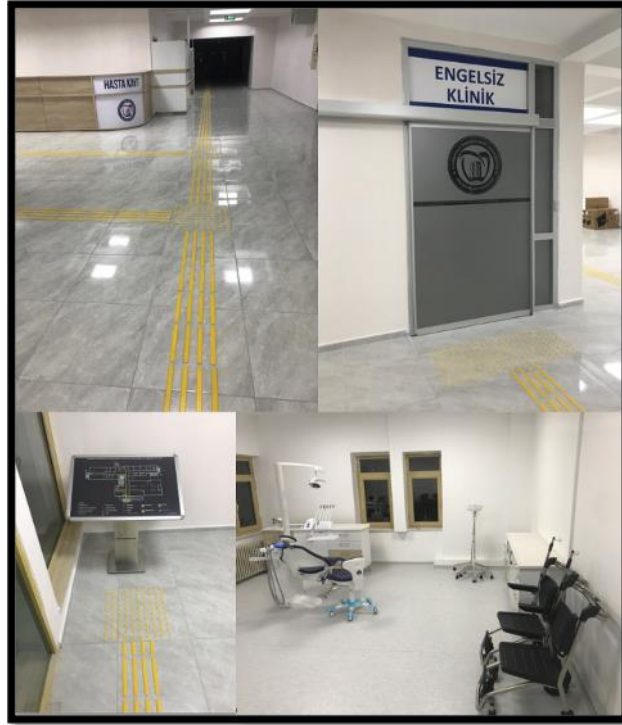
Resim 7. Merkezimizde Engelli hastalar için yapılan düzenlemeler ve Engelsiz Kliniğimiz.

Zemin kat: Merkezimiz girişinde sağ tarafta engelli hastalarımız için rampa bulunmaktadır. Görme engelli hastalarımız için bina girişinden başlayarak sırasıyla; hasta kayıt bankosuna, vezneye, engelli tuvaletine, merdiven başlangıcına, asansöre ve son olarak da radyoloji bankosuna kadar zemin kabartma uygulanmış olup aynı zamanda bina girişinde sol tarafta Braille alfabesiyle hazırlanmış bina planı bulunmaktadır. Girişte sol tarafta 32 m 2 'lik bir alana sahip bağımsız bir Engelsiz Kliniği bulunmakta olup, engelli hastalarımızın neredeyse tüm tedavileri burada gerçekleştirilebilecektir (Resim7). Sağ tarafta; 4 ünit kapasiteli İlk Muayene Polikliniği , Restoratif Diş Tedavisi ve Endodonti anabilim dallarının ortak kullanacakları 13 ünit kapasiteli bir Poliklinik yer almaktadır (Resim 8).