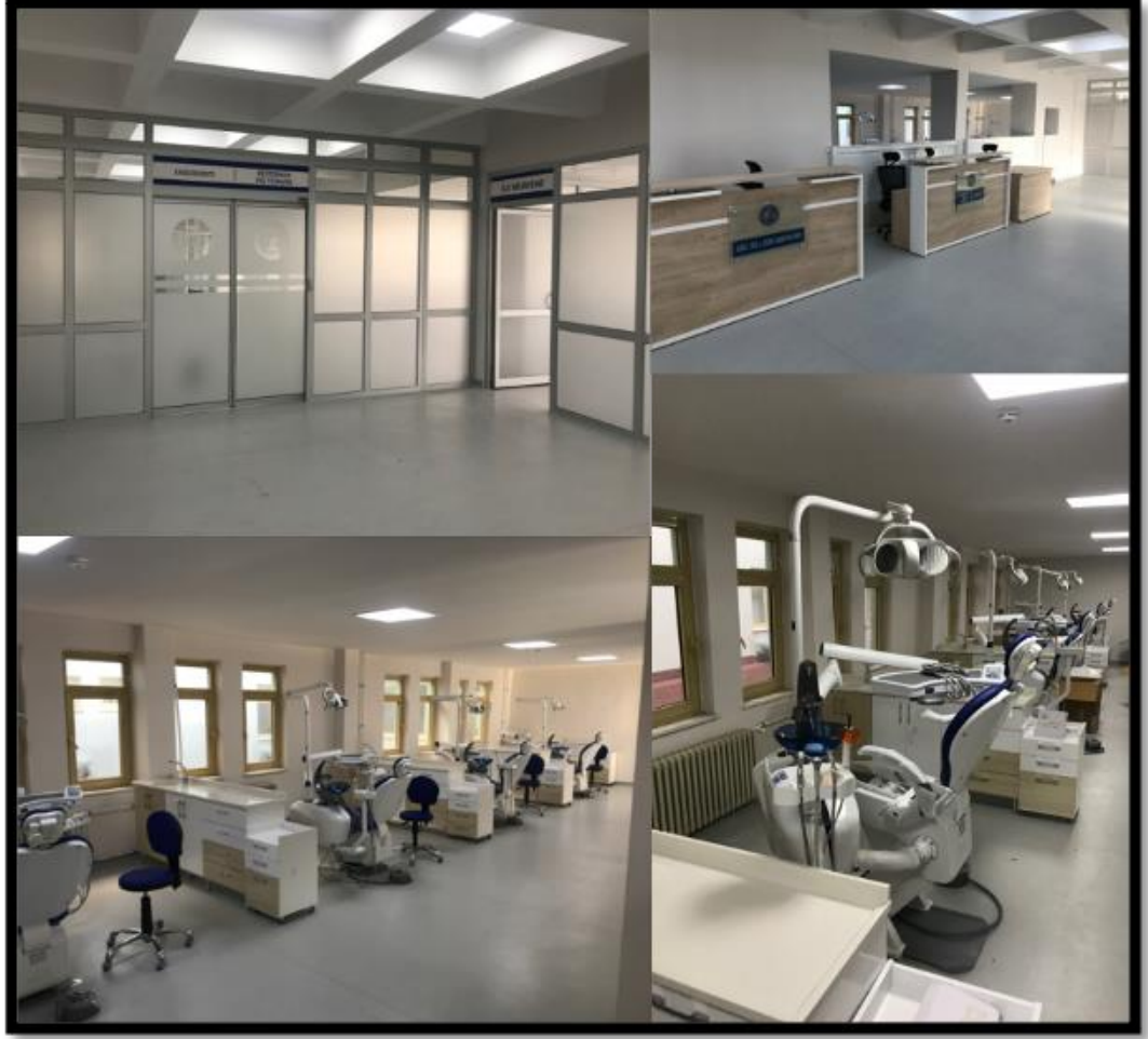
Resim 8. Zemin katta bulunan İlk Muayene kliniğimiz ile Restoratif Diş Tedavisi ve Endodonti bölümümüzün ortak kullandığı kliniklerimiz.

Bu katta bulunan Radyoloji birimimizde hastalarımız radyolojik görüntülemeleri ve raporlamaları yapılacaktır. Radyoloji birimimizde bulunan cihazlarımız şunlardır: