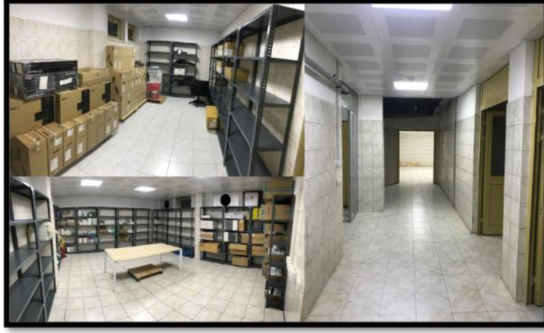
Resim 6. Depo alanları

Zemin kat: Merkezimiz girişinde sağ tarafta engelli hastalarımız için rampa bulunmaktadır. Görme engelli hastalarımız için bina girişinden başlayarak sırasıyla; hasta kayıt bankosuna, vezneye, engelli tuvaletine, merdiven başlangıcına, asansöre ve son olarak da radyoloji bankosuna kadar zemin kabartma uygulanmış olup aynı zamanda bina girişinde sol tarafta Braille alfabesiyle hazırlanmış bina planı bulunmaktadır. Girişte sol tarafta 32 m 2 'lik bir alana sahip bağımsız bir Engelsiz Kliniği bulunmakta olup, engelli hastalarımızın neredeyse tüm tedavileri burada gerçekleştirilebilecektir (Resim7). Sağ tarafta; 4 ünit kapasiteli İlk Muayene Polikliniği , Restoratif Diş Tedavisi ve Endodonti anabilim dallarının ortak kullanacakları 13 ünit kapasiteli bir Poliklinik yer almaktadır (Resim 8).