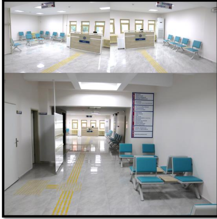
Resim 9. Zemin katta bulunan bekleme alanı.

Bu katta yukarıda sayılanlara ek olarak: