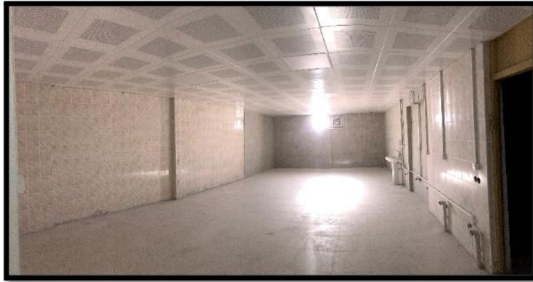
Resim 5. Çamaşırhane