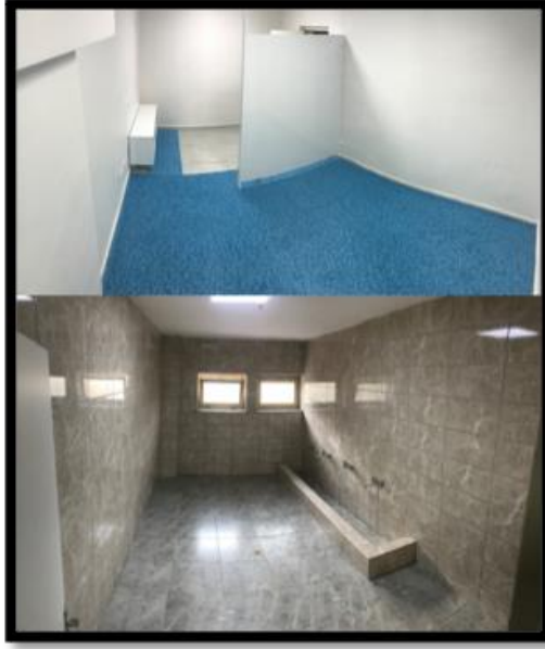
Resim 3. Mescit ve Abdesthaneler.