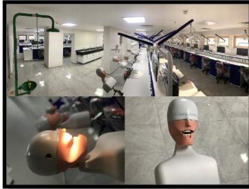
Resim 2. Fantom Simulasyon Laboratuvarı.

Bodrum 1. Kat: Bu katta Diş Hekimliği öğrencilerinin klinikte uygulayacakları tedavilerin bir kısmının eğitimini aldıkları, 62 öğrenci ve 1 eğitmen kapasiteli Fantom Simulasyon Laboratuvarı (Resim 2) bulunmaktadır. Yine bu katta, hasta ve çalışanlarımızın kullanabileceği, kadın-erkek abdesthane ve mescitler bulunmaktadır (Resim 3). Ayrıca merkezimizde bulunan ünitelerin çalışması için kullanılan dental kompresör ve aspirasyon cihazlarının bulunduğu bir oda (Resim 4), 60 m 2 'lik bir alana sahip çamaşırhane (Resim 5), 8 adet birbirinden bağımsız odadan oluşan toplamda yaklaşık 180 m 2 'lik depo alanı (Resim 6) ve merkezi ısıtma sisteminin kazan dairesi bulunmaktadır.