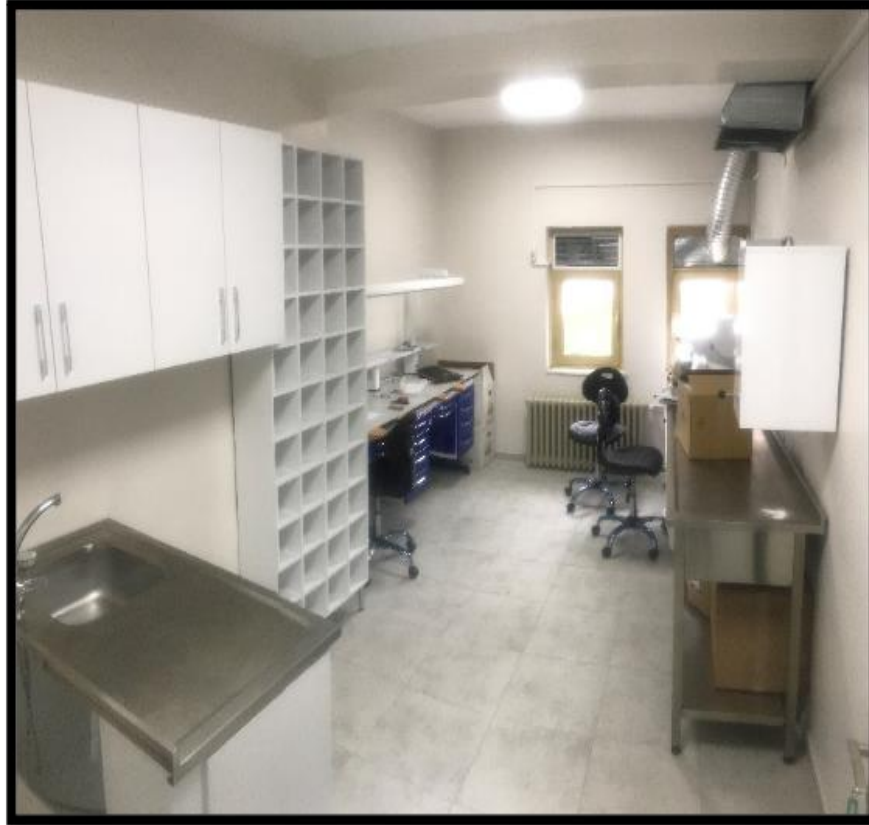
Resim 11. Ortodonti ve Pedodonti Laboratuvarı.

Merkezimizdeki tüm tıbbi malzemelerin sterilizasyonunun yapılacağı Merkezi Sterilizasyon Birimi de bu katta yer almaktadır. Merkezi Sterilizasyon Birimimiz, kirli alet girişinden steril alet çıkışına kadar tek yönlü olarak çalışacak şekilde planlanmış ve havalandırma sistemi diğer birimlerden ayrı, standartlara uygun olarak HEPA filtreli ve hava akım yönü steril alandan kirli alana olacak şekilde planlanmıştır (Resim 12).