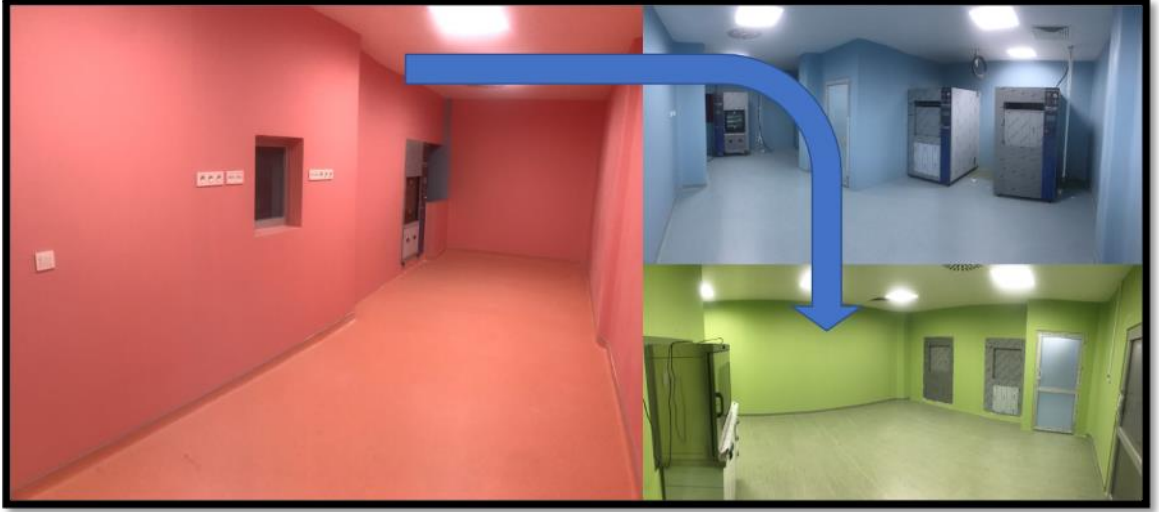
Resim 12. Merkezi sterilizasyon biriminin fiziki yapısı ve sterilizasyon döngüsü.

Bu birimde bulunan cihazlarımız şunlardır: