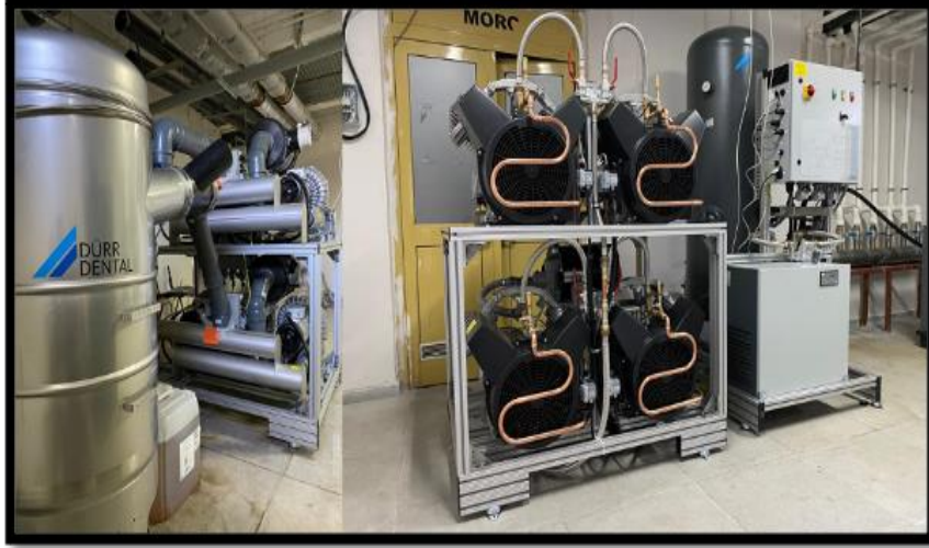
Resim 4. Kompresör ve Vakum odası