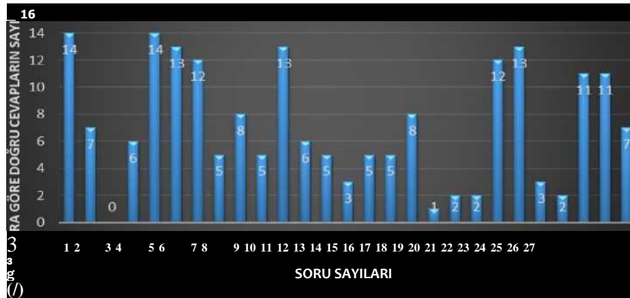
Tablo 13 Teknik Bölümler Sorulara Göre Doğru Cevap Grafiği

Grafik incelendiğinde 1-5-6-7-11-21-22 nolu sorulara bakıldığında bu konulara bütün bölüm ve programların hakim olduğu gözükmektedir. 18. soruya bakıldığında sadece 1 kişinin swot analiz yapmayı bildiğini, 19 soruya baktığımızda ise sadece 2 kişinin programına swot analizi yaptığını göstermektedir.