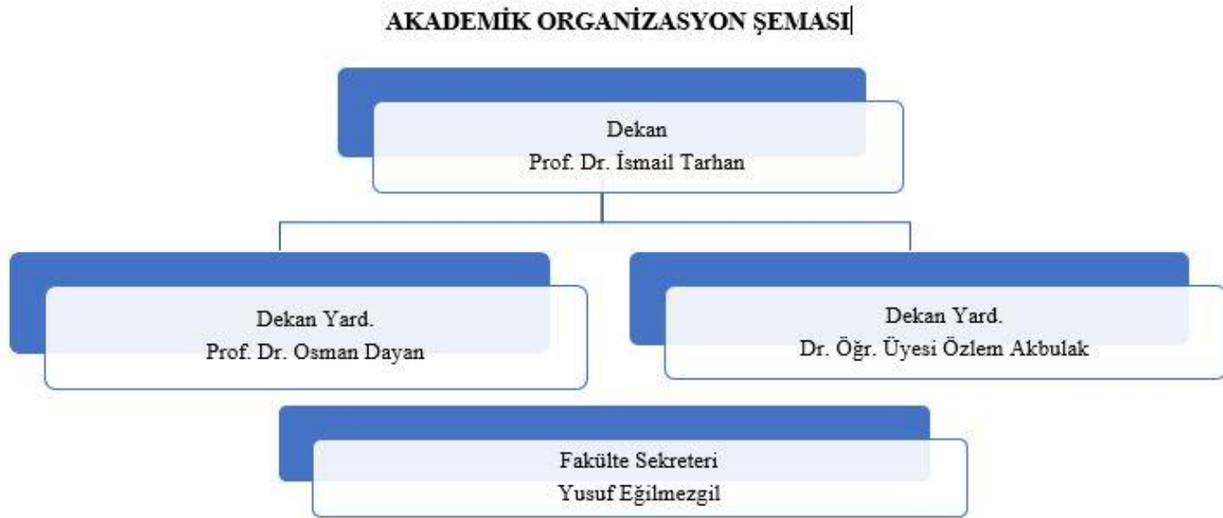
Tablo 21. Akademik Faaliyetlere Ait Organizasyon Şeması