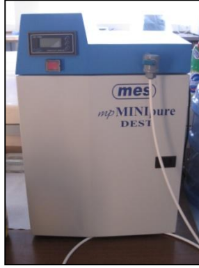
Saf su Cihazı