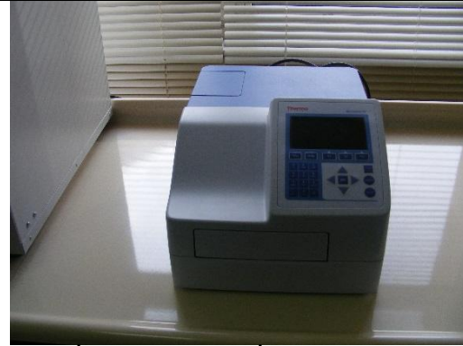
MİKROPLAK (ELİZA) OKUYUCU