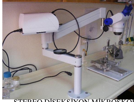
STEREO DİSEKSİYON MİKROSKOBU