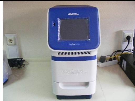
REAL TIME PCR