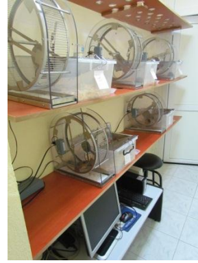
LOKOMOTOR AKTİVİTE SİSTEMİ