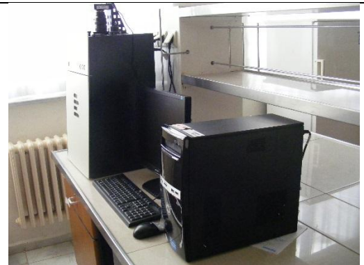
JEL GÖRÜNTÜLEME SİSTEMİ