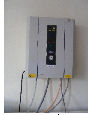
SAF SU CİHAZI