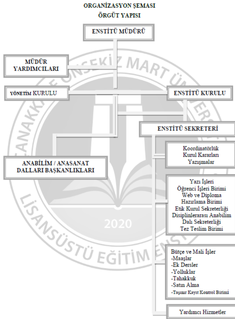
Tablo 22. İdari Faaliyetlere Ait Organizasyon Şeması

ğ) Enstitü anabilim dalı kurulu/enstitü anasanat dalı kurulu (EABDK/EASDK): Lisans Üstü Eğitim Öğretim Enstitülerinin Teşkilât ve İşleyiş Yönetmeliğinin 5 inci maddesinde enstitüler için enstitü anabilim dalı/enstitü anasanat dalı olarak tanımlanan birimlerin kurullarını, ifade eder.