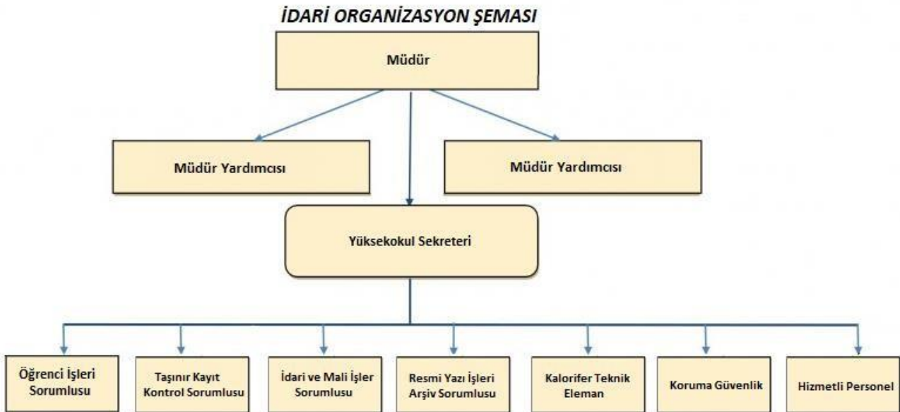
Şekil 1: 2023 Yılı Gökçeada MYO İdari Organizasyon Şeması

Birimde görev ve sorumluluklar ilgili prosedürler ile ayrıntılı olarak belirlenmiştir. Bu çerçevede Meslek Yüksekokulu Müdürü, Müdür Yardımcıları, Meslek Yüksekokulu Sekreteri, Meslek Yüksekokulu Kurulu, Meslek Yüksekokulu Yönetim Kurulu, Bölüm Başkanlıkları, Program Danışmanları arasında görev dağılımı yapılmış ve sorumluluklar paylaştırılmıştır.