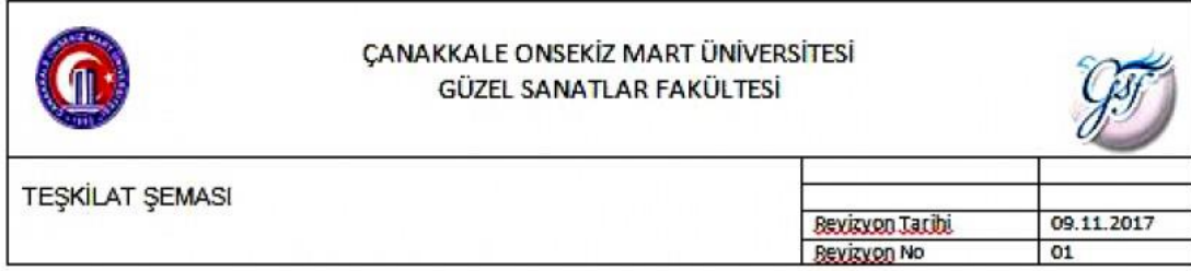
Tablo 23. Güzel Sanatlar Fakültesi Teşkilat Şeması