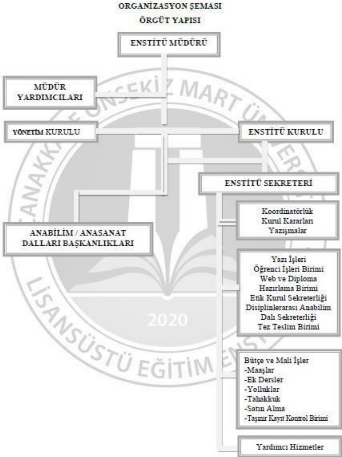
Tablo 29. Lisansüstü Eğitim Enstitüsü İş Akış Şeması (Belge Verilmesi)