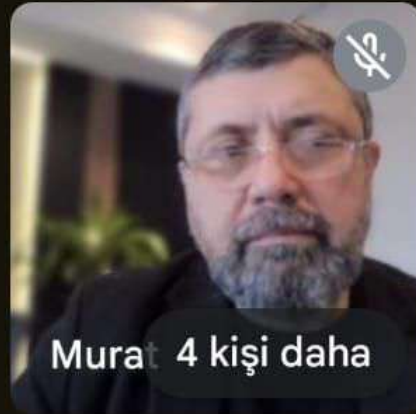
Mura 4 kişi daha