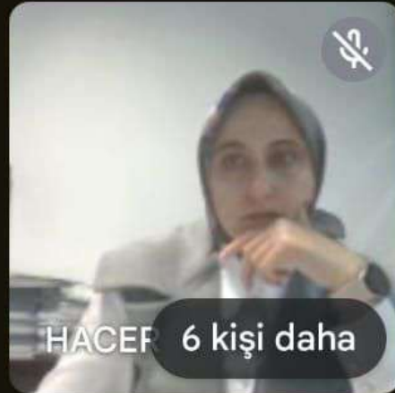
HACEF 6 kişi daha