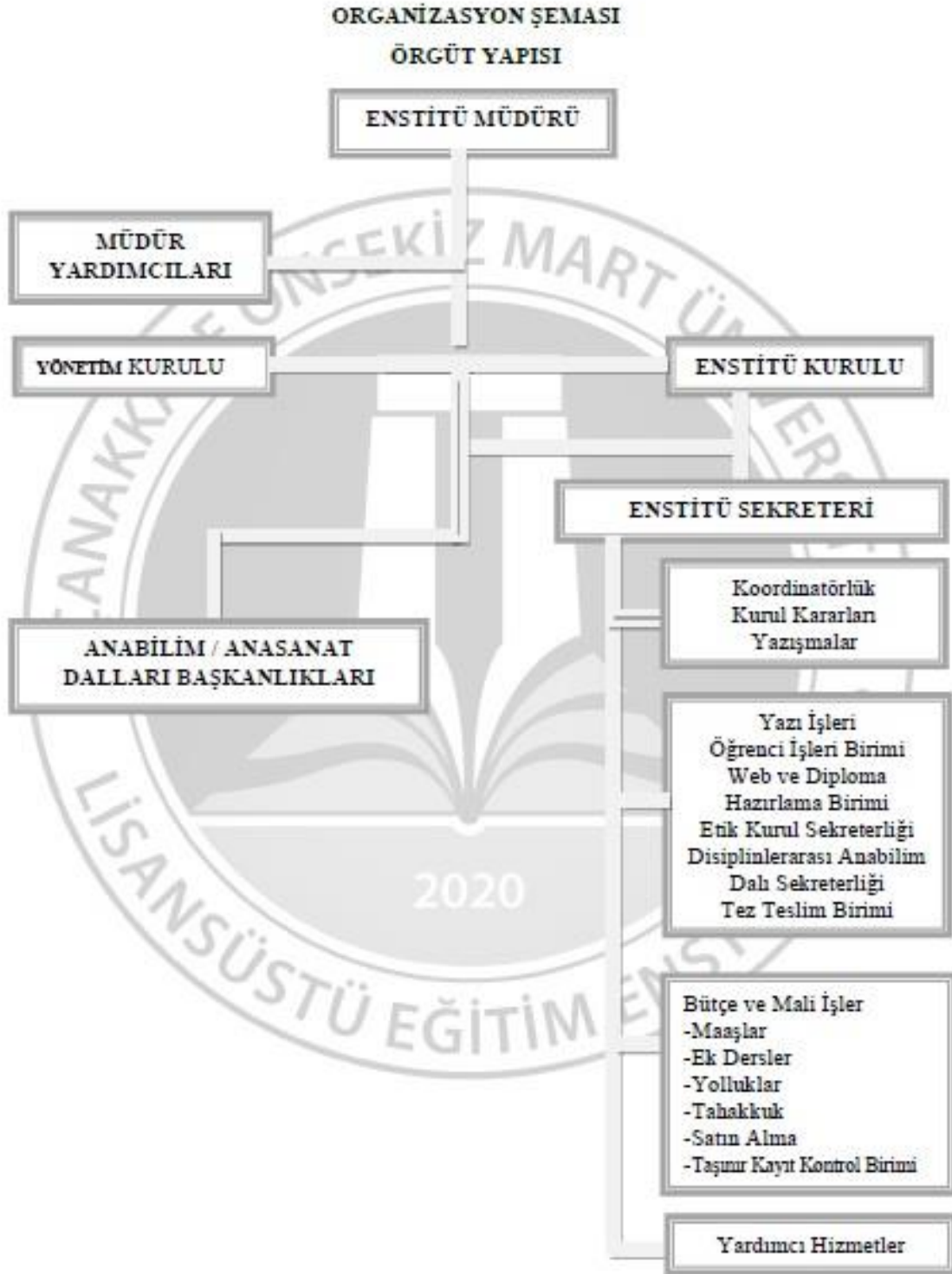
Tablo 28. Lisansüstü Eğitim Enstitüsü Organizasyon Şeması