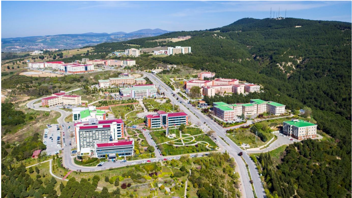
Foto 2. Çanakkale boğazına hakim radar sırtında kurulu Terzioğlu Yerleşkesi.

ana sosyal tesisleri de bu yerleşkededir. Orman ve denizin iç içe girdiği yerleşke aynı zamanda tarihi Dardanos antik kentinin de kalıntılarını içermektedir. Kent merkezinde yer alan dördüncü yerleşkemiz, Çanakkale-Bursa Karayolu üzerinde bulunan Sarıcaeli'dir. Bu alan üzerinde tekno-park faaliyetlerimiz ve Ziraat Fakültesinin uygulamaları sürmektedir. Çanakkale-Bursa Karayolu üzerinde yeni kurulan beşinci yerleşkemiz olan Çanakkale Şehitleri, İlahiyat Fakültesi ve İlahiyat Fakültesi İÇDAŞ Kongre Merkezini içerisinde barındırmaktadır. Şehir merkezinde Kepez'de hastanemizin bazı birimleri ve Nedime Hanım yerleşkesinde de bazı birimlerimiz bulunmaktadır. Ayrıca Terzioğlu Yerleşkesinin olduğu sırtın en zirve noktasında yer alan radar tepesinde, Astrofizik Araştırma Merkezi ve Ulupınar Gözlemevi bulunmaktadır. Gözlemevi Dünya literatüründe önemli bir tutan güçlü bir teleskopa sahiptir. Bunların dışında; Biga'da, Biga İktisadi ve İdari Bilimler Fakültesi, Biga Uygulamalı Bilimler Yüksekokulu ve Biga Meslek Yüksek Okulunun bulunduğu Ağaköy Yerleşkesi bulunmaktadır. Ayrıca; Biga, Ayvacık, Bayramiç, Çan, Ezine (Yahya Çavuş Yerleşkesi), Yenice, Lâpseki, Gelibolu ve Gökçeada'da, genel olarak Yüksekokul ve Meslek Yüksek Okullarımızın adıyla kurulu yerleşkelerimiz bulunmaktadır.