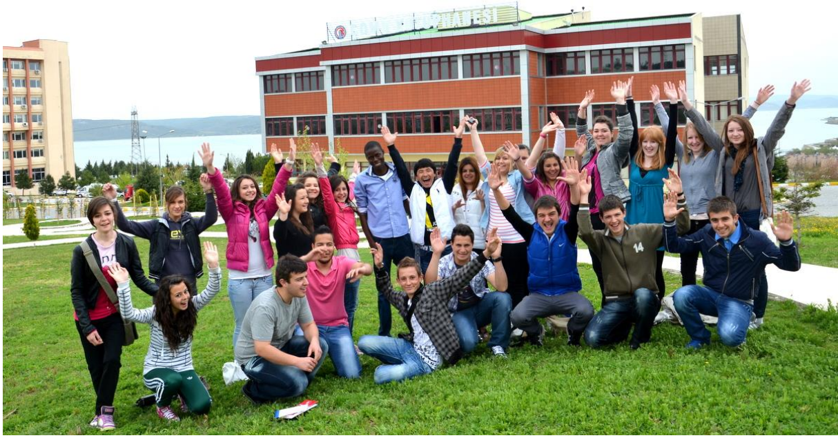
Foto 4. Üniversitemizde öğrenim gören yabancı uyruklu öğrencilerimizden bir görünüm.

ECTS etiketinden sonra yeni bir aşama olarak mezun veren programlarımızın bir plan kapsamında “program akreditasyonları” ile laboratuvarlarımızın “kalite tescil akreditasyonları”nın önümüzdeki iki yıl içerisinde gerçekleşmesini beklemekteyiz. Geçen bir yıl içerisinde 20’den fazla programımız akreditasyon çalışmaları içerisinde girmiştir. 2017 ve 2018 yıllarında akredite olan programlara sahip olma heyecanı duymaktayız.