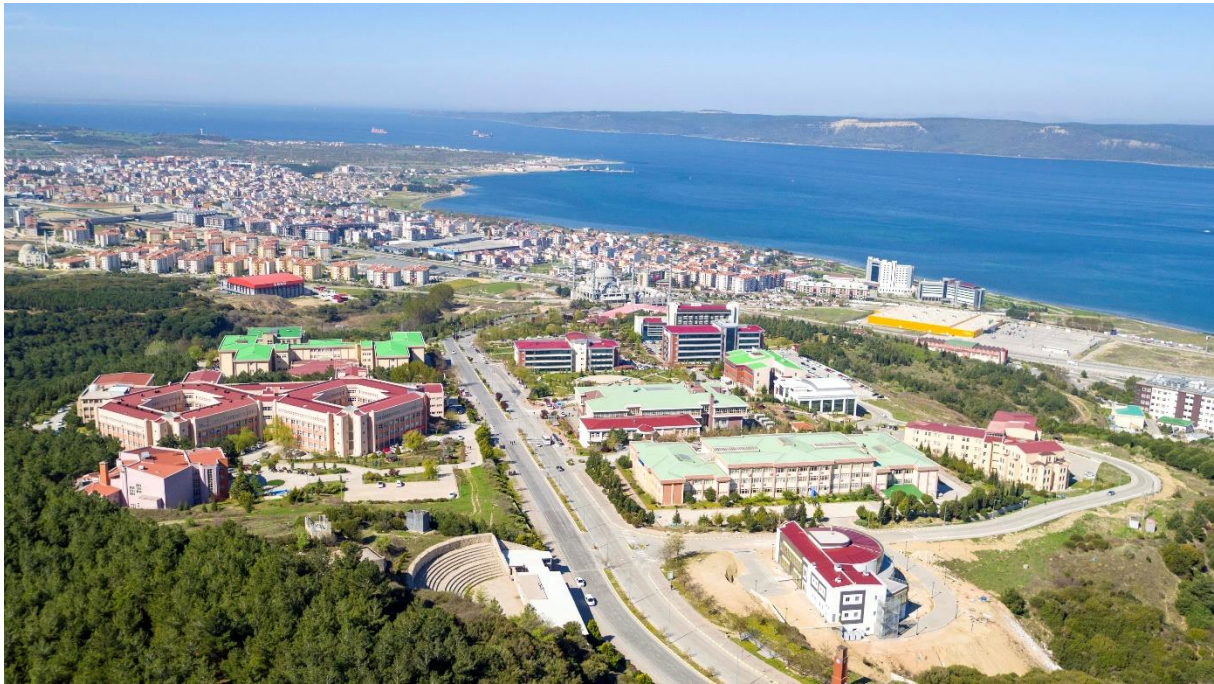
Foto 1. Yakın planda Terzioğlu Yerleşkesi uzak planda Kepez Beldesinin görünümü.

Üniversitemize bağlı 15 adet yerleşke bulunmaktadır. Bunlardan 7 tanesi kent merkezindedir. Ana yerleşkemiz, Çanakkale-İzmir karayolu 1. km sinde yer alan Terzioğlu Yerleşkesidir. Üniversitemizin pek çok fakülte, yüksekokul ve birimi Terzioğlu Yerleşkesi'nde bulunmaktadır. Yerleşke, denize sadece birkaç yüz metre uzaklıkta, sırtını Radar Tepesi'ne vermiş, ormanların içine gömülü çok ayrıcalıklı doğal güzelliğe sahip bir konumdadır (Foto 1-2).