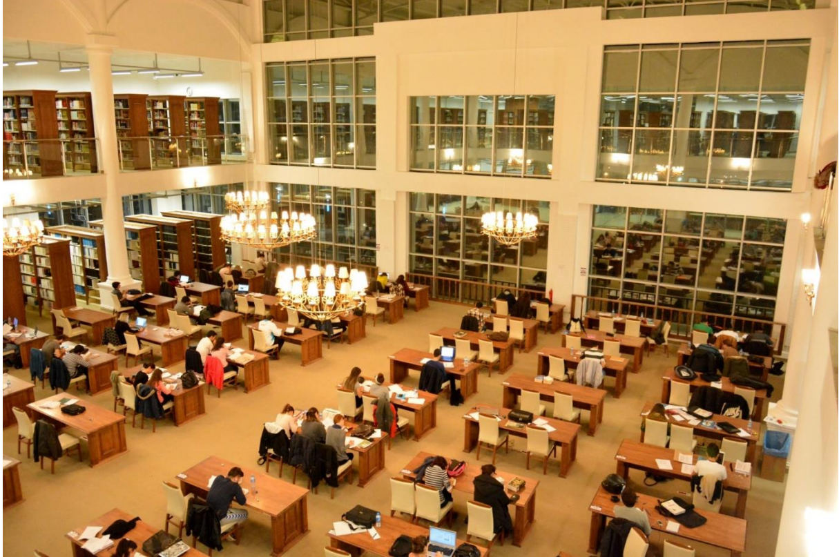
Foto 3. Terzioğlu Yerleşkesi merkez kütüphanesinden bir görünüm.

Çanakkale Onsekiz Mart Üniversitesi gelişmiş bir merkezi kütüphaneye sahip olup (Foto 3), beraberinde yeni teknolojilerin kullanımını da teşvik etmektedir. Üniversite içerisinde kablosuz ağ üzerinden e-kaynaklara ulaşım, ÇOMÜ kart, uzaktan eğitim, eğitim ve öğretim bilgi sistemi ve birimlerdeki öğrenci laboratuvarlarında kullanılan yeni teknolojik ürünler ile teşvik edilmektedir.