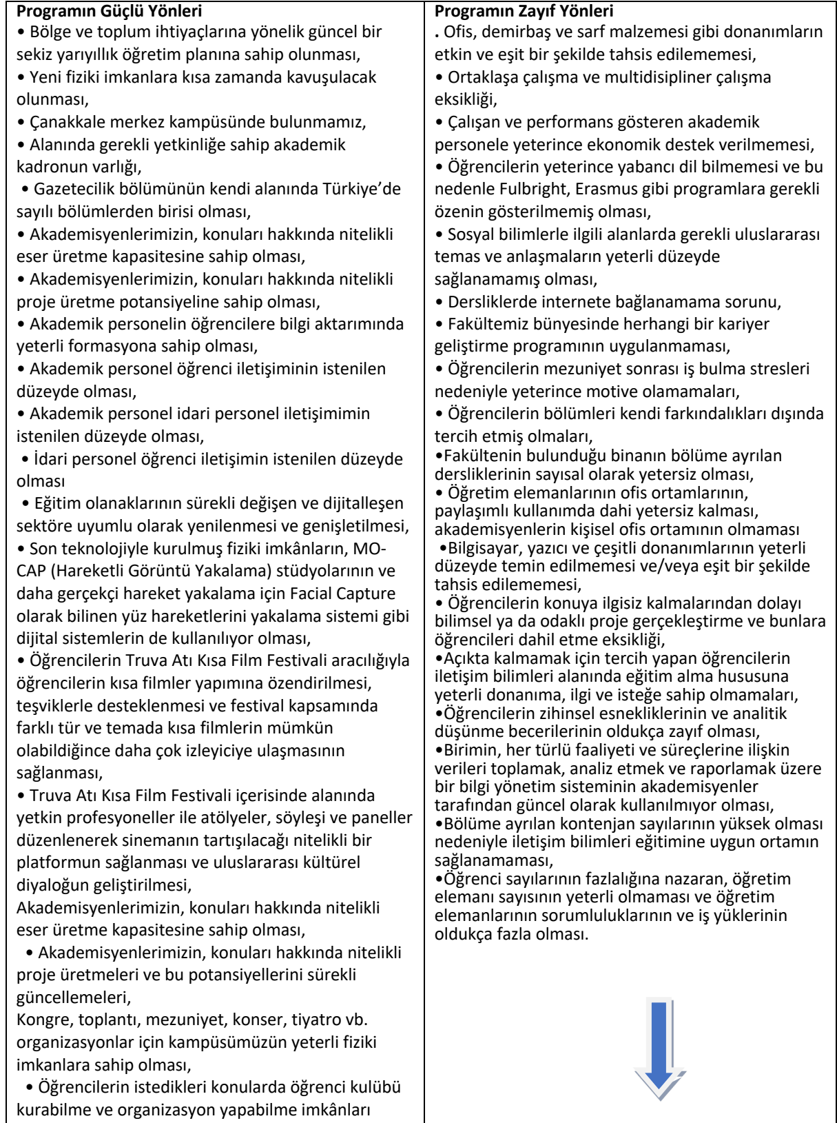
Tablo 11. Swot Matrisi Tablosu