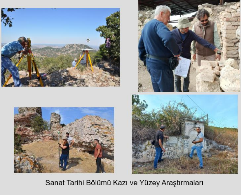
Sanat Tarihi Bölümü Kazı ve Yüzey Araştırmaları