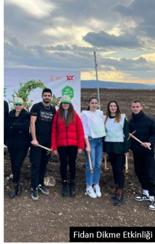
Fidan Dikme Etkinliği