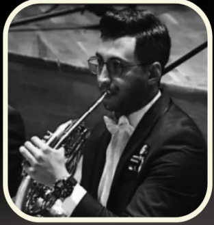
KORNO KORAY AY

TRGİA Çanakkale - Tübingen - Tofaş Vakfı