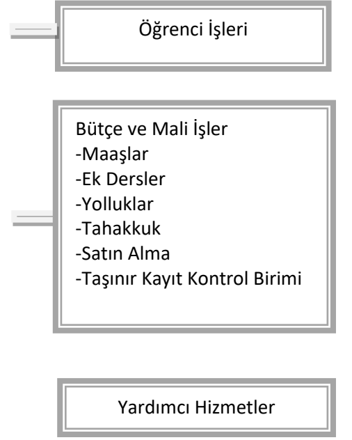
Tablo 19. Akademik Faaliyetlere Ait Organizasyon Şeması