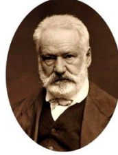
Victor Marie Hugo