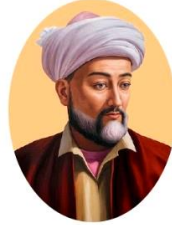
Ali Şîr Nevâî