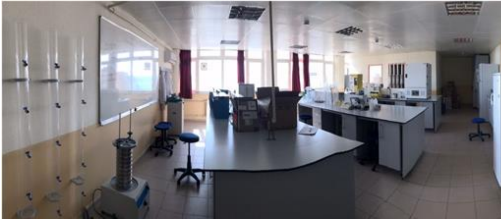
Şekil 3. Çevre Mühendisliği Bölümü Öğrenci Laboratuvarından Görünüm