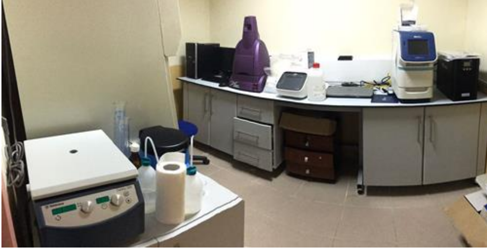
Şekil 7. Çevre Mühendisliği Bölümü Mikrobiyoloji Laboratuvarından Görünüm