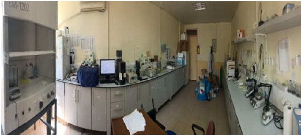
Şekil 8. Çevre Mühendisliği Bölümü Toprak-Yeraltı Suyu Laboratuvarından Görünüm