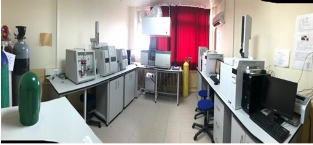
Şekil 5. Çevre Mühendisliği Bölümü Enstrümental Laboratuvarından Görünüm