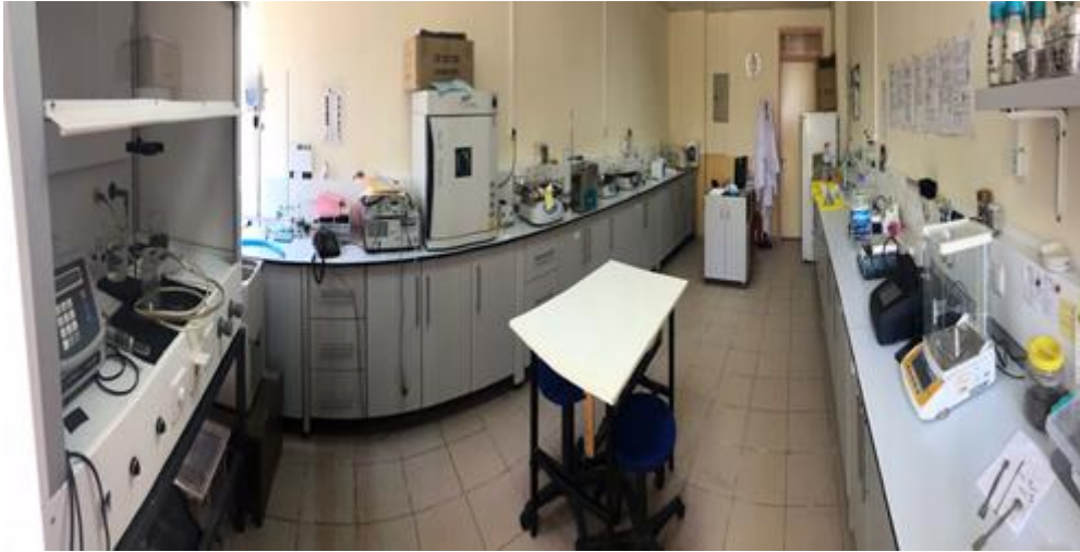
Şekil 9. Çevre Mühendisliği Bölümü İleri Oksidasyon Laboratuvarından Görünüm