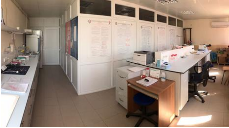
Şekil 6. Çevre Mühendisliği Bölümü Hava Kirliliği Laboratuvarından Görünüm