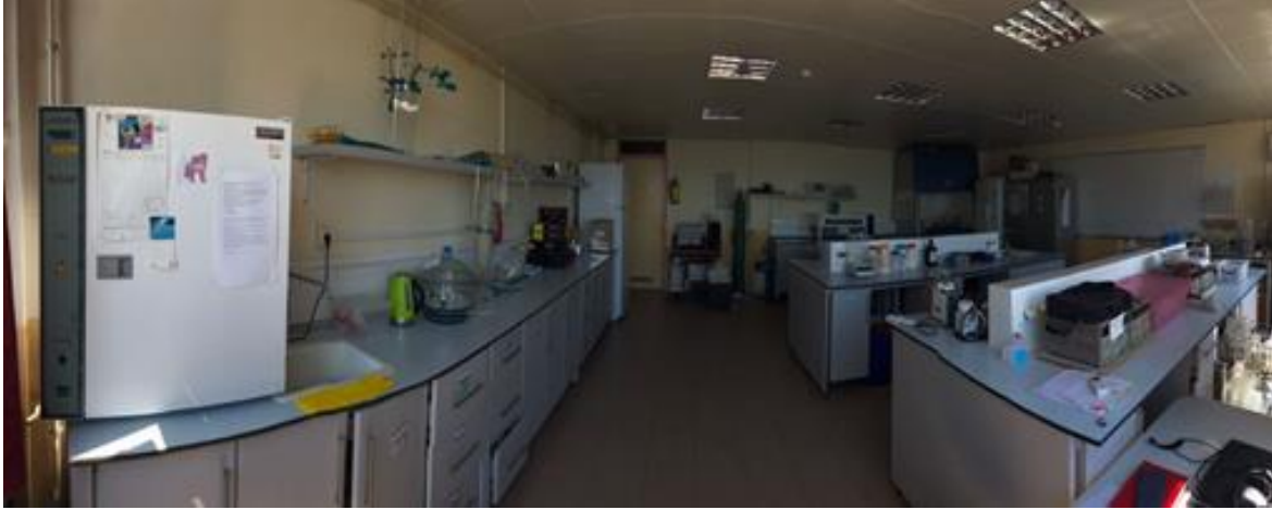
Şekil 4. Çevre Mühendisliği Bölümü Su-Atıksu Laboratuvarından Görünüm