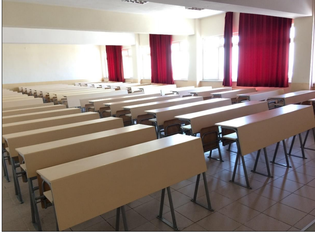
Şekil 11.4. Harita Mühendisliği Bölümü A307 Nolu Sınıf (140 Kişi Kapasiteli)