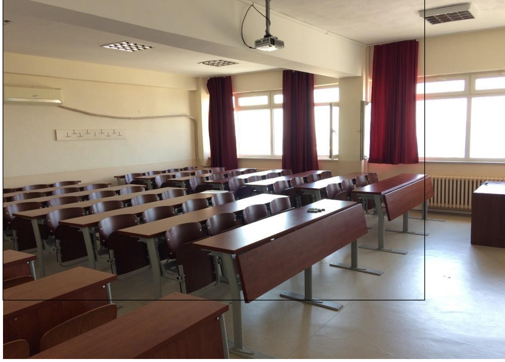
Şekil 11.3. Harita Mühendisliği Bölümü A309 Nolu Sınıf (62 Kişi Kapasiteli)