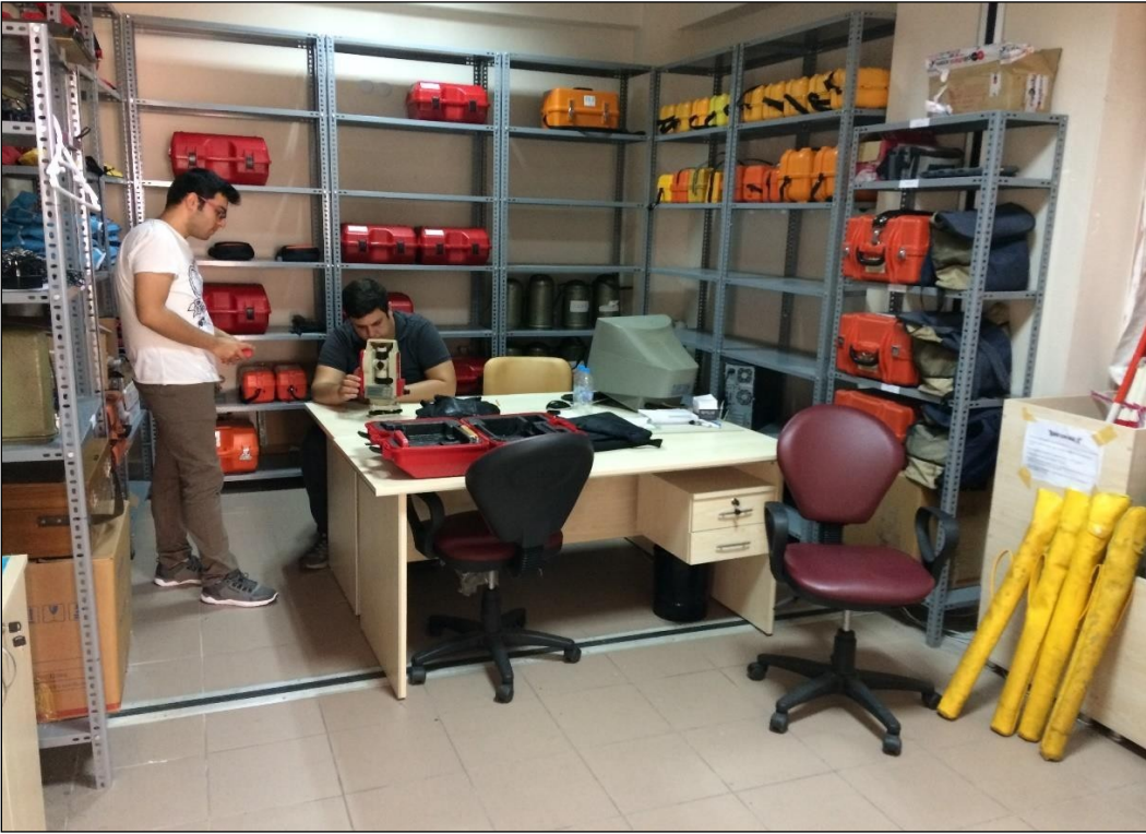
Şekil 11.7. Mühendislik Fakültesi Z12 Nolu Ölçme Aletleri Laboratuvarı