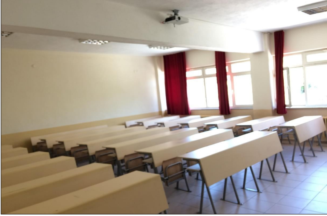
Şekil 11.2. Harita Mühendisliği Bölümü A301 Nolu Sınıf (60 Kişi Kapasiteli)