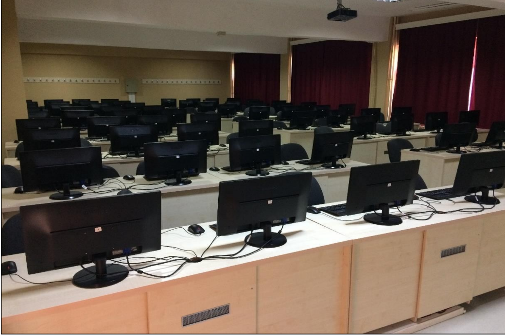
Şekil 11.6. Mühendislik Fakültesi C10 Nolu Laboratuvar (73 Kişi Kapasiteli)