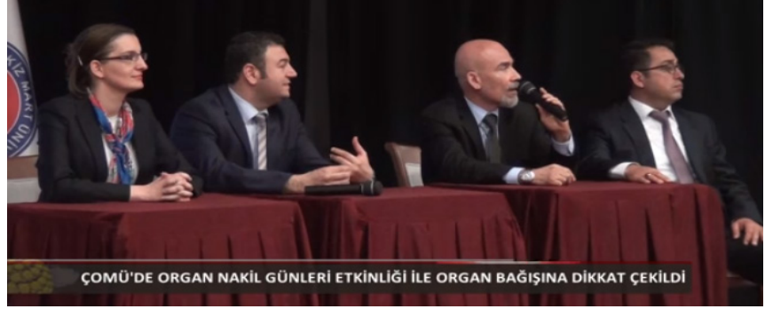
ÇOMÜ'DE ORGAN NAKİL GÜNLERİ ETKİNLİĞİ İLE ORGAN BAĞIŞINA DİKKAT ÇEKİLDİ