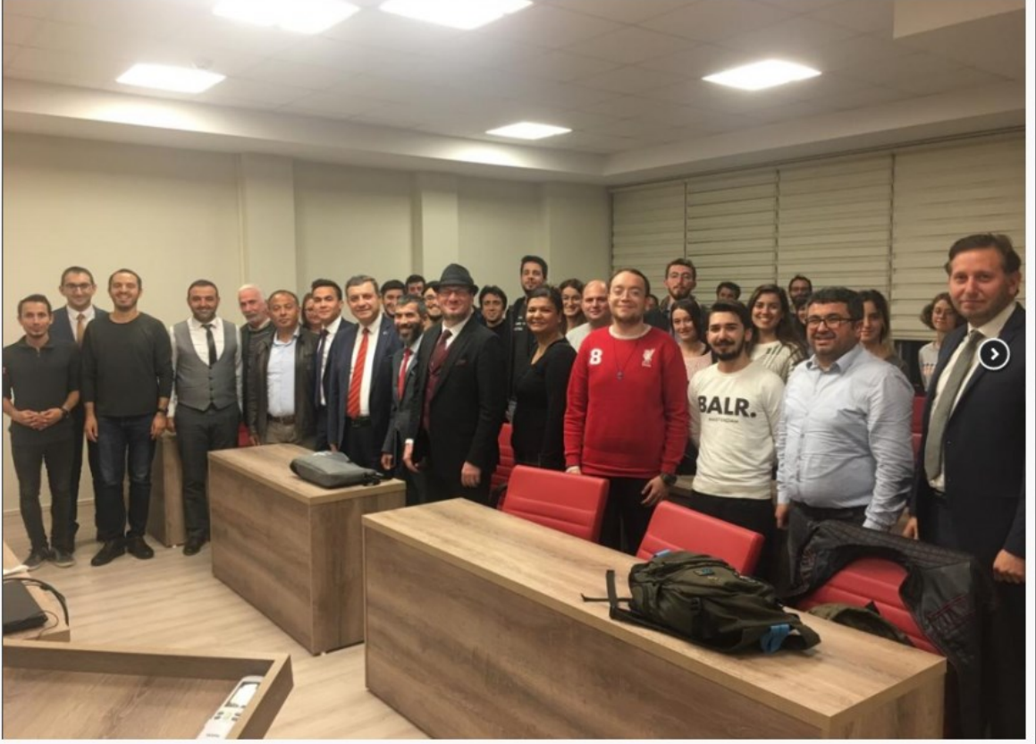
Öğrencilerimiz TUREB ve ÇARO yetkilileri ile biraraya geldi