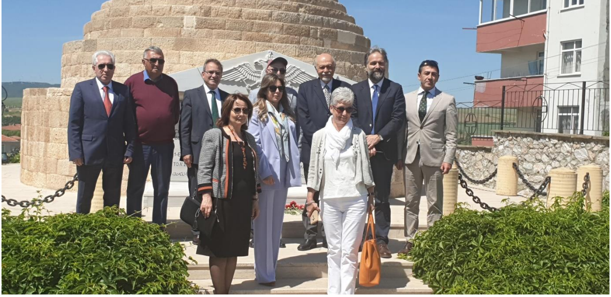
Tùrkiye ve Rusya heyetleri birlikte, Rus anıtında bir anma töreni gerçekleřtirdi. (23 Mayıs 2019)