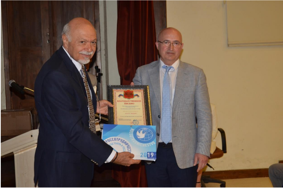
Panel ve sonrasında teşekkür takdimleri gerçekleştirildi.